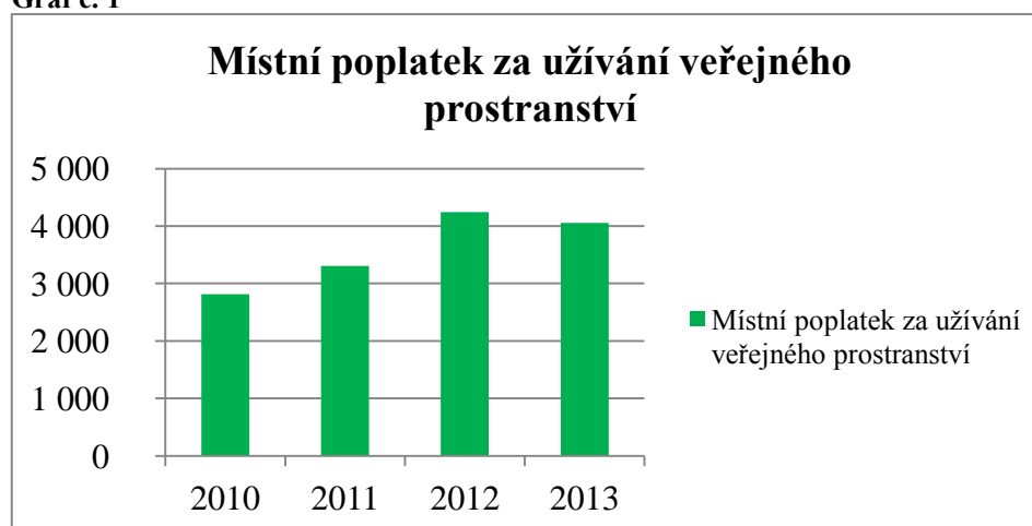
Graf č. 1