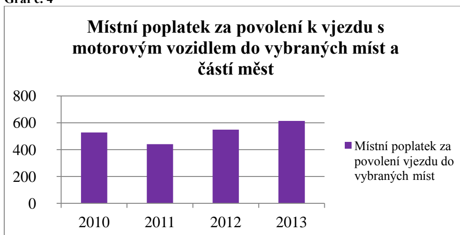
Graf č. 4