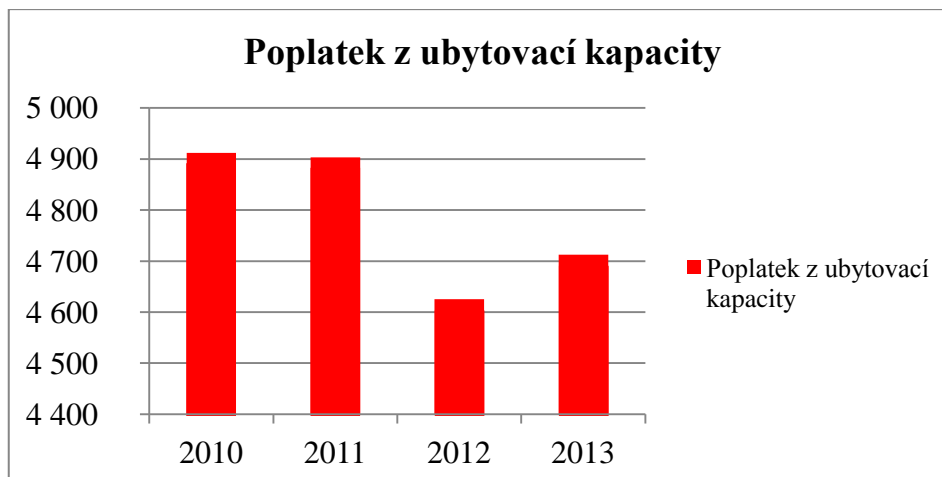
Graf č. 3