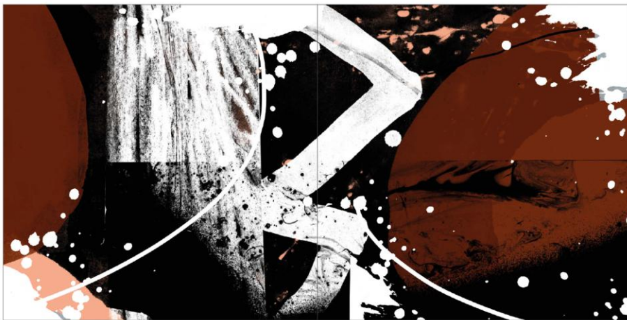
Obrázek 8 - ukázka zpracované koláže