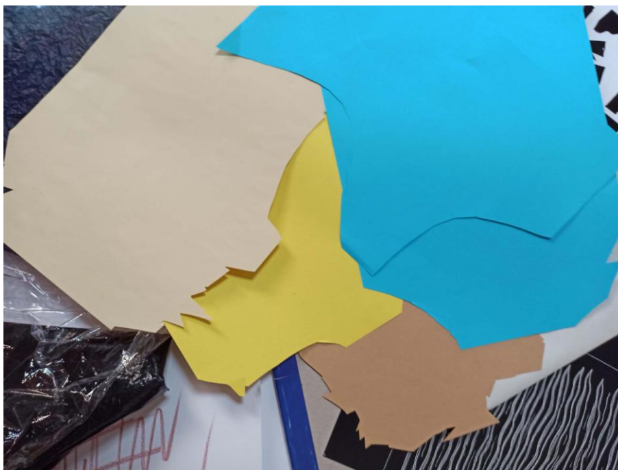
Obrázek 2 – odpad