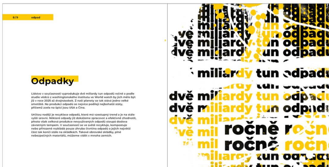
Obrázek 11 – finální rozložení stránek