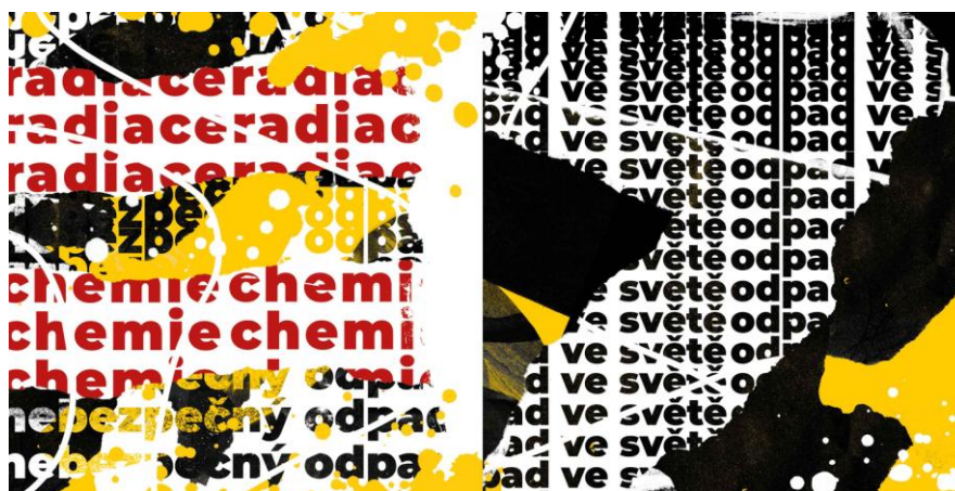
Obrázek 6 – ukázka zpracované koláže (vlastní fotografie)