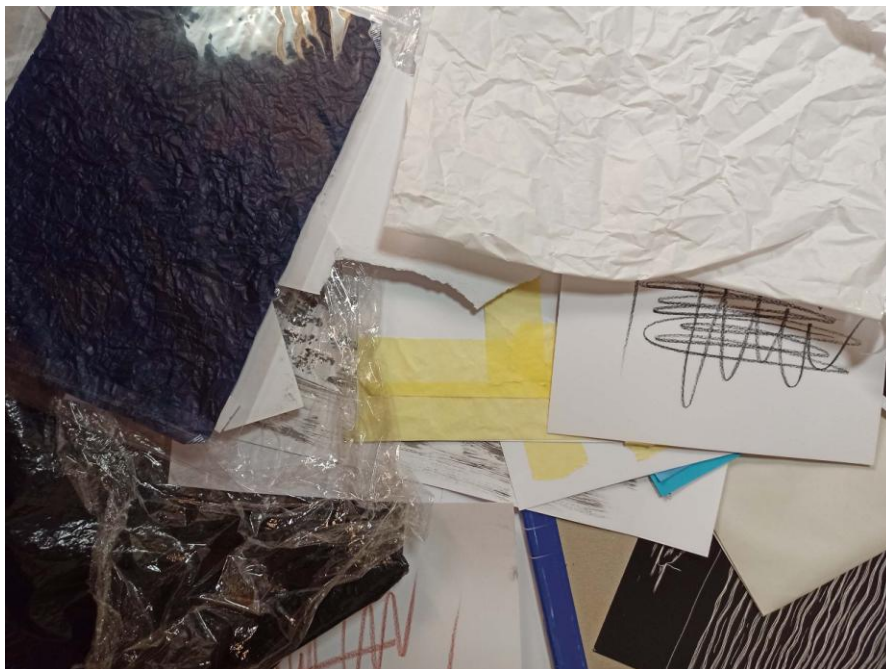
Obrázek 1 – odpad