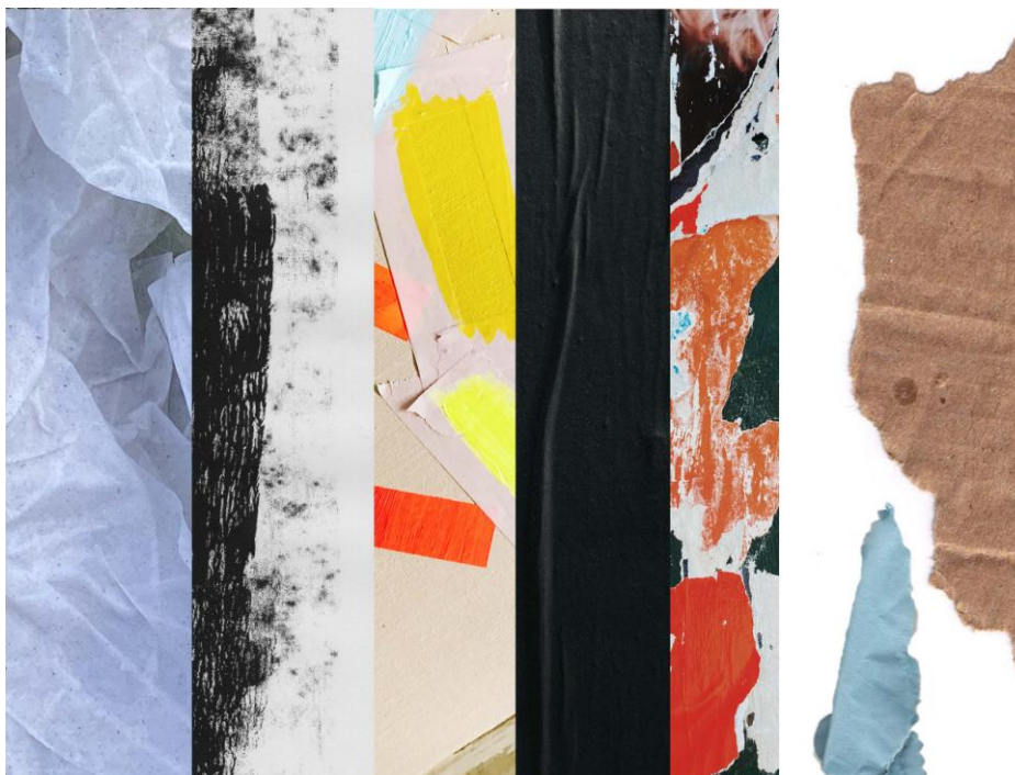
Obrázek 4 – naskenované materiály