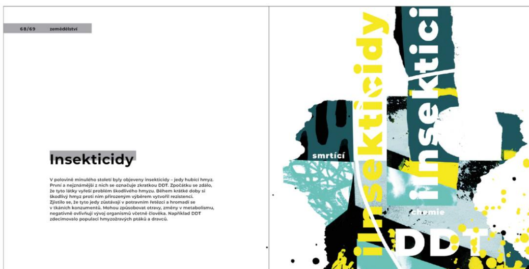
Obrázek 13 - finální rozložení stránek