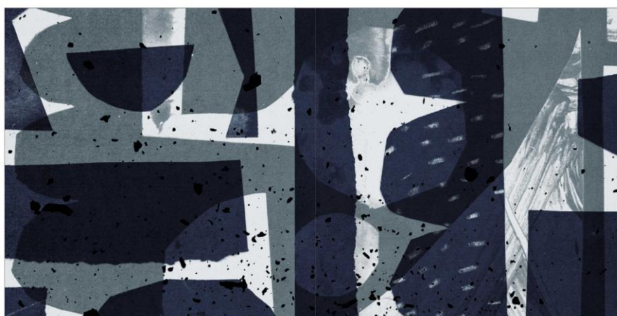
Obrázek 7 - ukázka zpracované koláže