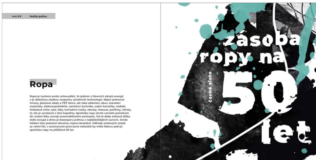
Obrázek 12 - finální rozložení stránek (vlastní fotografie)