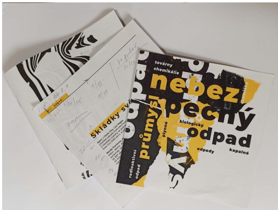
Obrázek 9 – ukázka makety knihy