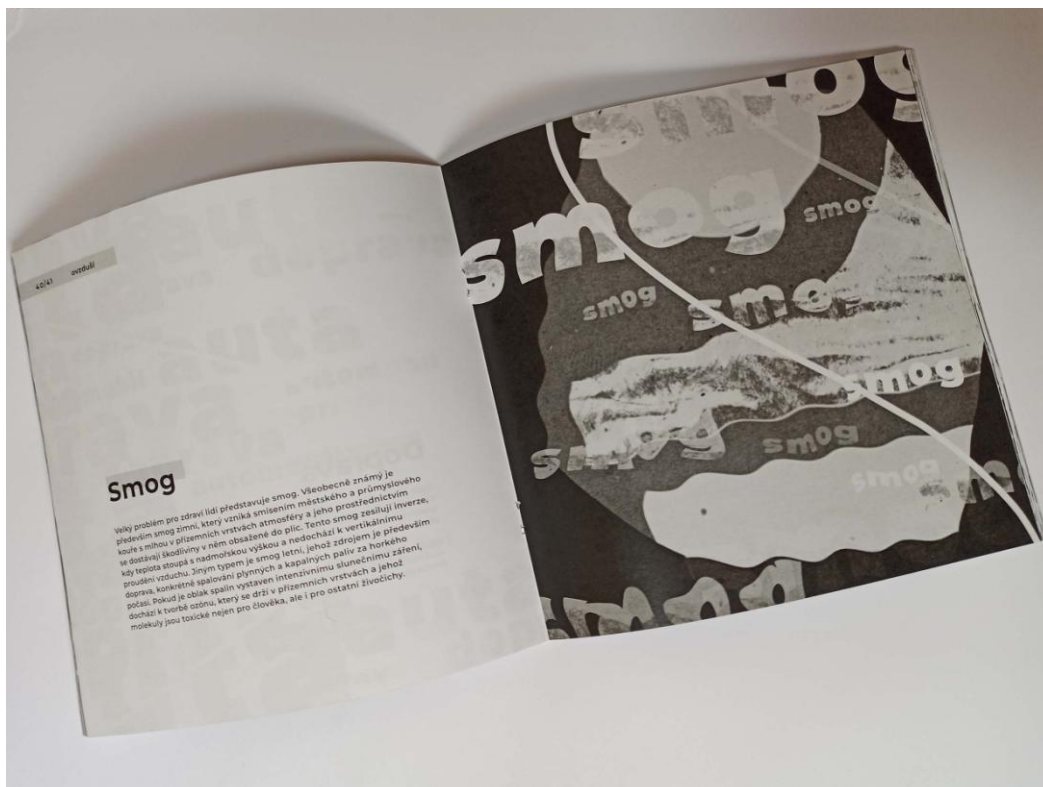
Obrázek 10 - ukázka makety knihy