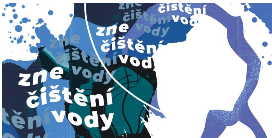
Obrázek 5 – ukázka zpracované koláže