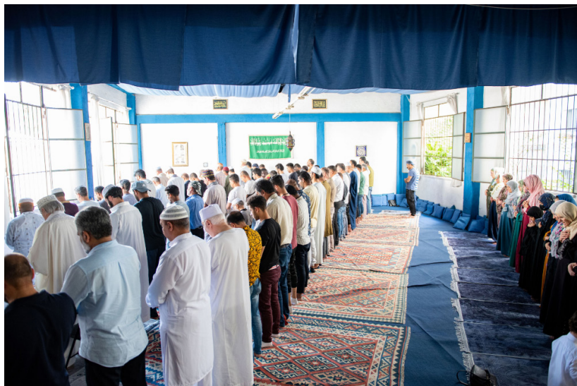
Obr. 5: Páteční modlitba v mešitě al-Wáhid.