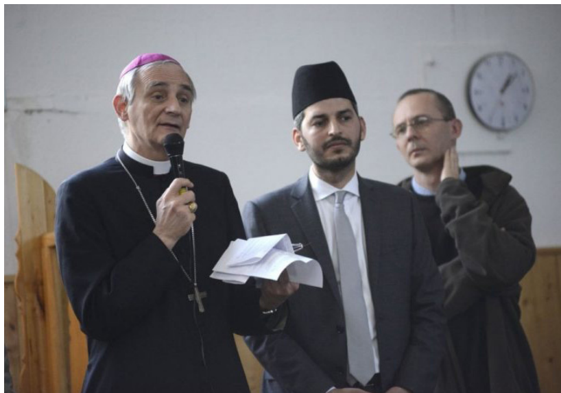
Obr. 4: Prezident UCOfI Jásín Lafram (napravo) a boloňský arcibiskup kardinál Matteo Zuppi při společné návštěvě mešity v Bologni. Oba muži jsou přáteli již od doby, kdy Lafram působil pouze jako prezident boloňského islámského kulturního centra.