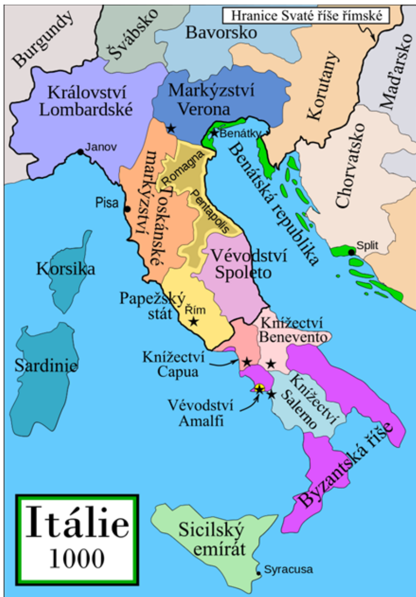
Obr. 1: Itálie v roce 1000.