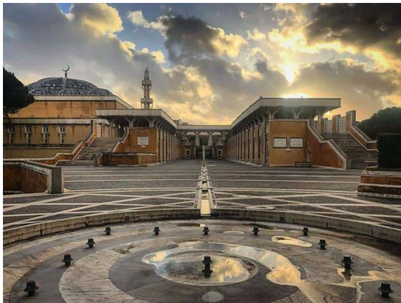
Obr. 2: Velká mešita v Římě – nádvoří s fontánou, vzor dláždění napodobuje náměstí Piazza del Campidoglio navržené Michelangelem Buonarottim.

proběhlo v den letního slunovratu 21. června 1995 a to opět za přítomnosti tehdejšího italského prezidenta Oscara Luigiho Scalfaro. 6 Dodnes se jedná o největší mešitu v Evropě a jednu z největších v západním světě, budova může najednou hostit až 12 tisíc věřících a ve významné dny jako je např. Svátek oběti její prostory navštíví přibližně 30 až 40 tisíc věřících. 7