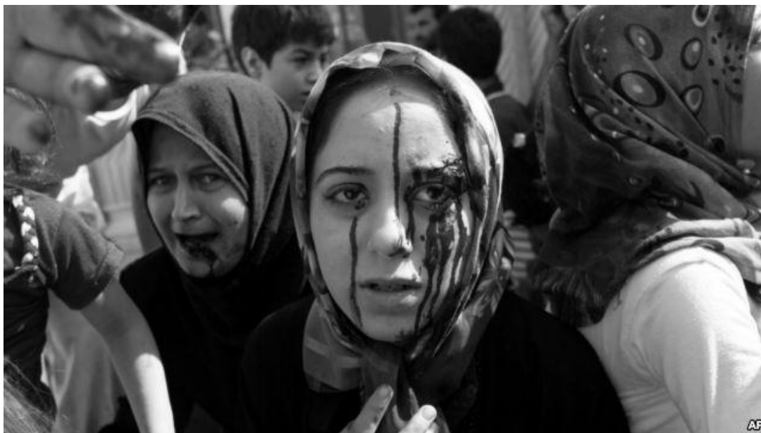
Žena o útoku na Aleppo v roce 2012 186