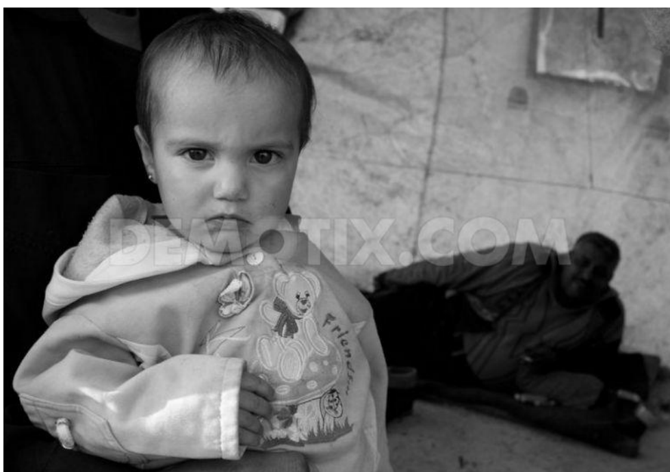
Holčička v kempu Azaz. 189