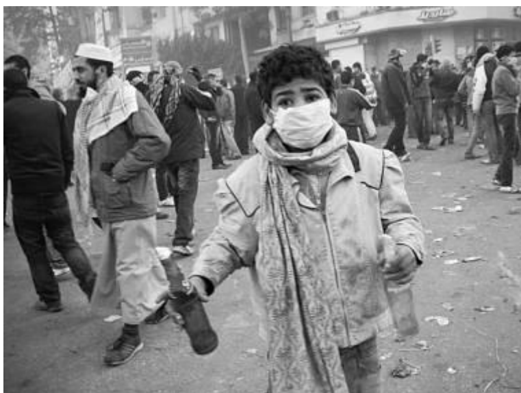
Protesty proti armádě v Egyptě 2012. 183