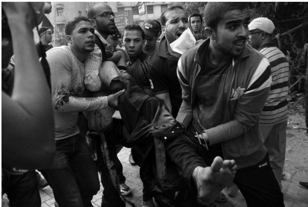
Protesty v Egyptě 2013. 184