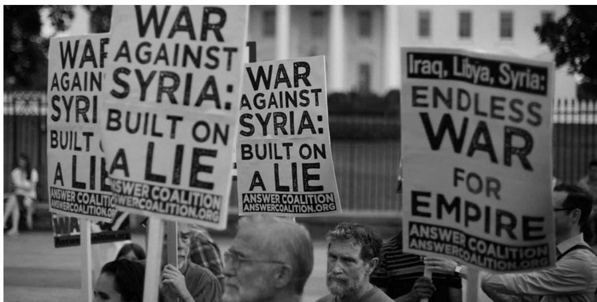
Demonstrace v New Yorku v srpnu 2013 proti válce v Sýrii. 192