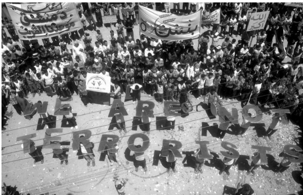
Protesty proti režimu Bašára Assada 188