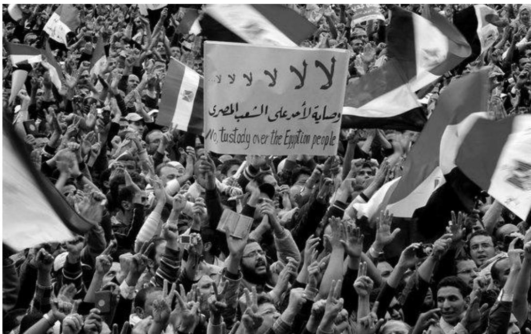
Náměstí Tahrír. 182