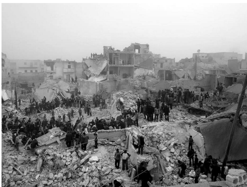
Zničené město v Sýrii 187