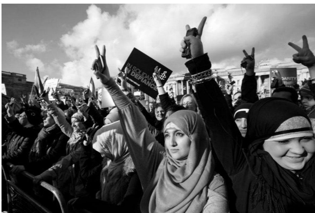
Ženy se aktivně účastní revoluce, 2012. 185