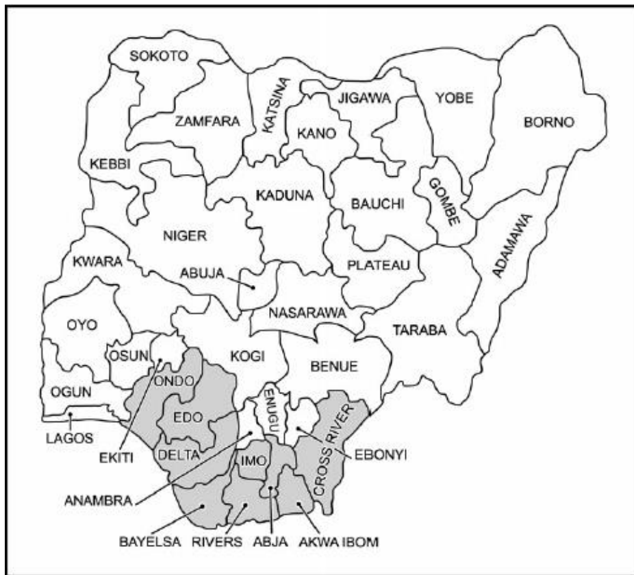
Příloha č. 1: Mapa nigerijské federace se zvýrazněnými státy nigerijské delty