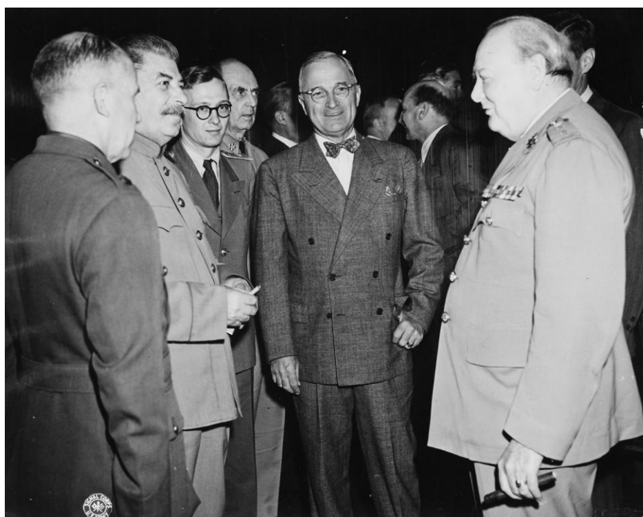
Příloha č. 4: Stalin, Truman a Churchill v Postupimi

http://www.calconnect.com/historical/yalta/yalta3.jpg