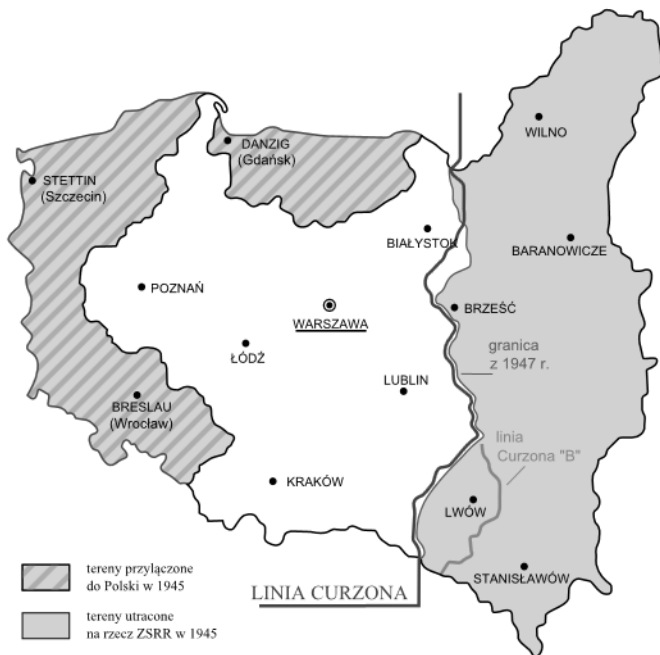
Příloha č. 6: Vytyčení polských hranic