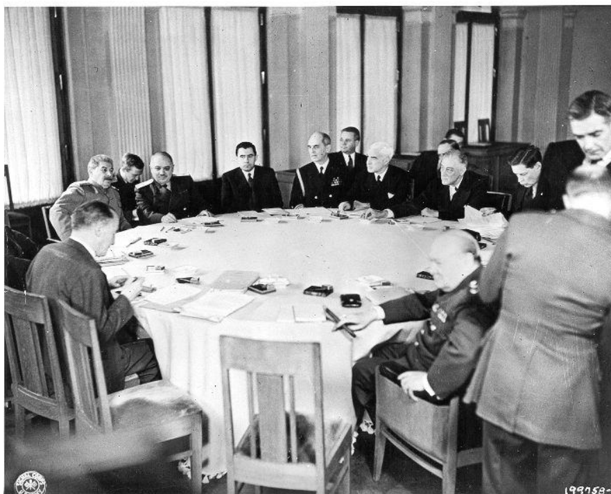
Příloha č. 3: Probíhající zasedání jaltské konference

http://www.calconnect.com/historical/yalta/yalta3.jpg