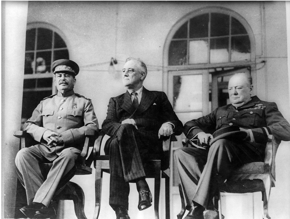
Příloha č. 1: Stalin, Roosevelt a Churchill v Teheránu

http://upload.wikimedia.org/wikipedia/commons/c/cf/Teheran_conference-1943.jpg