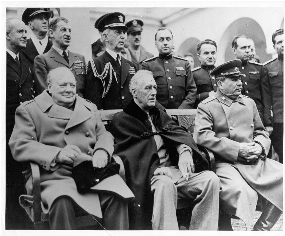
Příloha č. 2: Churchill, Roosevelt a Stalin v Jaltě