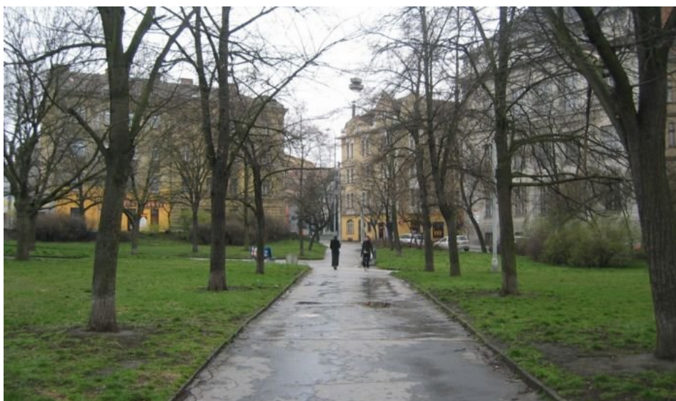
Příloha č. 2: Původní podoba Husova náměstí