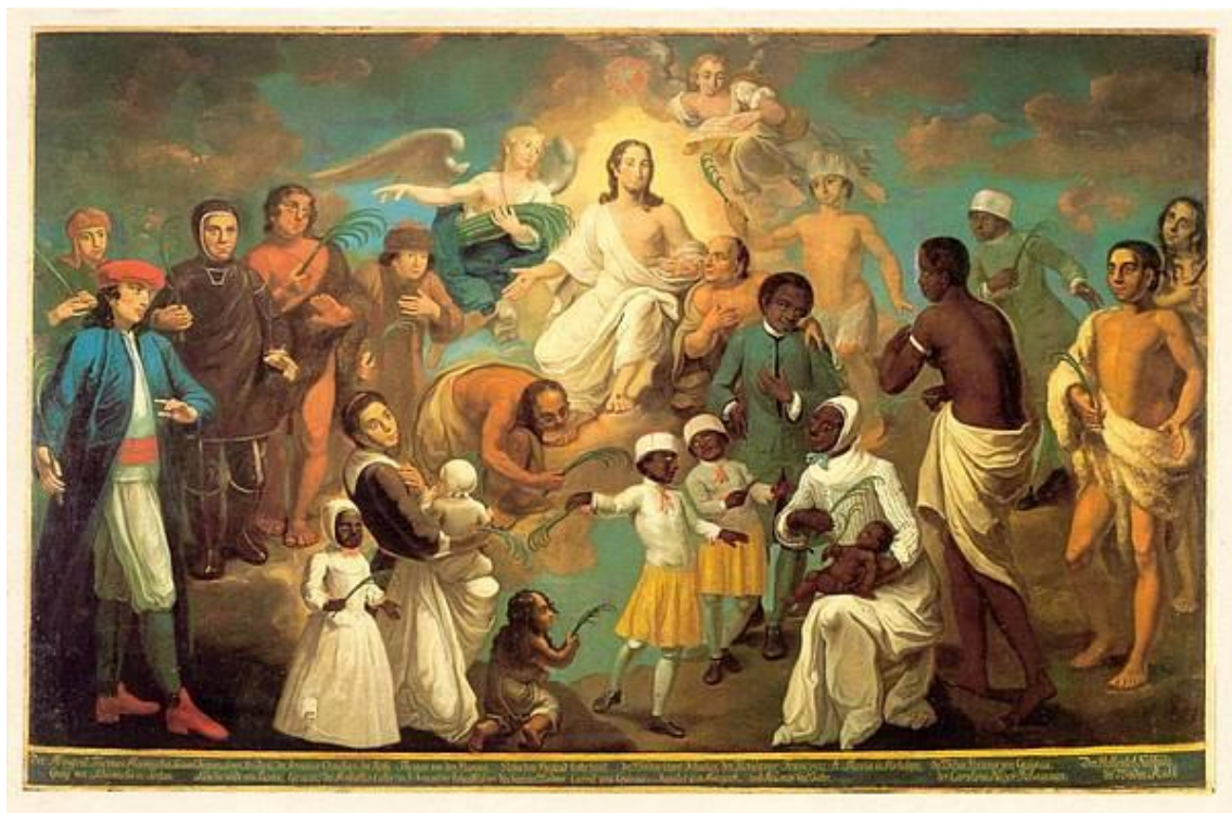
Obr. č. 4. Johann Valentin Haidt „Das Erstlingsbild“. Originál obrazu se dnes nachází ve městě Zeist v Holandsku. Haidt zde údajně namaloval první pokřtěné pohany, kteří zemřeli do roku 1748.