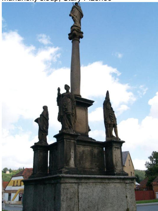
Mariánský sloup, Starý Plzenec