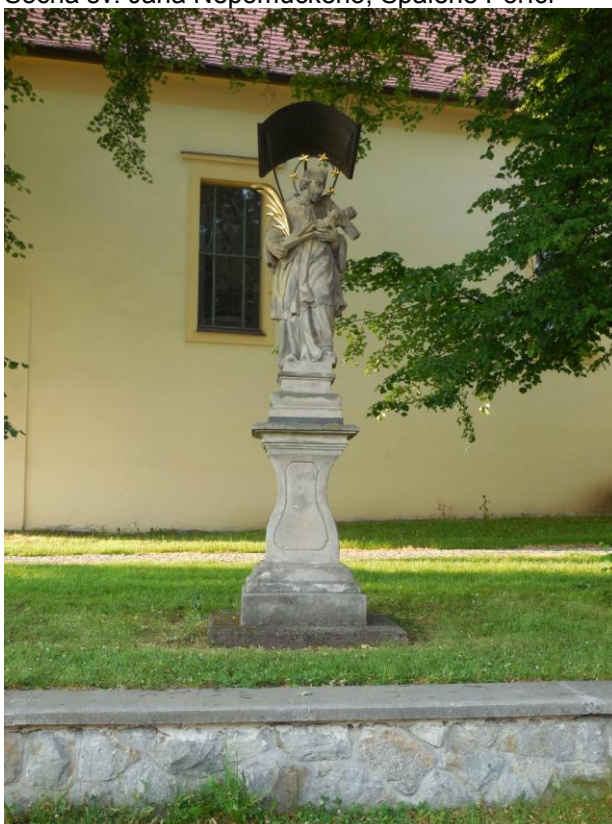
Příloha č. 90

Socha sv. Jana Nepomuckého, Spálené Poříčí