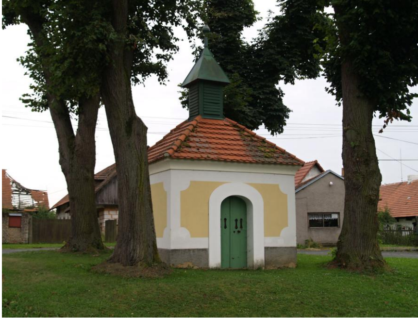
Příloha č. 6 Kaple, Chlum