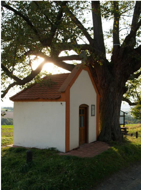
Kaple sv. Anny pod Ticholovcem, Příchovice