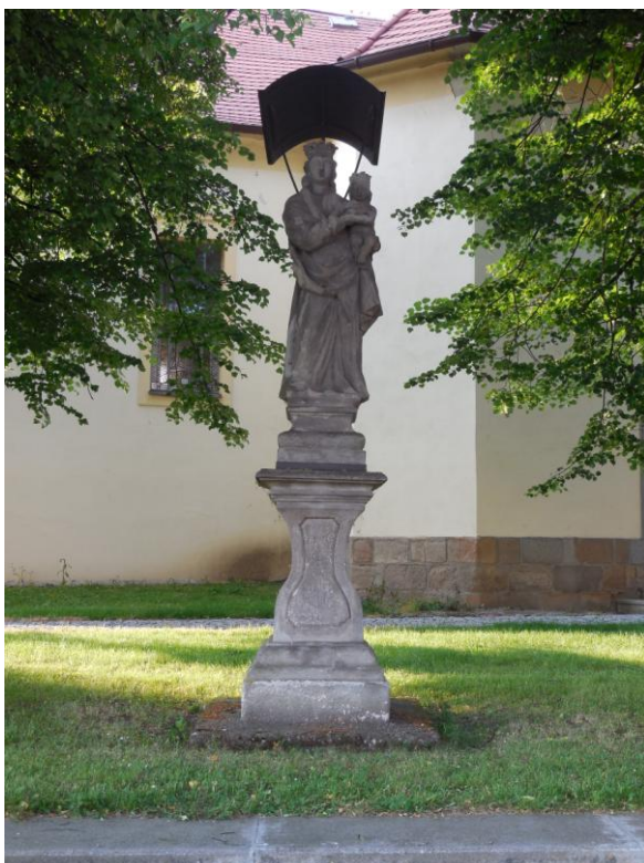
Příloha č. 89

Socha sv. Jana Nepomuckého, Spálené Poříčí