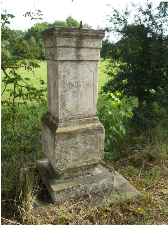
Socha sv. Jana Nepomuckého u mostu, Dolní Lukavice