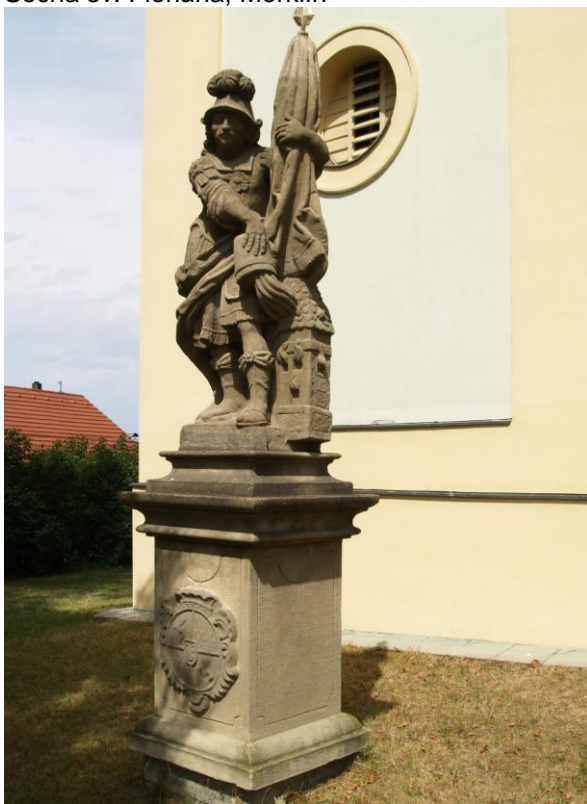
Příloha č. 26