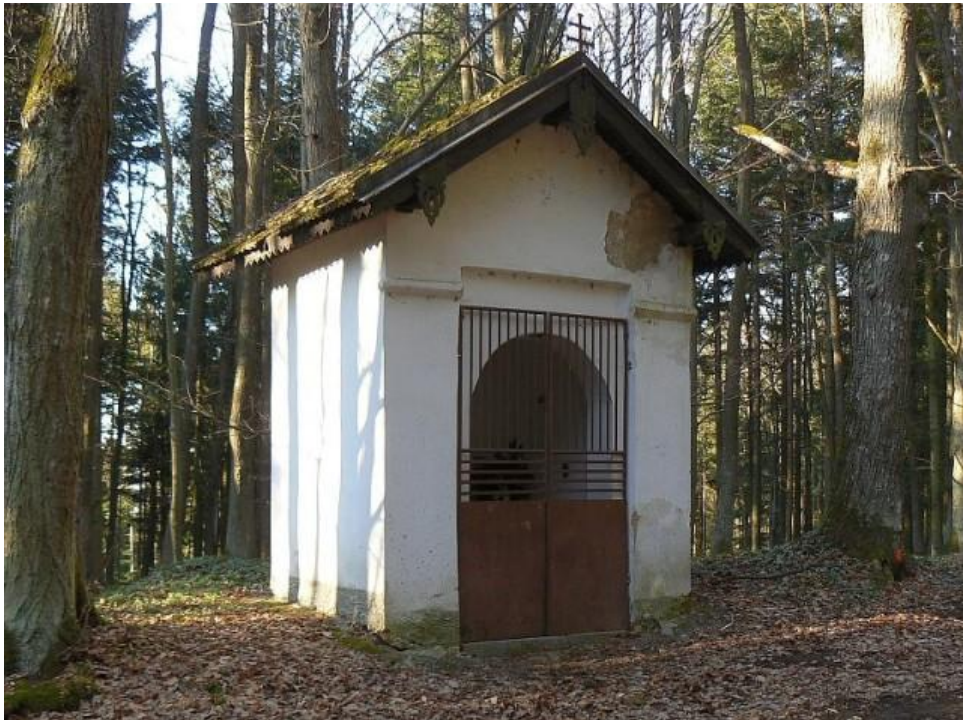
Příloha č. 8 Socha sv. Vojtěcha, Chocence