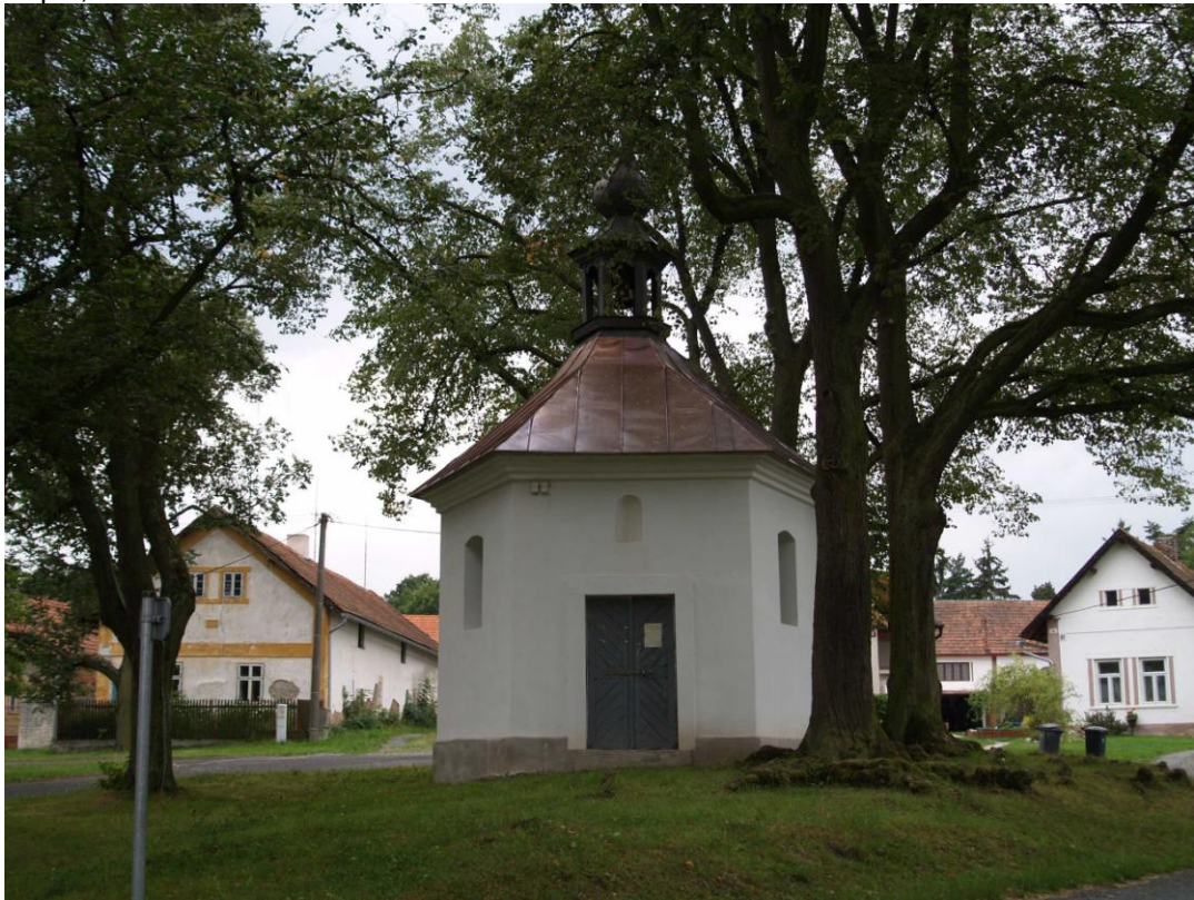
Příloha č. 7. Kaple sv. Rozálie se třemi hroby, Bzí