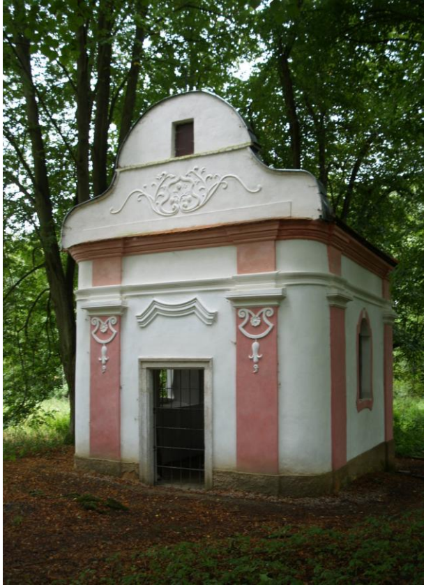
Příloha č. 11