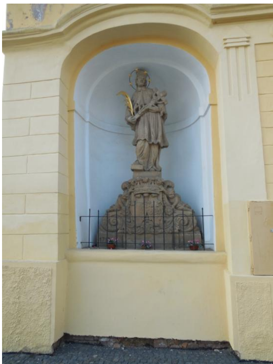
Příloha č. 91 Boží muka, Spálené Poříčí