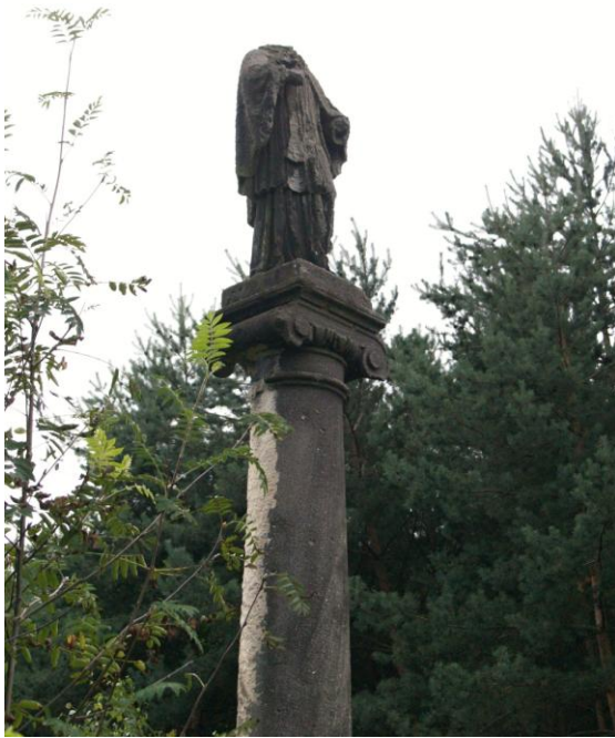
Příloha č. 69 Sloup před zámekem, Nebílovy