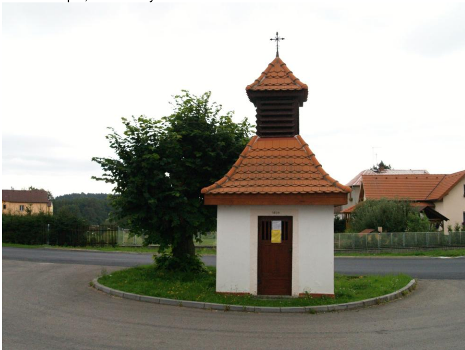
Návesní kaple, Nebílovský Borek