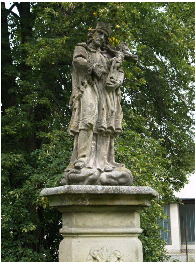
Příloha č. 9 Boží muka, Komorno