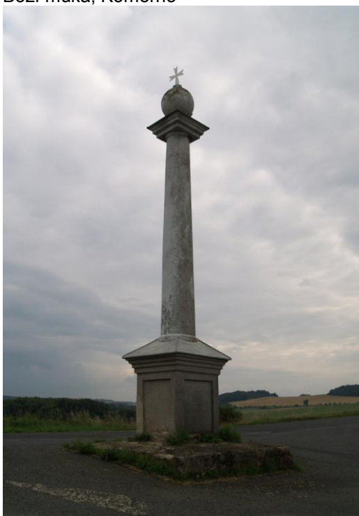
Příloha č. 10