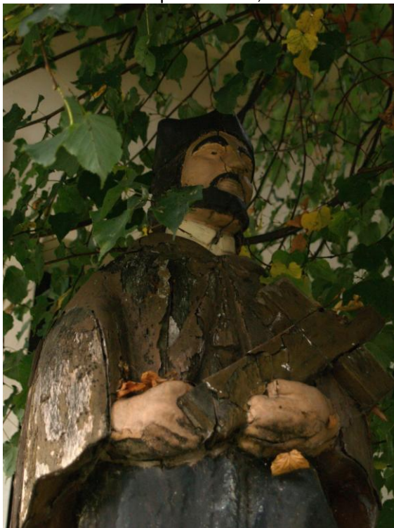
Socha sv. Jana Nepomuckého, Robčice