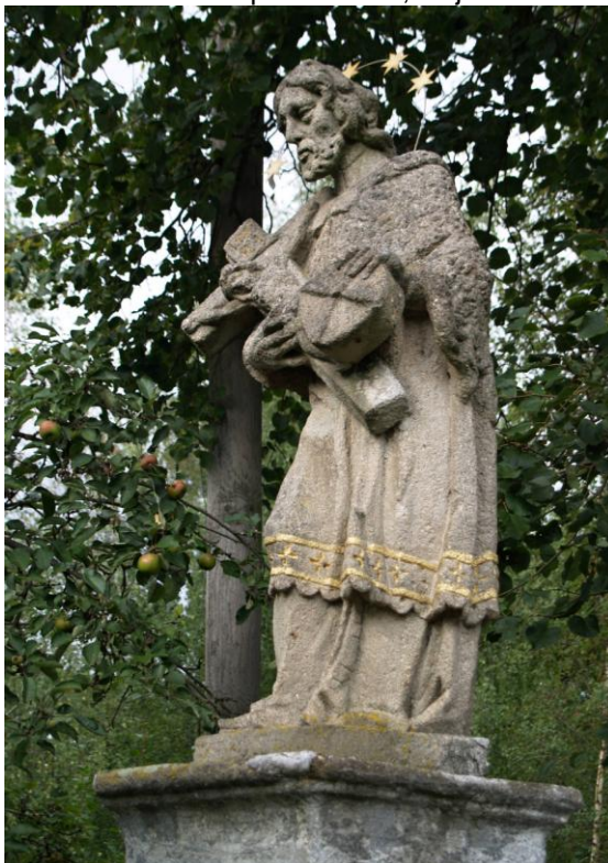
Socha sv. Jana Nepomuckého, Háje