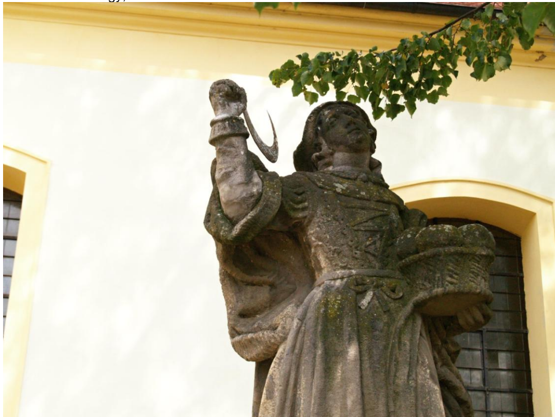
Socha sv. Notburgy, Merklín