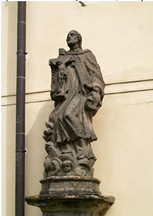
Apotéozza sv. Jana Nepomuckého, Lužany