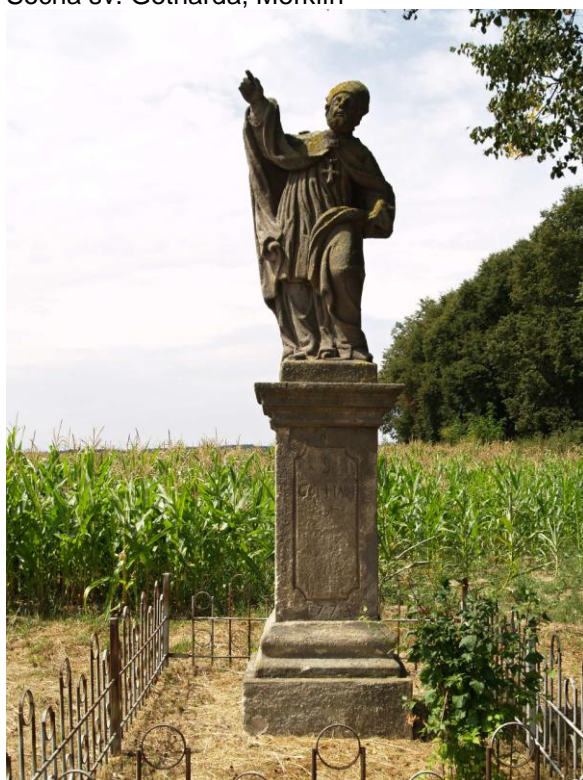
Socha sv. Gotharda, Merklín