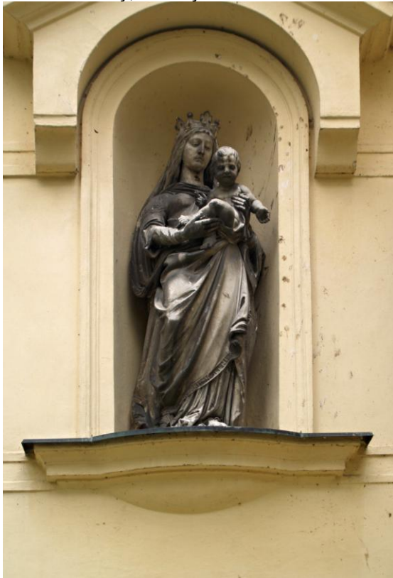
Socha Madony, Lužany