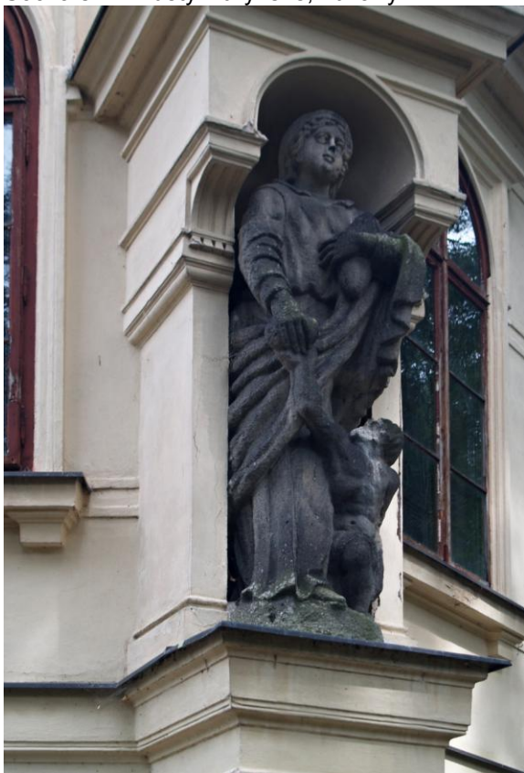
Socha sv. Alžběty Durynské, Lužany