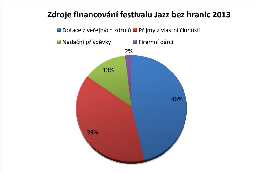
Graf č.2 Podrobnější vyobrazení zdrojů financování festivalu Jazz bez hranic 2013: 41