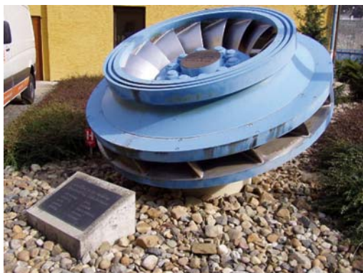
Obr. 1 Kaplanova turbína

Pro následující hodinu si žáci připraví prezentaci o absolvovaném výletu. Budou schopni odpovídat na dotazy učitele i svých spolužáků. Žáci získají mnoho informací a budou sami schopni diskutovat o výhodách a nevýhodách malých vodních elektráren. V závěru hodiny učitel zhodnotí jejich výkony a provede shrnutí.