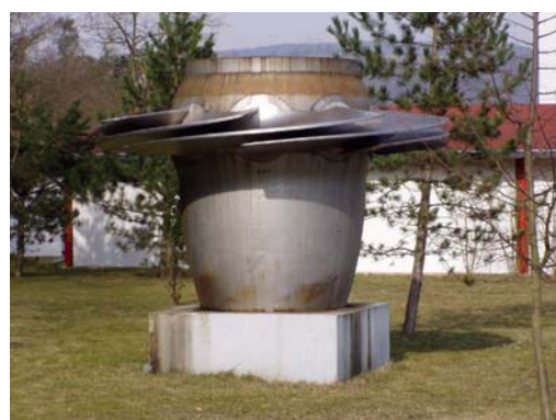
Obr. 2 Francisova turbína