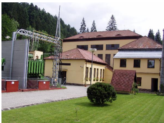
Obr. 3 Vodní elektrárna Vydra