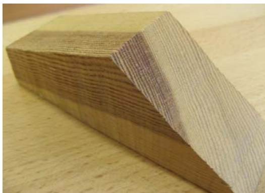
Obrázek 6: Jádrová dřevina (s bělí)

Jádrové dřeviny obsahují běl i jádro. Jsou od sebe barevně odlišeny – běl je světlejší, jádro tmavší. Jádro tvoří v průřezu dřeva větší podíl a proto je celkově jádrová dřevina tmavší než bělová.