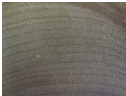
Obrázek 5: Roztroušeně pórovité