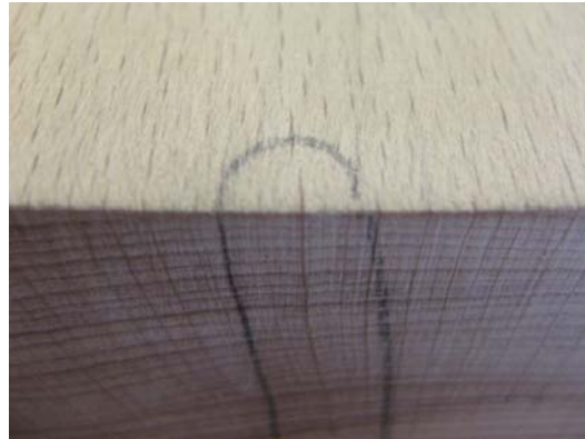
Obrázek 7: Dřeňové paprsky