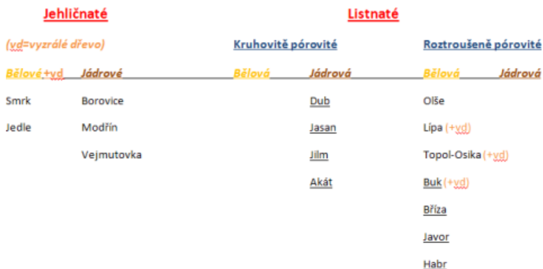
Obrázek 1: Hierarchie dřevin

Jednou z možností jak efektivně naučit studenty správnému rozpoznávání dřeva je pomocí mnou popsané vylučovací metody. Ta se zakládá na určité hierarchii, do které se zařadí dřeviny, které chceme, aby studenti uměli rozpoznávat. Dostačujícím se jeví umět rozpoznat dřevo rostoucí na našem území (obr. 1).