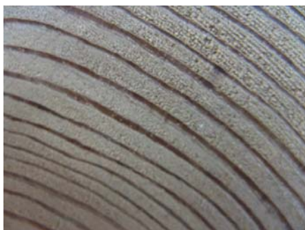
Obrázek 2: Jehličnatá dřevina

Listnaté dřevo neobsahuje pryskyřici, a proto po ní nevoní vůbec. Letokruhy jsou oproti jehličnatému dřevu užší a nejsou od sebe výrazně barevně odlišeny. Na čelním řezu můžeme vidět póry.