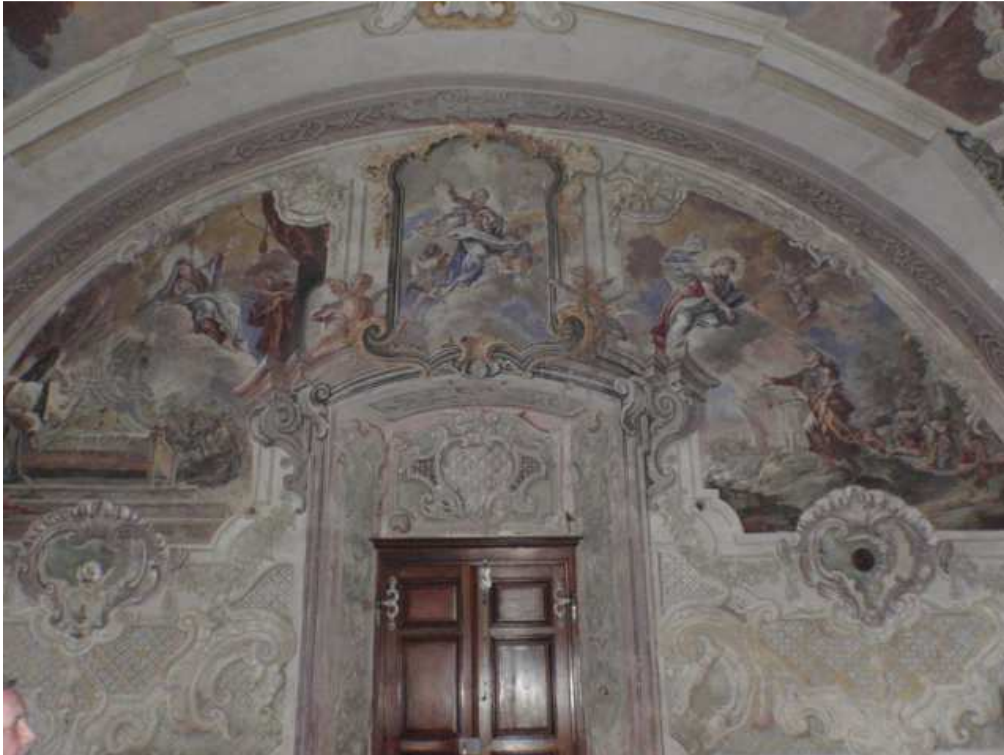
Obr. č. 9: Freska v kapitulní síni v klášteře Chotěšov

Autor František Julius Lux, polovina 18. století. Nad dveřmi motiv Nanebevzetí P. Marie, vpravo-motiv Hroznaty na břehu moře, vlevo zobrazení Vojslavy na smrtelném loži.