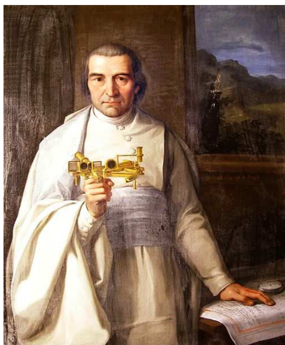
Obr. č. 19: Portrét Martina Aloise Davida commons.wikimedia.org [online]. [cit. 8. 3. 2015]. http://commons.wikimedia.org/wiki/File:Alois_Martin_David._portr%C3%A9t_1810.JPG .