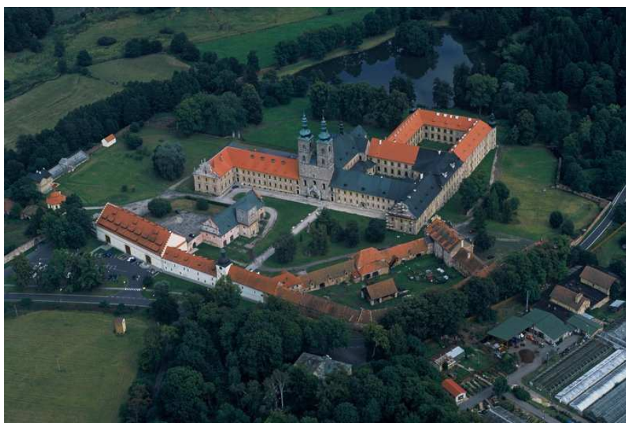
Obr. č. 4: Klášter Teplá. Letecký snímek.

Dostupné z: http://hroznata.namiste.cz/index.php?page=prilohy