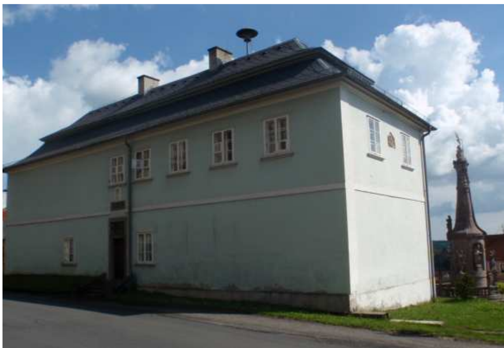
Obr. č. 11: Škola v Teplé Dnešní městský úřad.