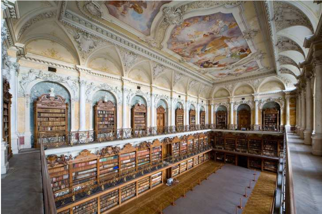
Obr. č. 16: Barokní sál knihovny v klášteře Teplá