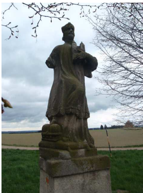
Obr. č. 2: Socha blahoslaveného Hroznaty u obce Pernarec (ležící v okrese Plzeň – sever) První písemná zmínka o obci je z roku 1219, v majetku kláštera Teplá.