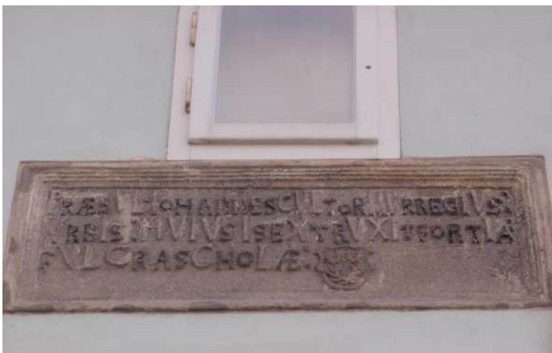
Obr. č. 11a: Detail nápisu nad vchodem do bývalé školy - se znakem Hroznatovců 11. 7. 2014. Teplá.