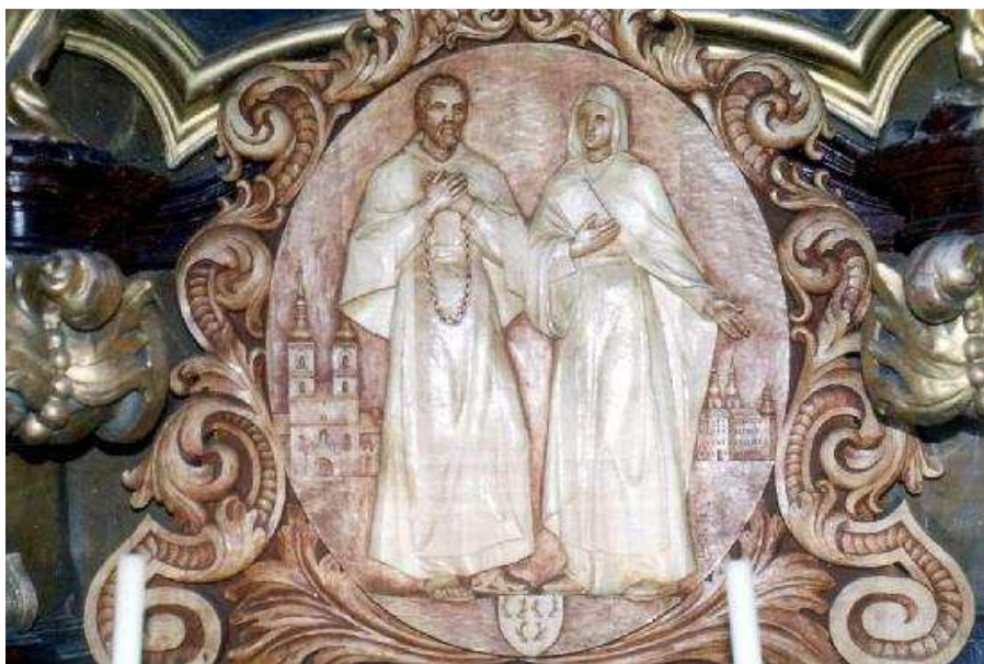
Obr. č. 7: Hroznata s Vojslavou

hroznata.namiste.cz [online]. [cit. 8. 3. 2015]. Dostupné z: http://hroznata.namiste.cz/index.php?page=prilohy#priloha05 .