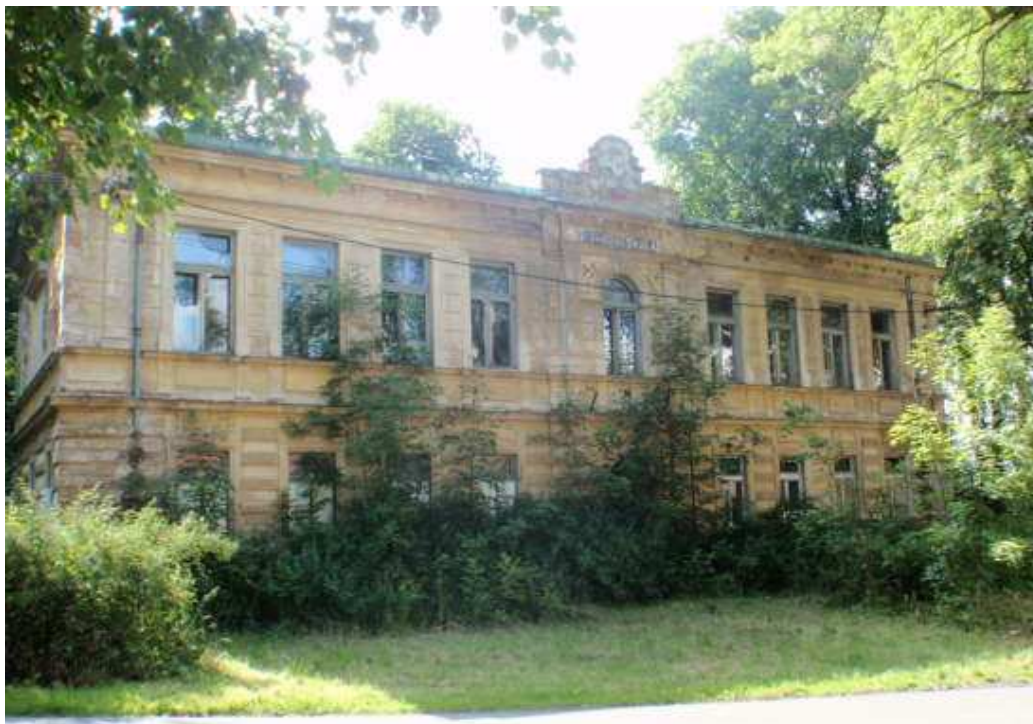
Obr. č. 12: Národní škola v blízkosti kláštera v Teplé