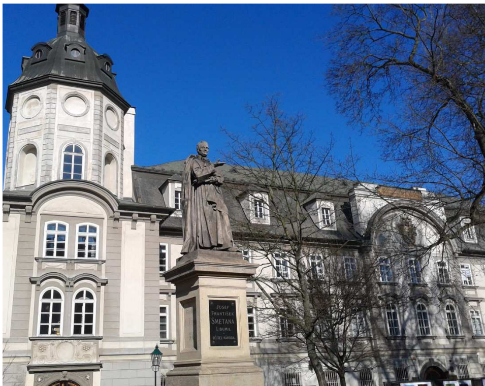
Obr. č. 17: Bývalý filozofický ústav v Plzni, dnešní Studijní a vědecká knihovna v popředí socha Františka Josefa Smetany