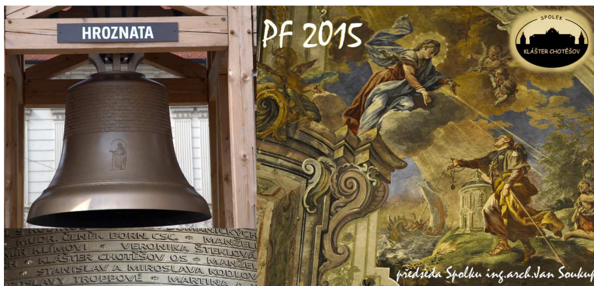
Obr. č. 21: Zvon Hroznata.

Jeden ze čtyř zvonů katedrály sv. Bartoloměje v Plzni. Na zvony byla vyhlášena veřejná sbírka, jedním z dárců byl Spolek kláštera Chotěšov (jak dokazuje nápis na zvonu). Druhá část obrázku je motiv Hroznaty u břehu moře detail fresky autor František Julius Lux, polovina 18. století.