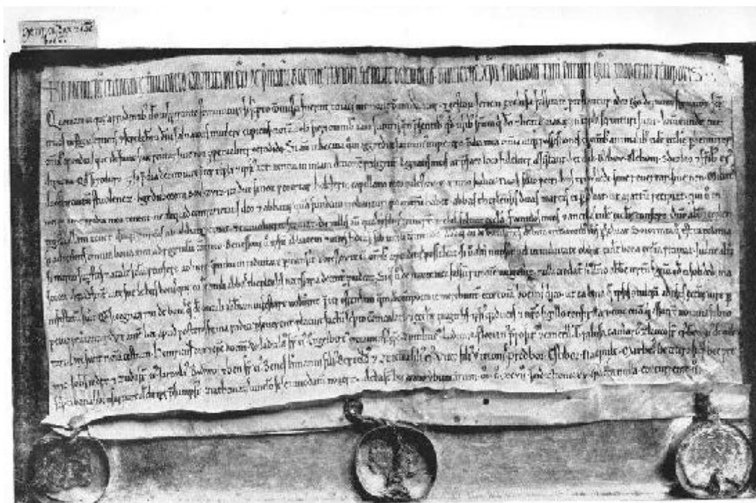
Průběh zámku a zřetelběhému klášteru z r. 1197.