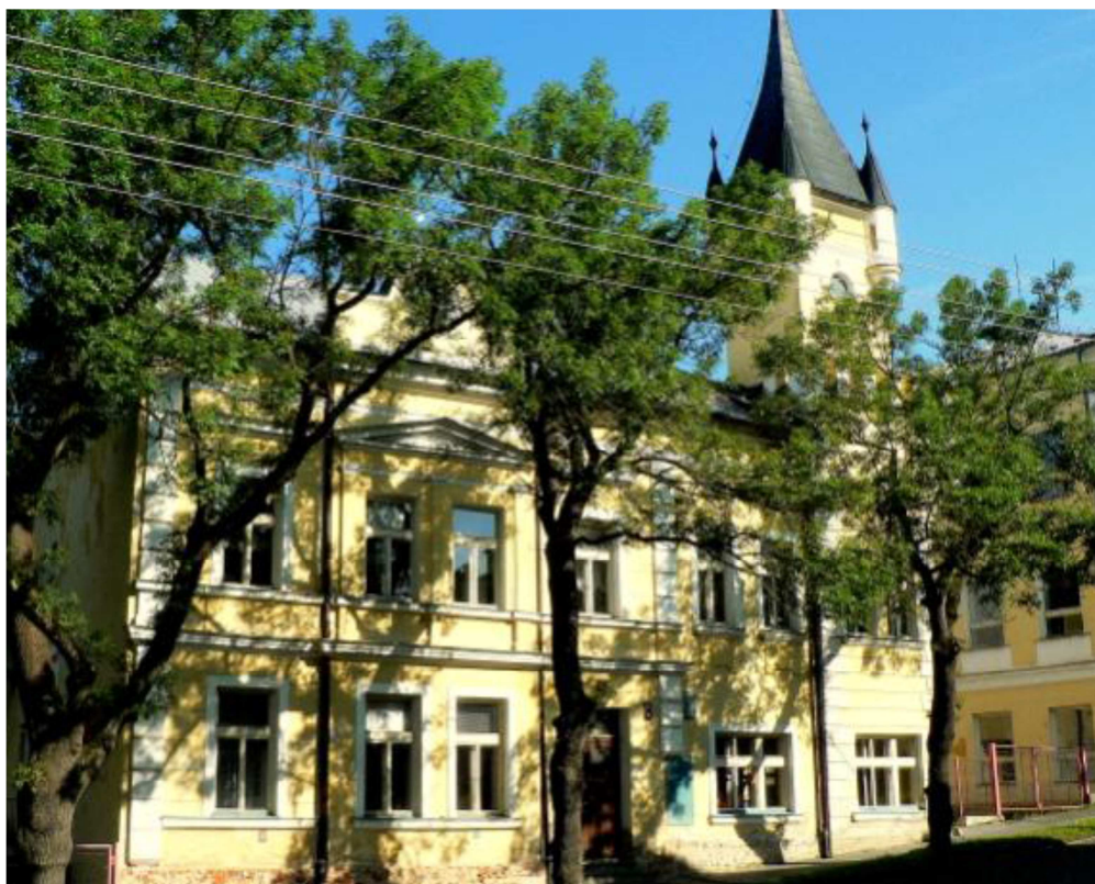
Obr. č. 13: Škola v Mariánských Lázních – Úšovicích 11. 7. 2014