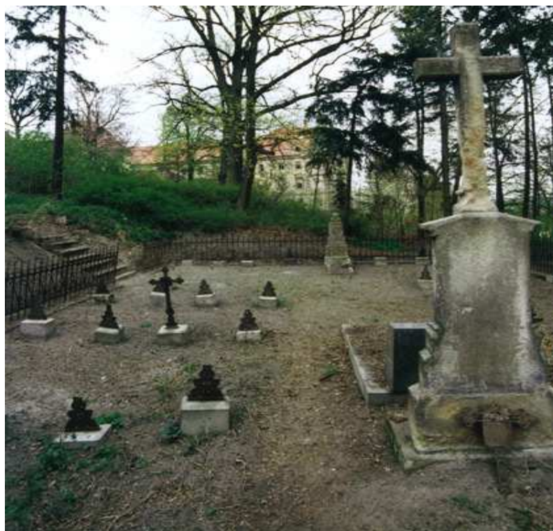
Obr. č. 8: Klášterní hřbitov v Chotěšově

hroznata.namiste.cz [online]. [cit. 8. 3. 2015]. Dostupné z: http://hroznata.namiste.cz/index.php?page=prilohy#priloha05 .