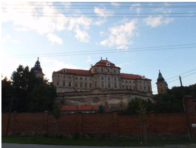
Obr. č. 6: Klášter Chotěšov