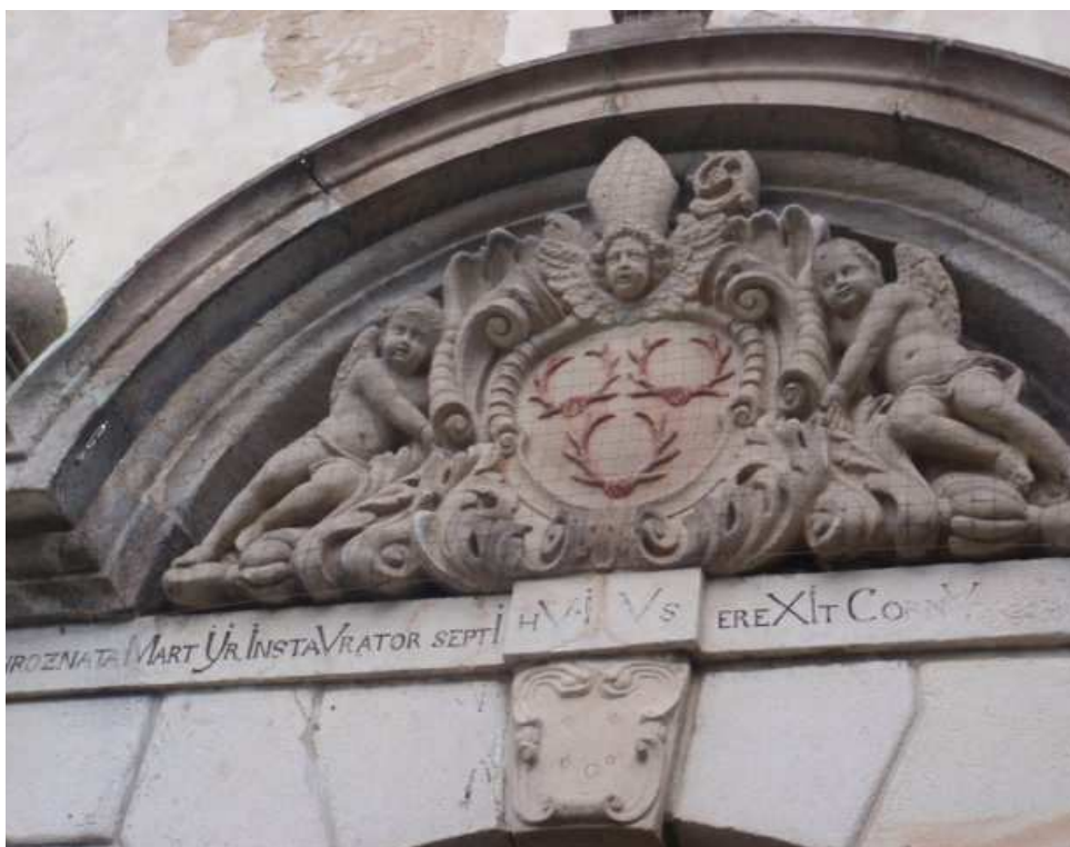
Obr. č. 20: Znak tepelského kláštera nad vstupem s oslavným nápisem