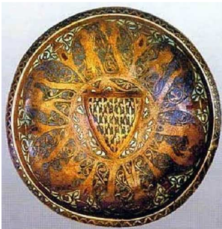
Obr. č. 5: Hroznotova mísa hroznata.namiste.cz [online]. [cit. 8. 3. 2015]. Dostupné z: http://hroznata.namiste.cz/index.php?page=prilohy#priloha27 .