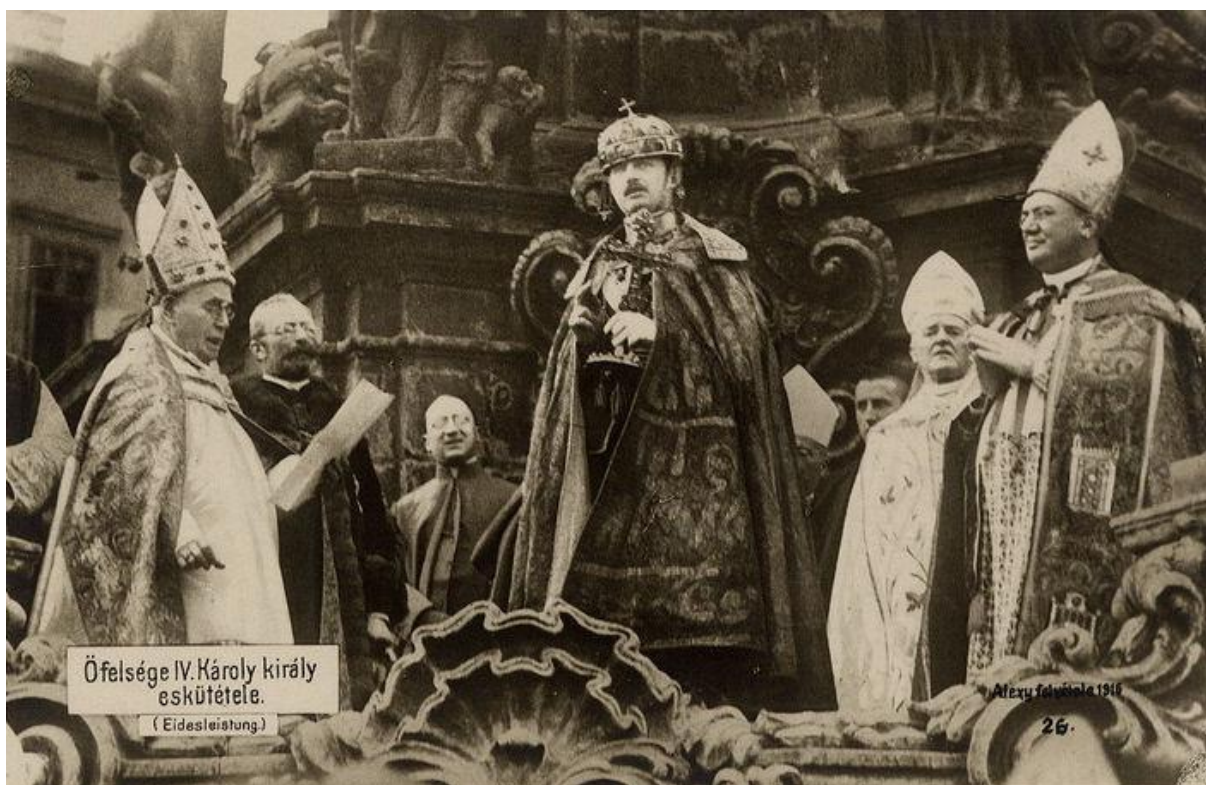
Císař Karel I. (jako uherský král Karel IV.) skládá slavnostní přísahu po své korunovaci na uherského krále – 30. 11. 1916

Zdroj: http://nobility.org/wp-content/uploads/2011/10/Karloath1.jpg