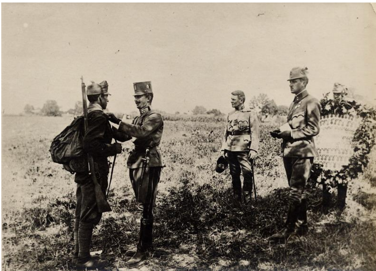
Karel na frontě vyznamenává vojáky – neznámá datace