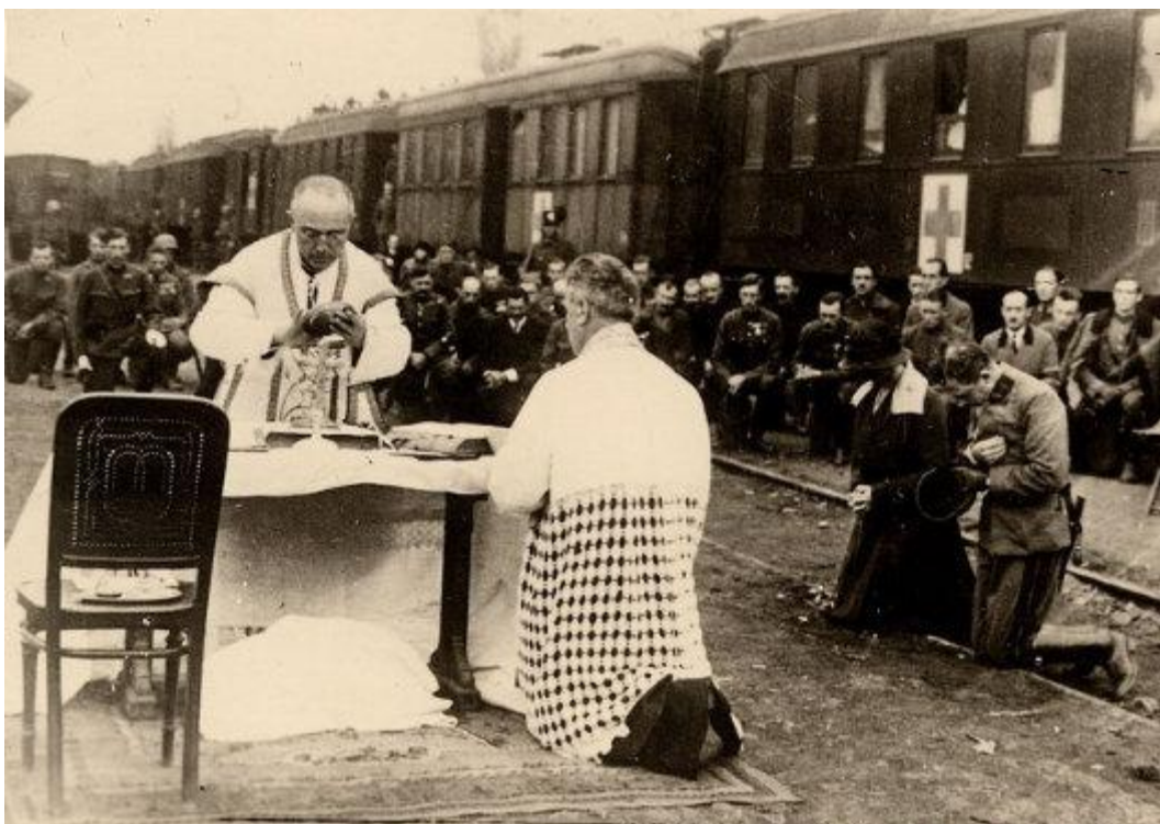
Karel a Zita klečí během polní mše na cestě do Budapešti během Karlova druhého pokusu o návrat na uherský trůn – 21. 10 1921

Zdroj: http://andrewcusack.com/net/world/hungary/