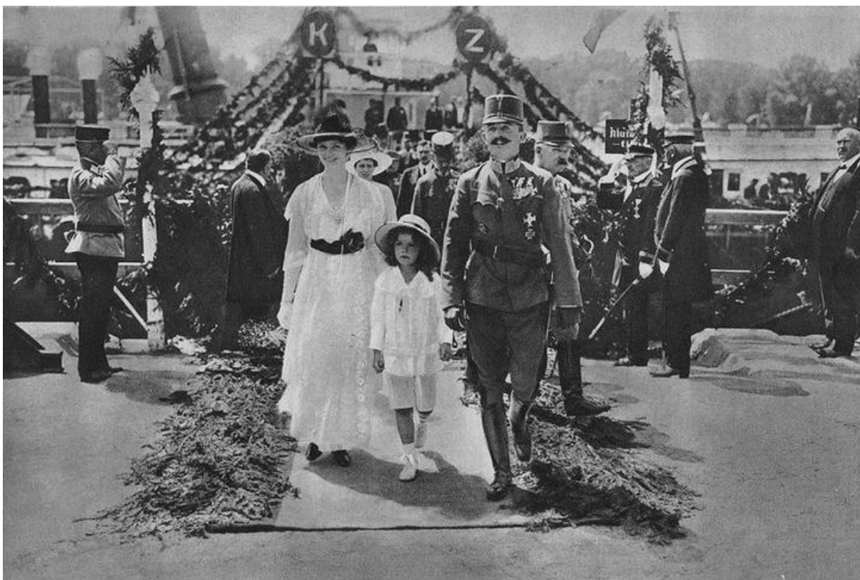
Karel, Zita a Otto na návštěvě Pozsony (dnešní Bratislava) – 1916