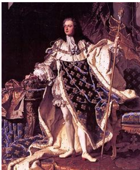
Příloha č. 7 – Ludvík XV. (1710–1774)