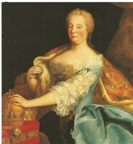
Příloha č. 2 – Marie Terezie (1717–1780)