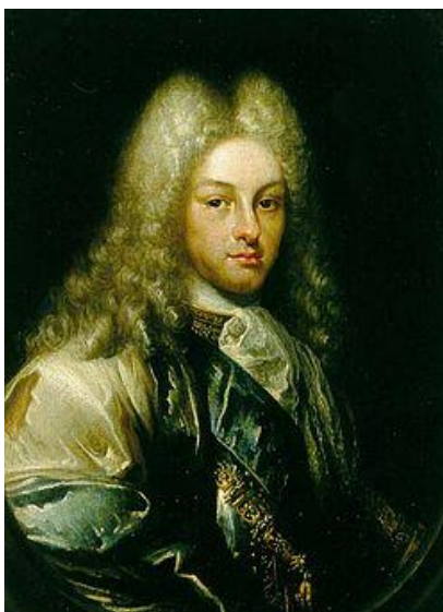
Příloha č. 8 – Filip V. (1683–1746)