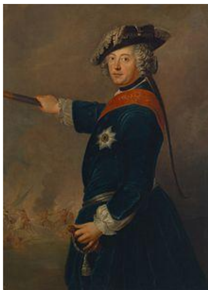
Příloha č. 3 – Fridrich II. (1712–1786)