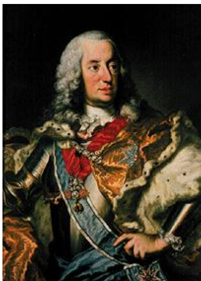
Příloha č. 6 – Karel VII. (1697–1745)