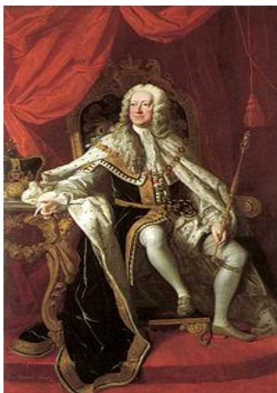
Příloha č. 7 – Jiří II. Anglický (1683–1760)