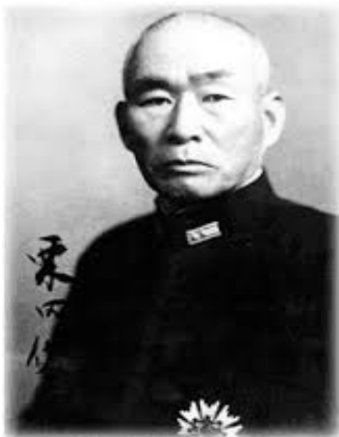
Takeo Kurita, 1889-1977

(Zdroj: http://www.geocities.jp/torikai007/1945/1944kamikaze.html . [cit. 2015-04-02]).