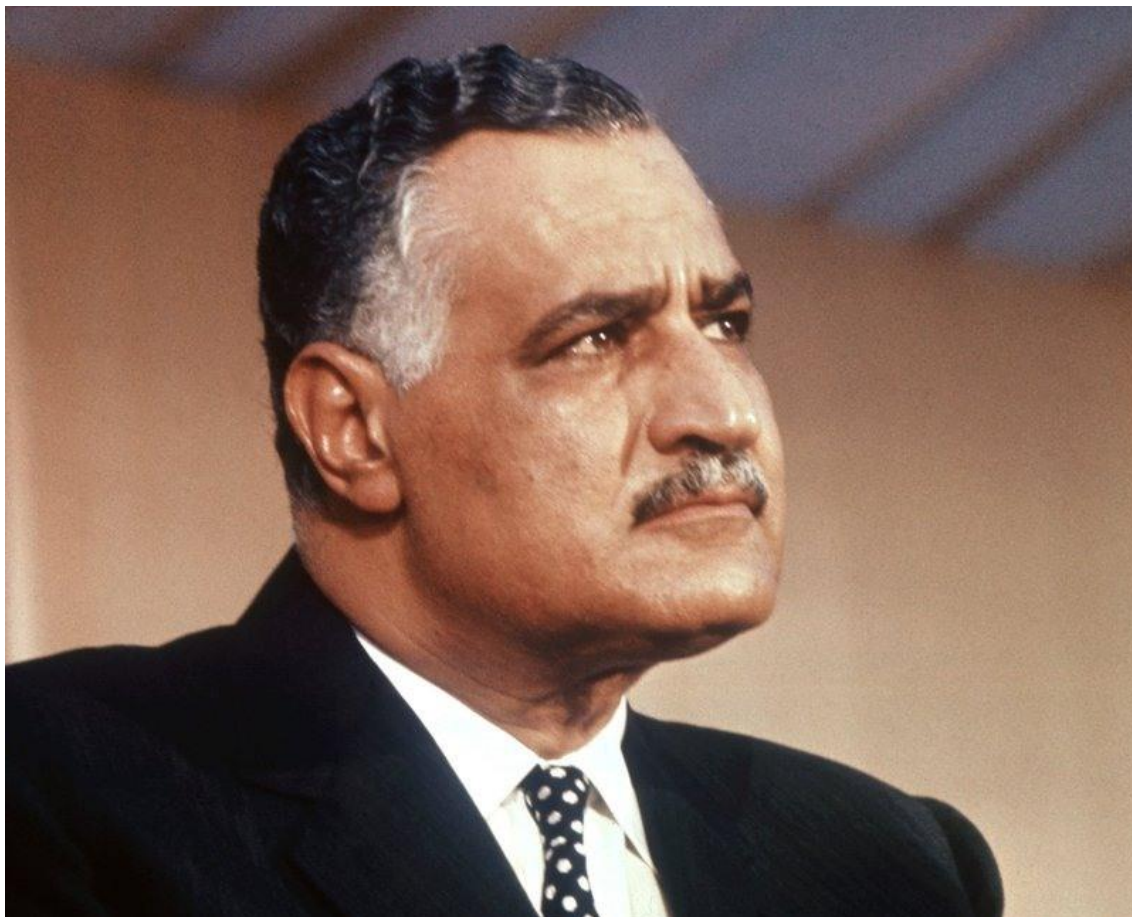
Příloha č. 3: Gamál Abdul Násir