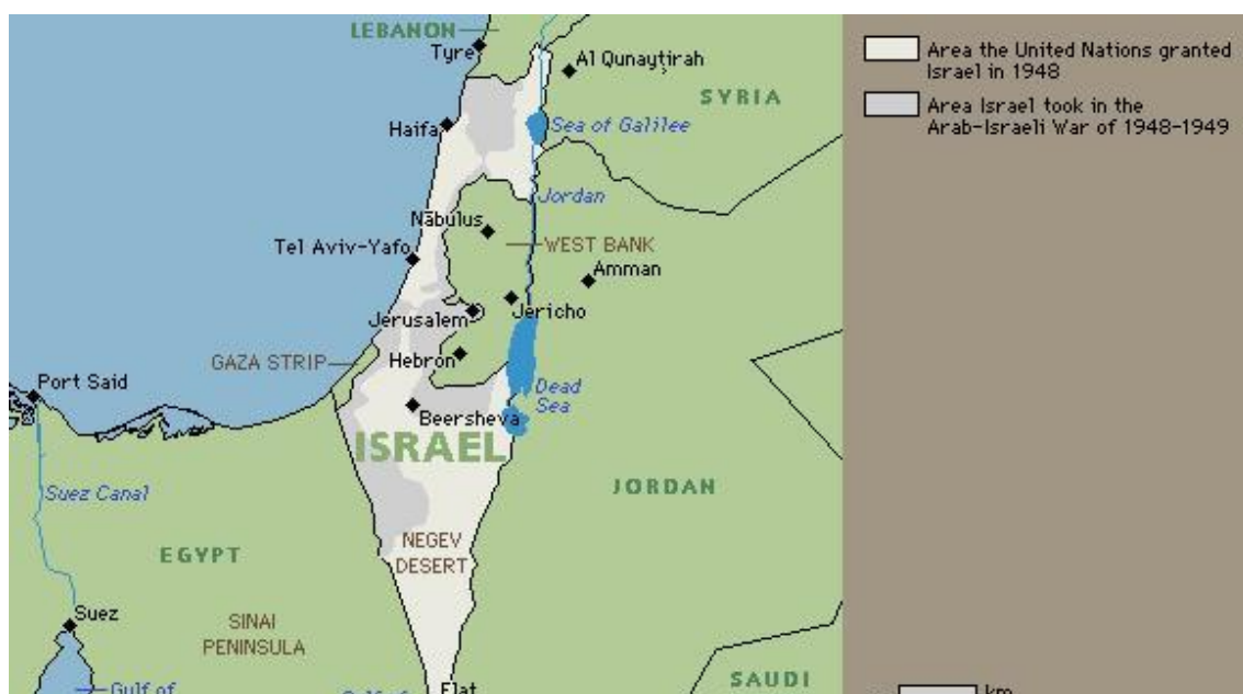
Příloha č. 2: Izrael v roce 1948

Zdroj: http://www.rr-middleeast.oie.int/images/Arab-Israeli.JPG