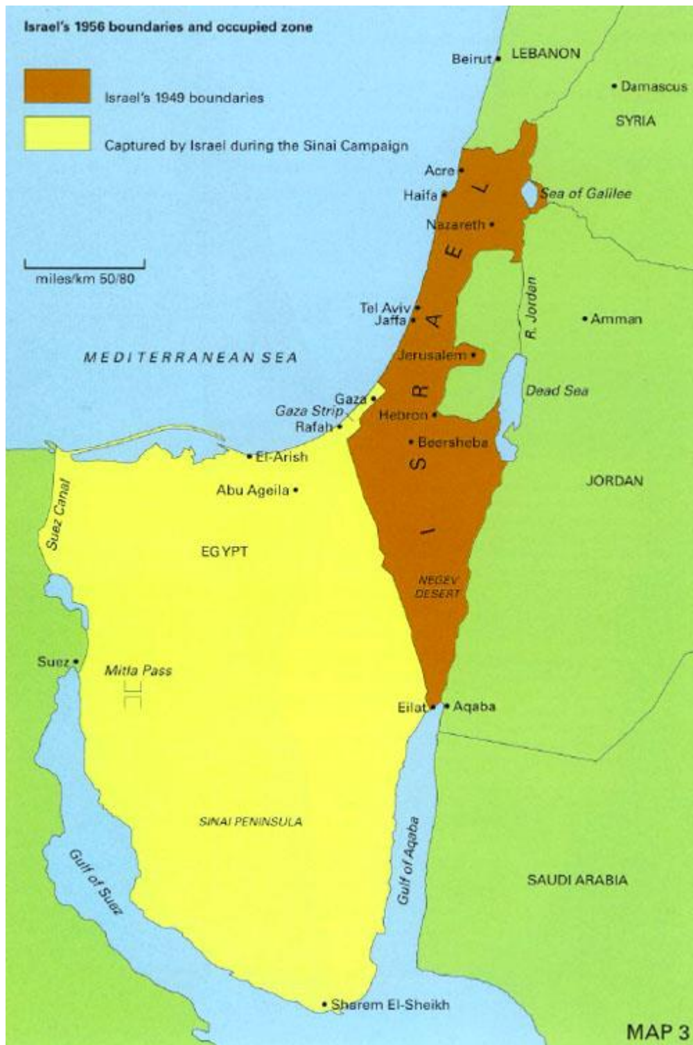
Příloha č. 4: Izrael před a po Suezské krizi