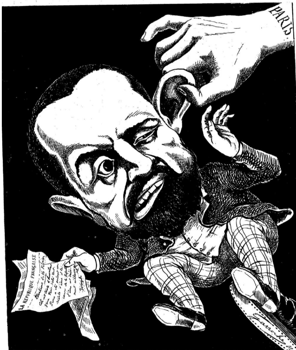
UNE CORRECTION MÉRITÉE