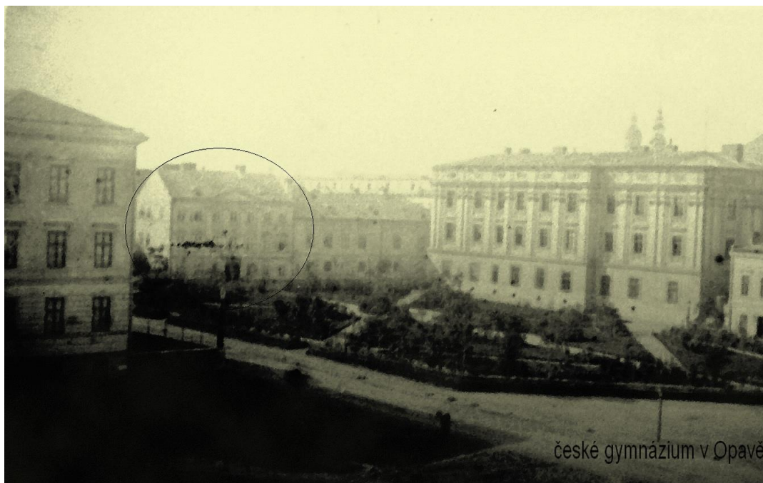
Historická fotografie gymnázia v Opavě