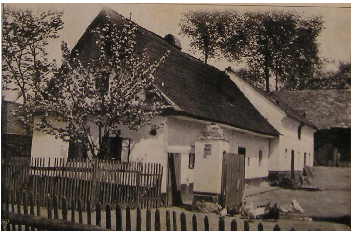
PEŘICH L., Slezský sborník – fotografie místa, odkud V. Prasek pocházel.