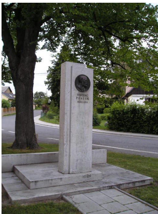
Fotografie pomníku Vincence Praska v Opavě