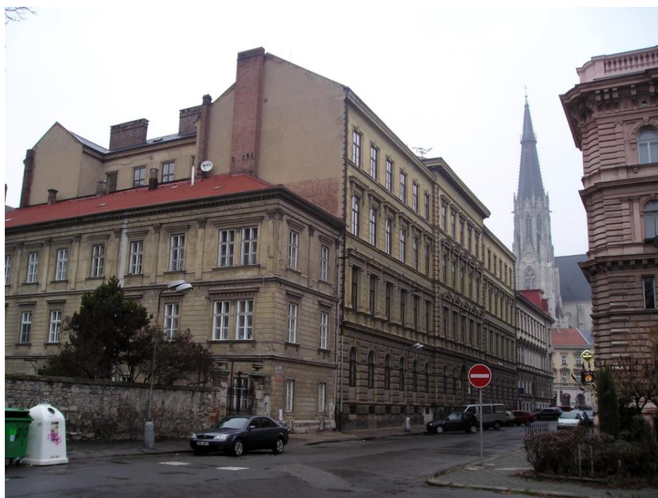
Slovanské gymnázium Olomouc Čerpáno z: Radim Dulava