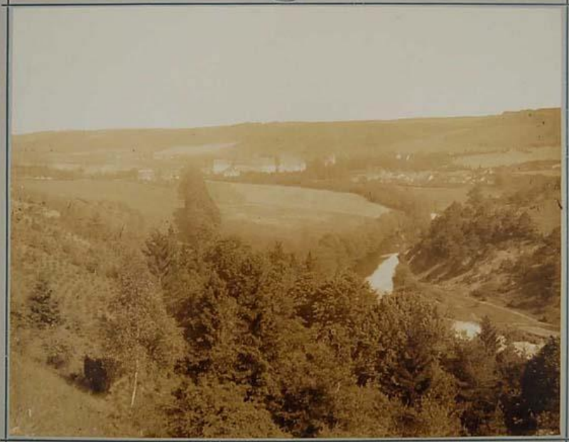
PLZER F. NOVÁK PILSEN

Hammer-Fotograf St. Dunstons des Fürsten Městemě-Winnburgu.