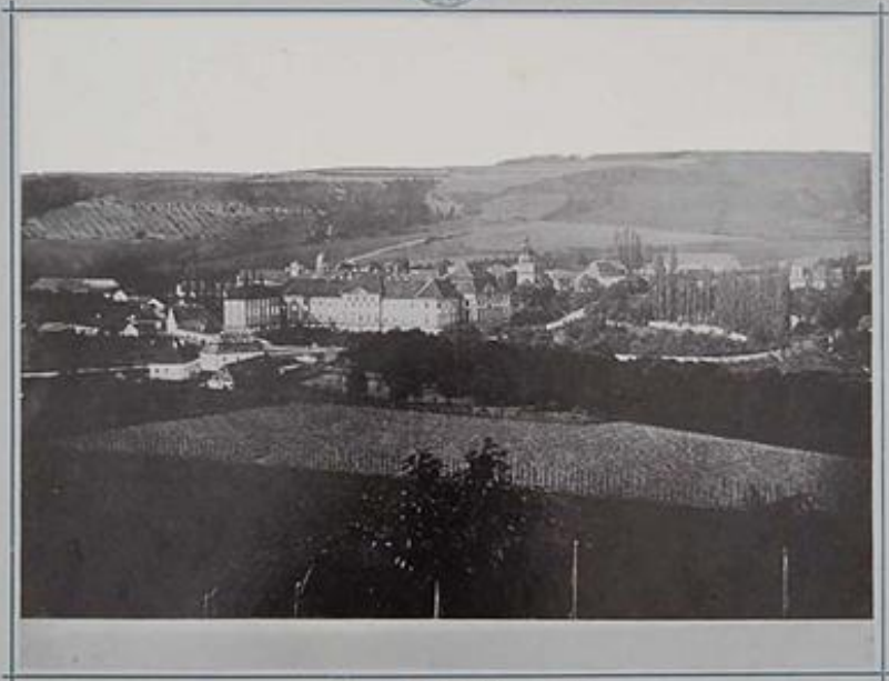
PLZER F. NOVÁK PILSEN

Hammer-Fotograf St. Dunstons des Fürsten Městemě-Winnburgu.