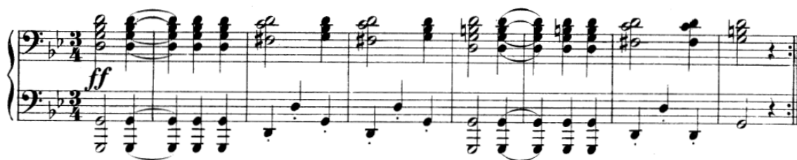
Obrázek 8 – začátek Slovanského tance č. 8 65