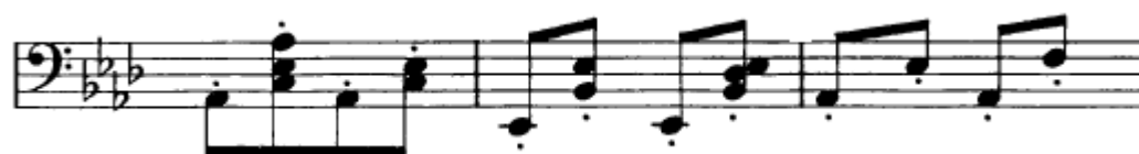
Obrázek 5 - doprovod bas a příznávka v Slovanském tanci č. 362