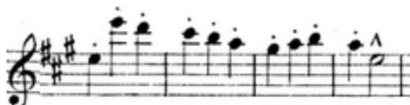
Obrázek 2 - téma středního dílu (B) Slovanského tance č. 1 59

Téma v druhé (B) části je k první části kontrastní. Především rytmus zde není tak ostrý jako v tématu prvním. Kontrast je také podpořen změnou tóniny – první téma je v C dur, druhé v A dur (Ukázka druhého tématu - viz obrázek 2).