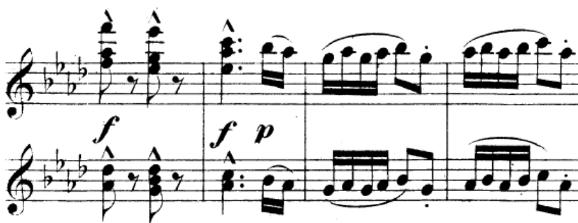
Obrázek 4 – polka (b) Slovanského tance č. 361