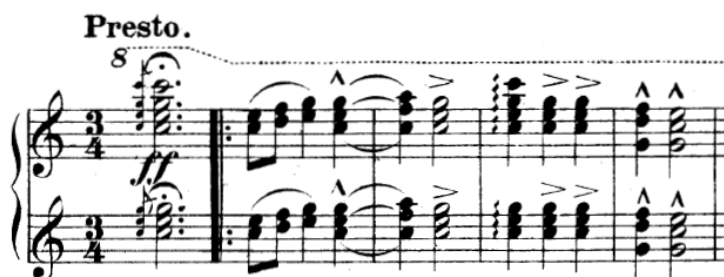
Obrázek 1 - 1. téma z úvodního dílu (A) Slovanského tance č. 1 58

Ve Slovanském tanci č. 1 nalezneme dvě kontrastní části. Tanec je napsán ve formě ABA. První část (A) je zahájena mohutným a znělým akordem, na který navazuje radostná, rychlá a energická hudba. Ta posluchače zaujme rázným rytmem. (Začátek prvního tance – viz obrázek č. 1)