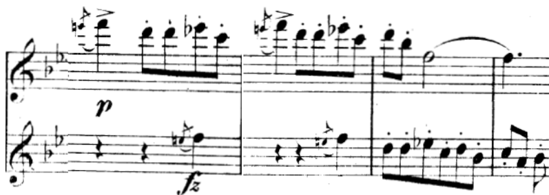
Obrázek 7 – Střední díl Slovanského tance č. 4 64