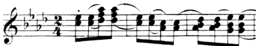
Obrázek 3 - první motiv (a) Slovanského tance č. 360

Dvořákova stylizace polky je zahájena houpavým prvním motivem (viz obrázek 3.), který celou skladbu uvádí (a). Tato první část je vystřídána rychlejší druhou částí (b). Kontrastní druhá část je od té první oddělena třemi různými akordy (viz obrázek 4), na které navazuje rozverná, vířivá a skotačivá melodie. V druhé části je lépe patrný polkový rytmus. V modelové lekci je tanec využit v úkolu zaměřeném na poznání lidového tance (viz kapitola 4.3.3). Proto je vhodné v souvislosti s tímto tancem objasnit žákům charakteristický polkový doprovod – bas a příznávka – viz obrázek 5.