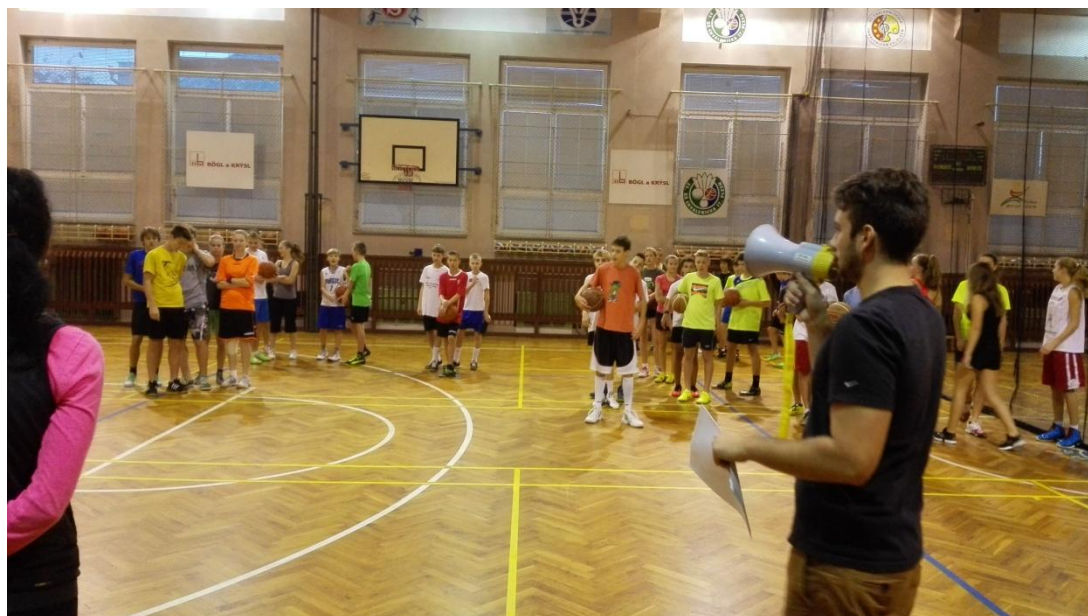
Obrázek 2 – Zahájení turnaje na 25. ZŠ v Plzni