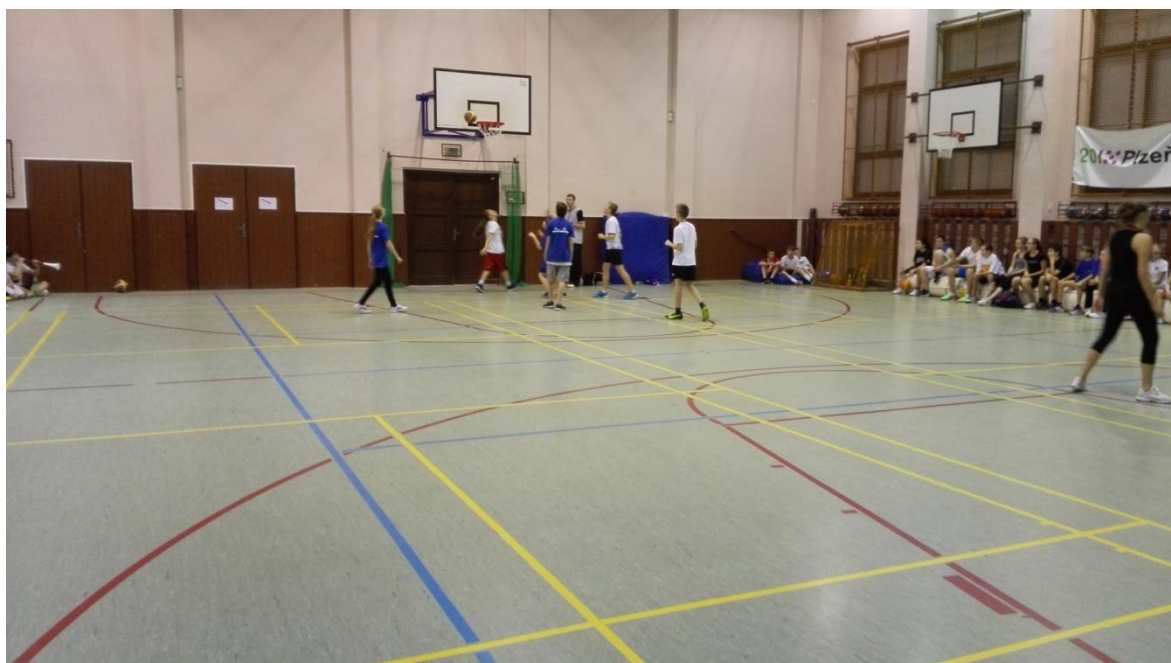
Obrázek 4 – Ukázka zápasu v kategorii 6. – 7. třída