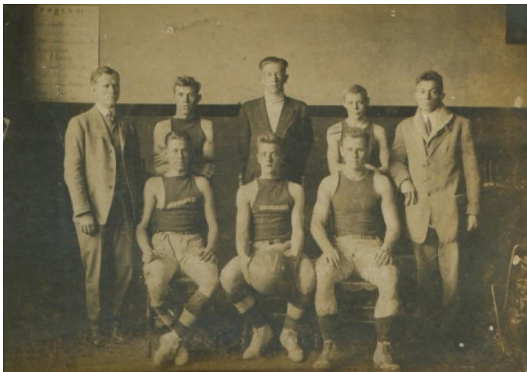
Obrázek 1 – První basketbalový tým v historii