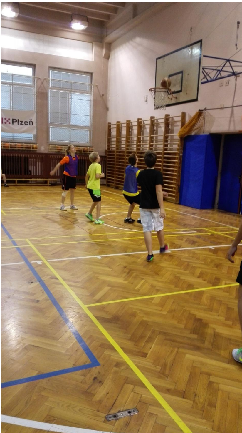
Obrázek 5 – Dostok