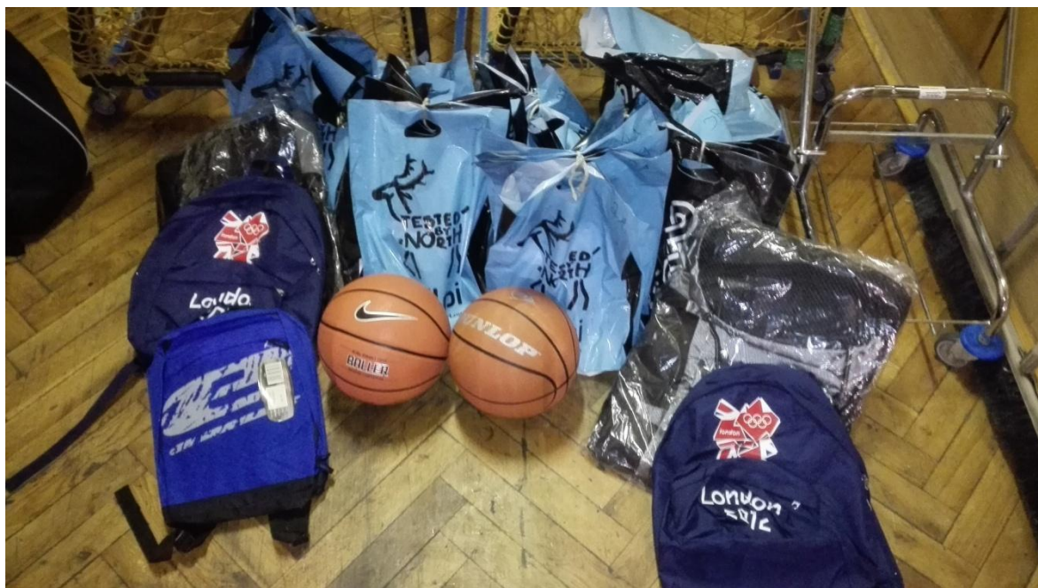
Obrázek 3 – Ceny pro vítězné týmy