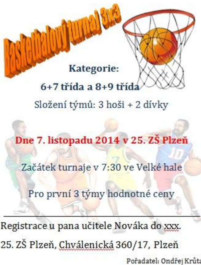
Obrázek 8 – Plakát