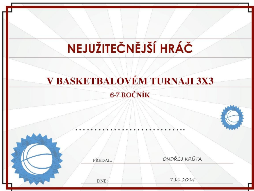
Obrázek 9 – Diplom