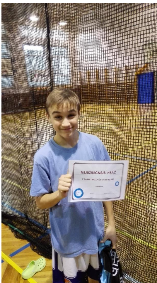
Obrázek 7 – Nejužitečnější hráč v kategorii 6. – 7. třída