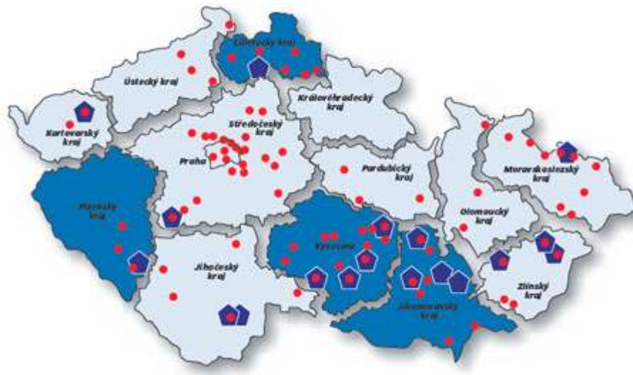
Mapa č. 1 : Přehled členů asociace Národní síť zdravých měst