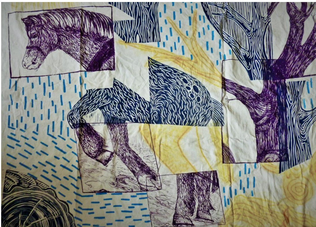
Příloha č. 3