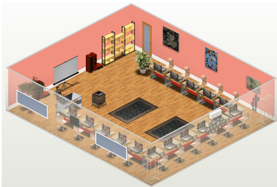
Obr. 1: Návrh ideální učebny v 3D modelu