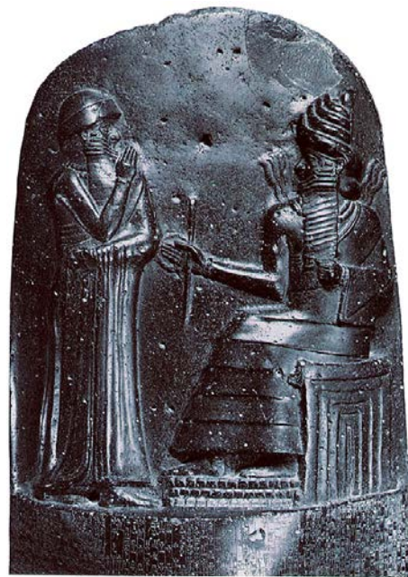
Obr. 1 – starobabylonský král Chammurapi modlí se k bohu slunce a spravedlnosti Šamašovi, jenž mu diktuje proslulý zákoník

Otázka uvedená v názvu tohoto příspěvku na první pohled nepůsobí příliš zajímavě a ani není patrné, jak by měla souviset s fyzikou. Pokud chci vědět, kdy vládl babylonský král a autor slavného zákoníku Chammurapi, stačí se podívat do učebnice dějepisu [1], nebo třeba na českou Wikipedii [2] a dovím se, že jeho vláda spadá do let 1792–1750 před naším letopočtem (př. n. l.). Tak jsem se to učil před lety ve škole a zdánlivě není důvod si myslet, že by to mělo být jinak. Pokud se však podívám třeba na anglickou Wikipedii [3] (zde musím ovšem hledat pod heslem Hammurabi), překvapivě zjistím, že jsou u doby vlády tohoto krále uvedeny údaje dva – vedle již zmíněného 1792–1750 př. n. l. ještě 1728–1686 př. n. l. Někdo by mohl toto překvapivé zjištění přisoudit nespolehlivosti Wikipedie jako informačního zdroje a dále se jím nezábývat. Ukazuje se však, že uvedení více možností zcela odpovídá současnému stavu výzkumu v této oblasti a je (s patřičným komentářem) dokonce mnohem korektnější, než uvádění jediného časového rozpětí, které by mělo být bráno jako nezpochybnitelný fakt. Proč tomu tak vlastně je a jak to celé souvisí s fyzikou?