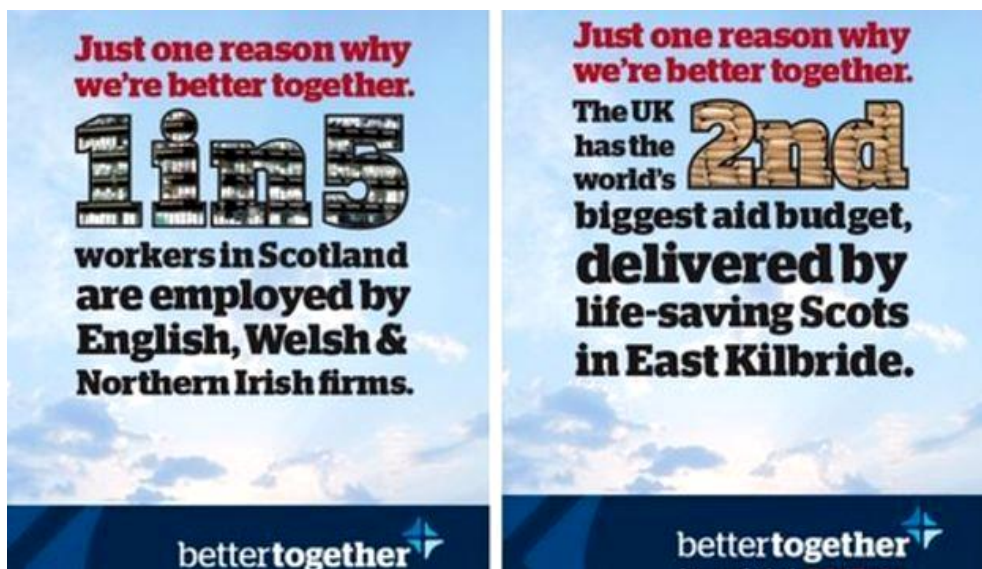
Obrázek 2 – Plakát Better together

( http://www.thestar.com/content/dam/thestar/uploads/2014/9/17/1410969750226.png , 19.3. 2016).