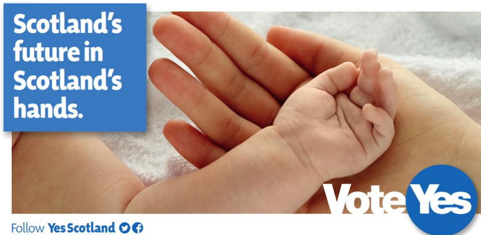
Obrázek 1 – Plakát Yes Scotland