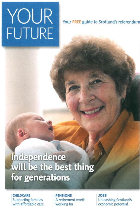
Obrázek 8 – Brožura Yes Scotland

Zdroj: YES Scotland (2014). YOUR FUTURE, YOUR FREE guide to Scotland (Glasgow: YES Scotland), s.1.