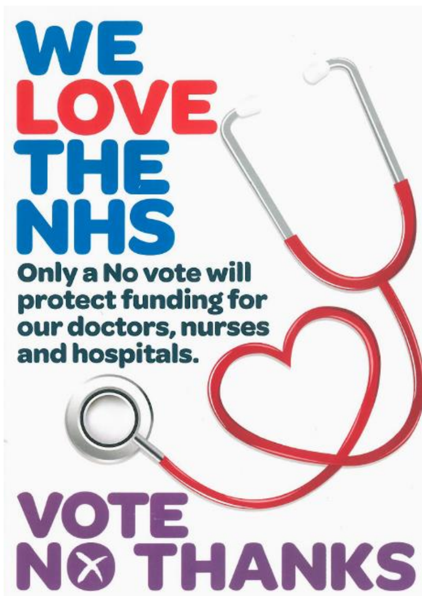
Obrázek 10 – Leták Yes Scotland