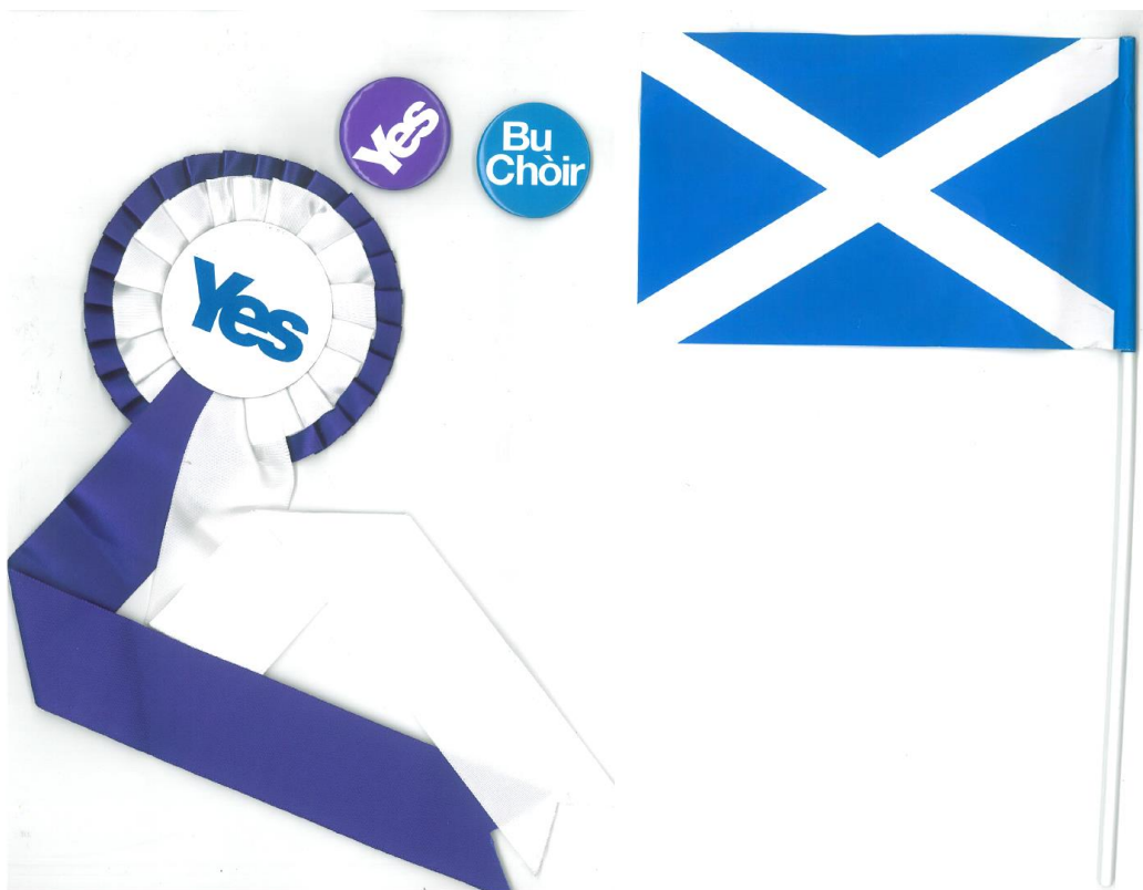
Obrázek 17 – Propagační materiály z kampaně Yes Scotland