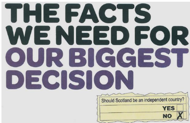
Obrázek 7 – Brožura Better together

Zdroj: Better Together (2014). THE FACTS WE NEED FOR OUR BIGGEST DECISION (Glasgow: Better Together), s.1.