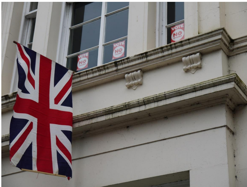
Obrázek 13 – Vyjádření podpory pro zachování unie