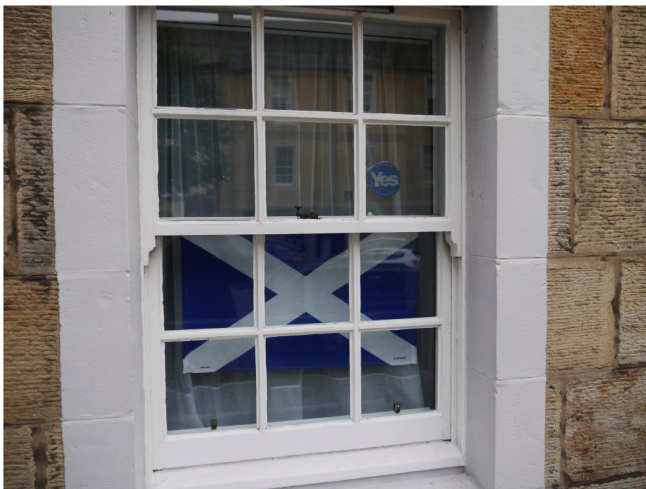
Obrázek 14 – Vyjádření podpory pro nezávislost