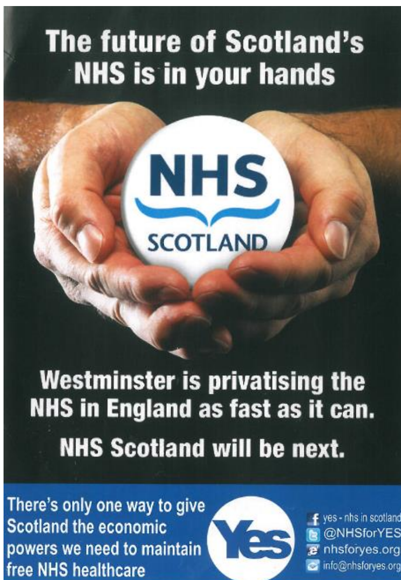
Obrázek 9 – Leták Better together