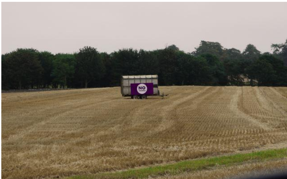
Obrázek 3 – "No Thanks" na poli