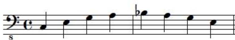
Obrázek č. 1 – ukázka R&R basové figury

Pro R&R hudbu jsou také typickým znakem basové figury. Pro výuku R&R je nejvhodnější využít nejtýpčtější z nich (obr. č. 1).