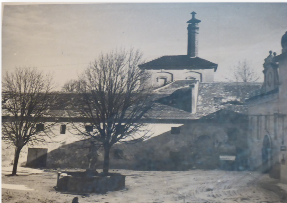
Příloha č. 8: Budova bývalého panského pivovaru – sladovna, dnes veřejná knihovna. 343