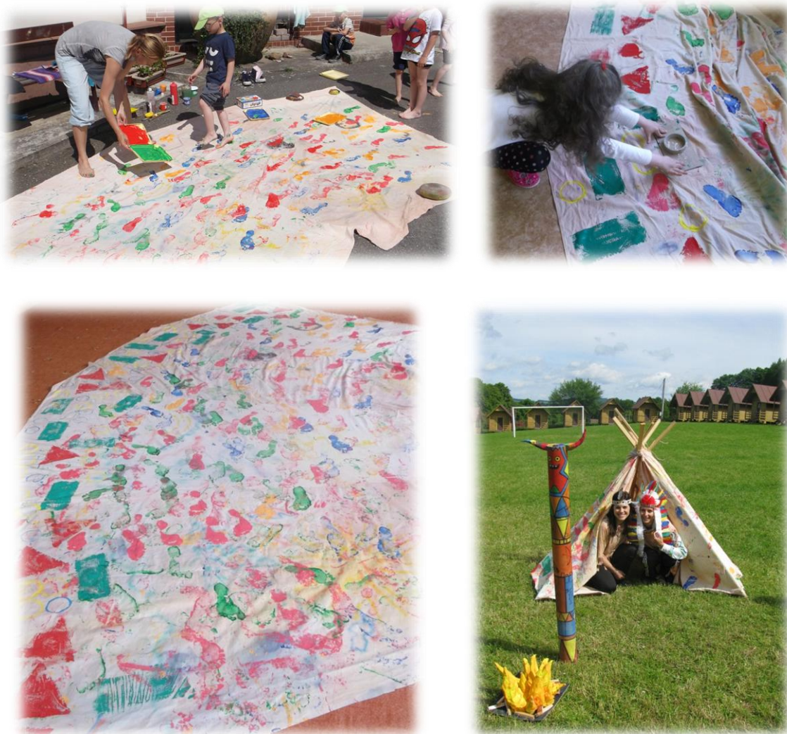
Obr. 38 až 41