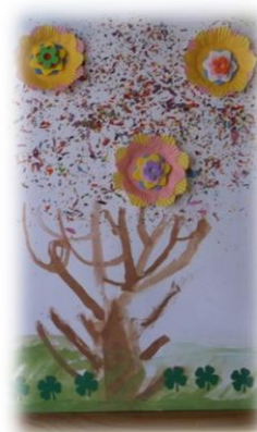
Obr. 78 až 82