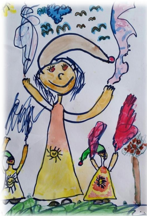
Obr. 5 - Navozená činnost dítěte

Bylo snadné si představit svého skřítku? Máš již pro svého skřítku jméno? A jaké vlastnosti má tvůj skřítek? Na obrázku je vidět více skřítků, to jsou kamarádi?