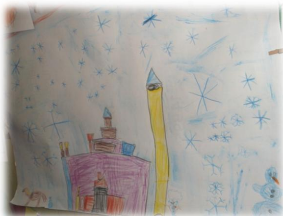
Obr. 17 až 20

Výlet: Zakořením našeho ledového „šílenství“ byla návštěva zimního stadionu s možností bruslení – ledová plocha.