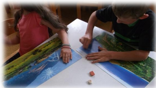
Obr. 61 až 62

Výtvarné činnosti na námět „Malování iluze“.