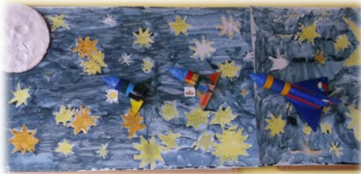
Obr. 76 až 77