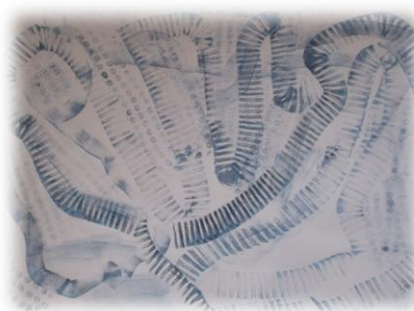
Obr. 13 až 14