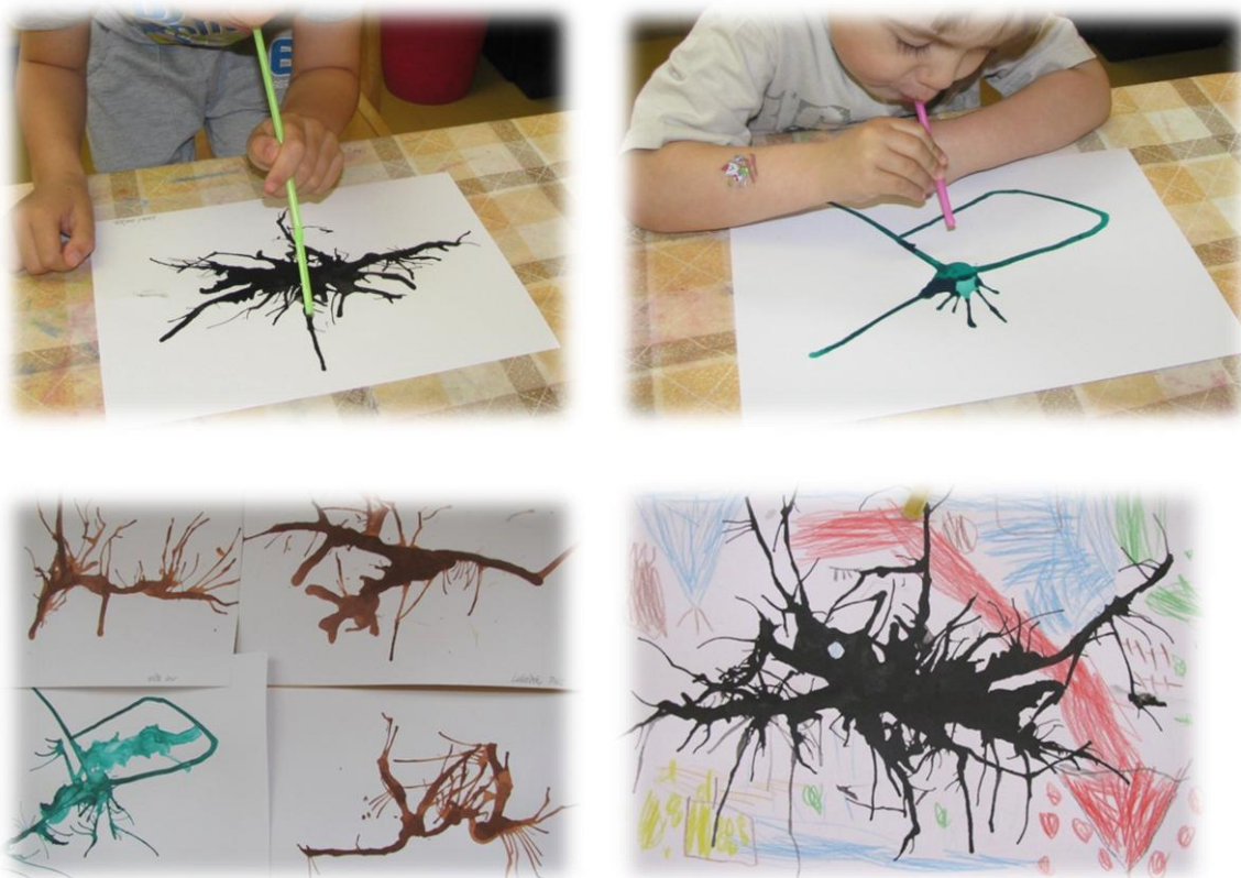
Obr. 32 až 35

Co bylo nejsnadnější na přípravě indiánské mapy? A co naopak bylo těžší? Líbila se vám cesta za pokladem?