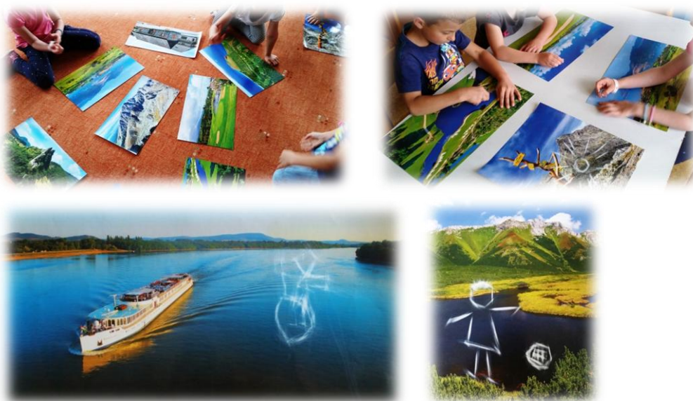
Obr. 43 až 46

Proč jste si vybraly právě tyto obrázky? Co byste si nejrady chtěly vzít s sebou ještě na dovolenou? Byla pro vás snadná nebo těžká tato výtvarná technika – gumáž? Na která místa byste se rády ještě podívaly?