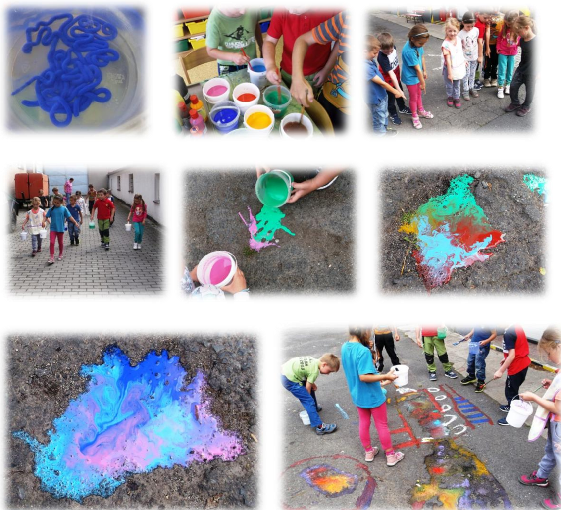
Obr. 23 až 30