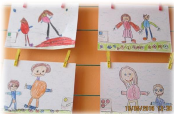
Obr. 66 až 67