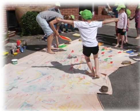
Obr. 36 až 37