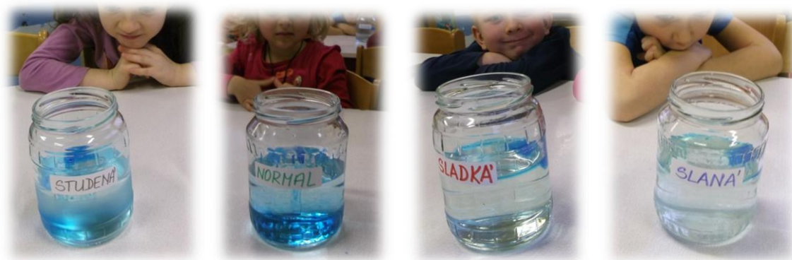
Obr. 8 až 11