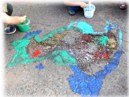
Obr. 55 až 56