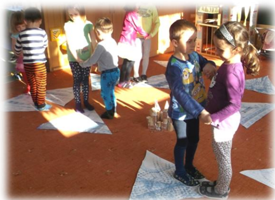
Obr. 51 až 52