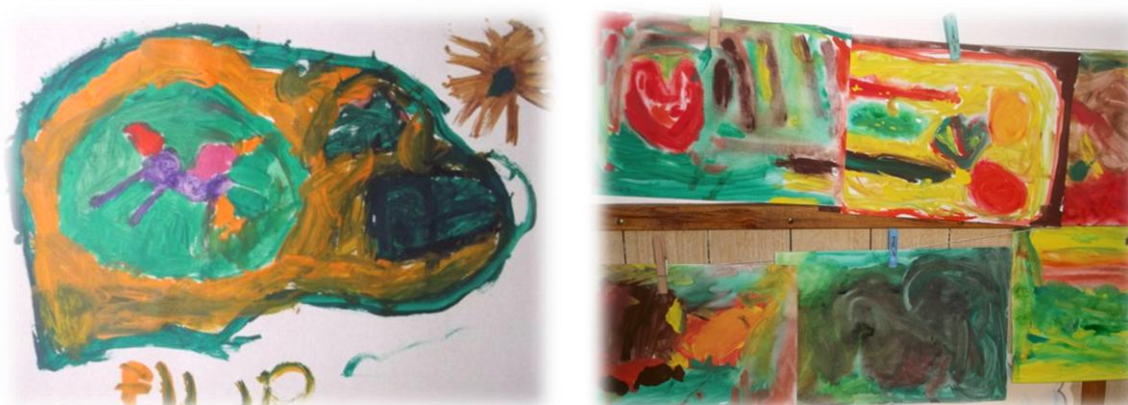
Obr. 74 až 75