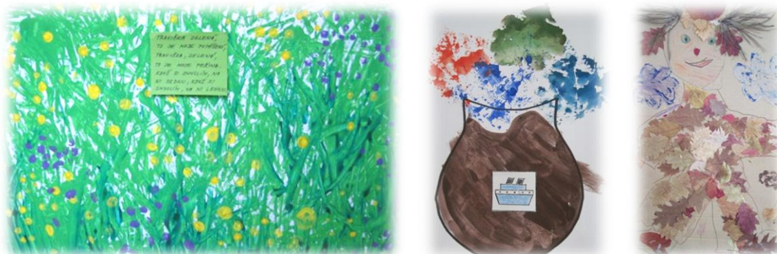
Obr. 71 až 73