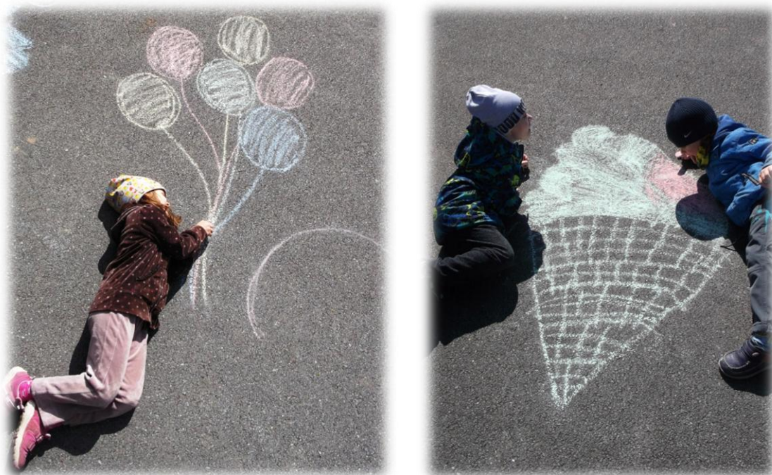
Obr. 47 až 48

Co vás vedlo k tomu začít malovat? Líbilo se vám hledat nějakou iluzi k danému obrázku? Napadá vás ještě nějaké jiné téma, jiný obrázek, který byste mohly namalovat a spojit ho se svou představou?