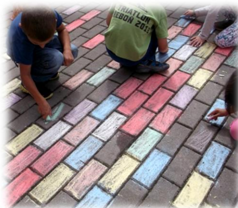
Obr. 63 až 65

Obrazová příloha dle strukturovaného rozhovoru.