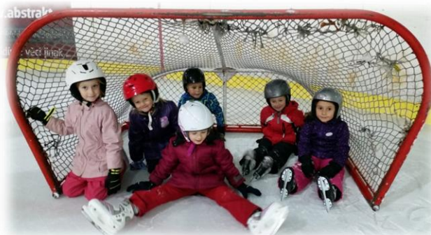
Obr. 21 až 22