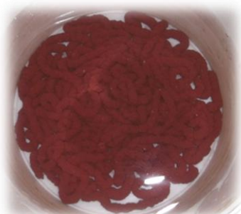
Obr. 53 až 54