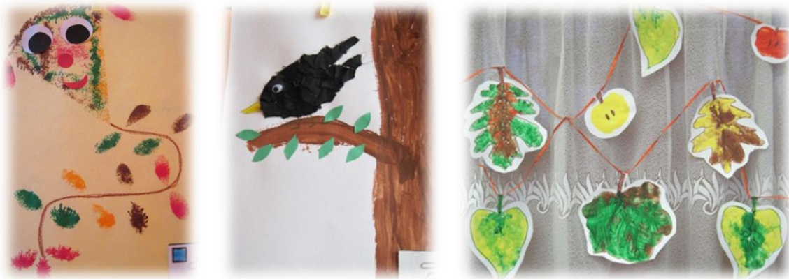
Obr. 68 až 70