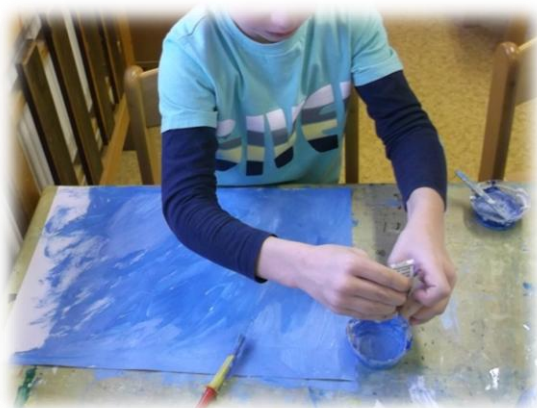
Obr. 49 až 50