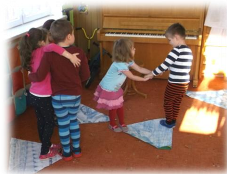
Obr. 15 až 16