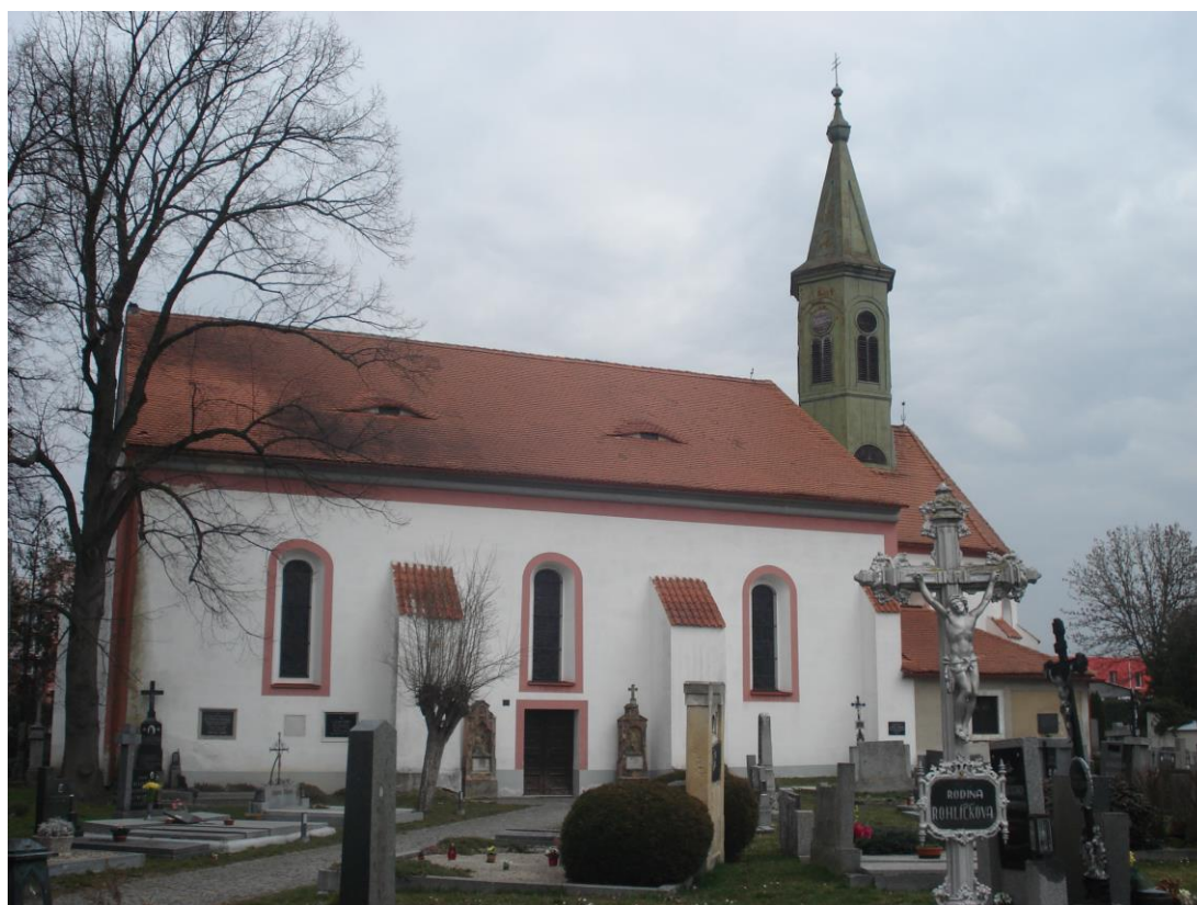
Příloha 12 – Hřbitovní kostel sv. Jana Křtitele