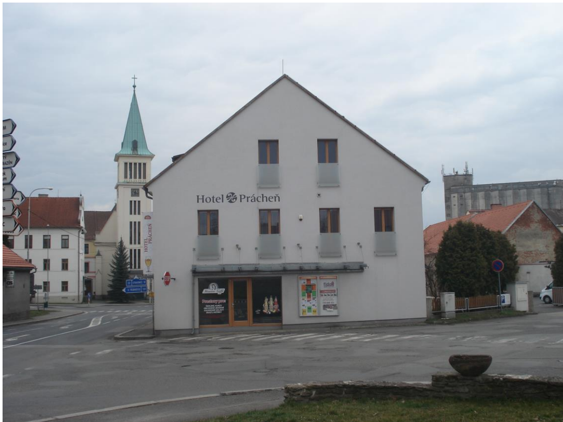
Příloha 5 – Hotel Prácheň (dříve U Modré hvězdy)