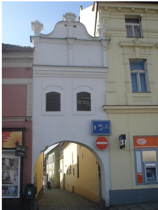
Příloha 8 – Prachatická brána