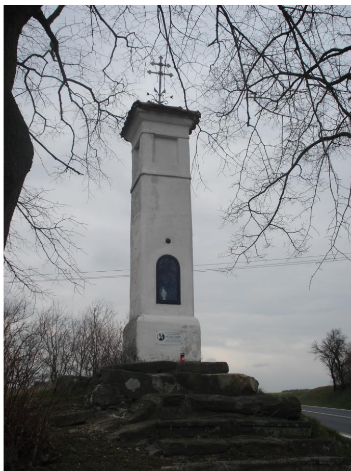
Příloha 16 – Boží muka u Lorety