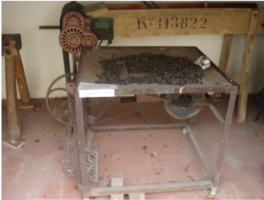
Příloha 21 – Šlapací polní kovářský výheň – datace 13. – 14./15. století