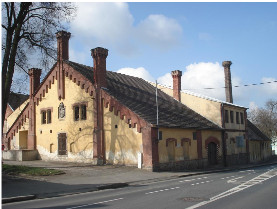
Příloha 4 – Pivovar z roku 1869, vybudovaný Ferdinandem Kinským jako zámecký pivovar na místě bývalého hradebního příkopu, předcházela mu pivovar panský, založený v roce 1570 za Václava Švihovského z Rýzmburka, z této doby se zachovala pouze vstupní brána na zámeckém nádvoří