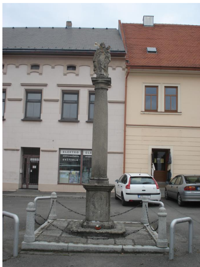
Příloha 14 – Morový sloup na Josefském náměstí