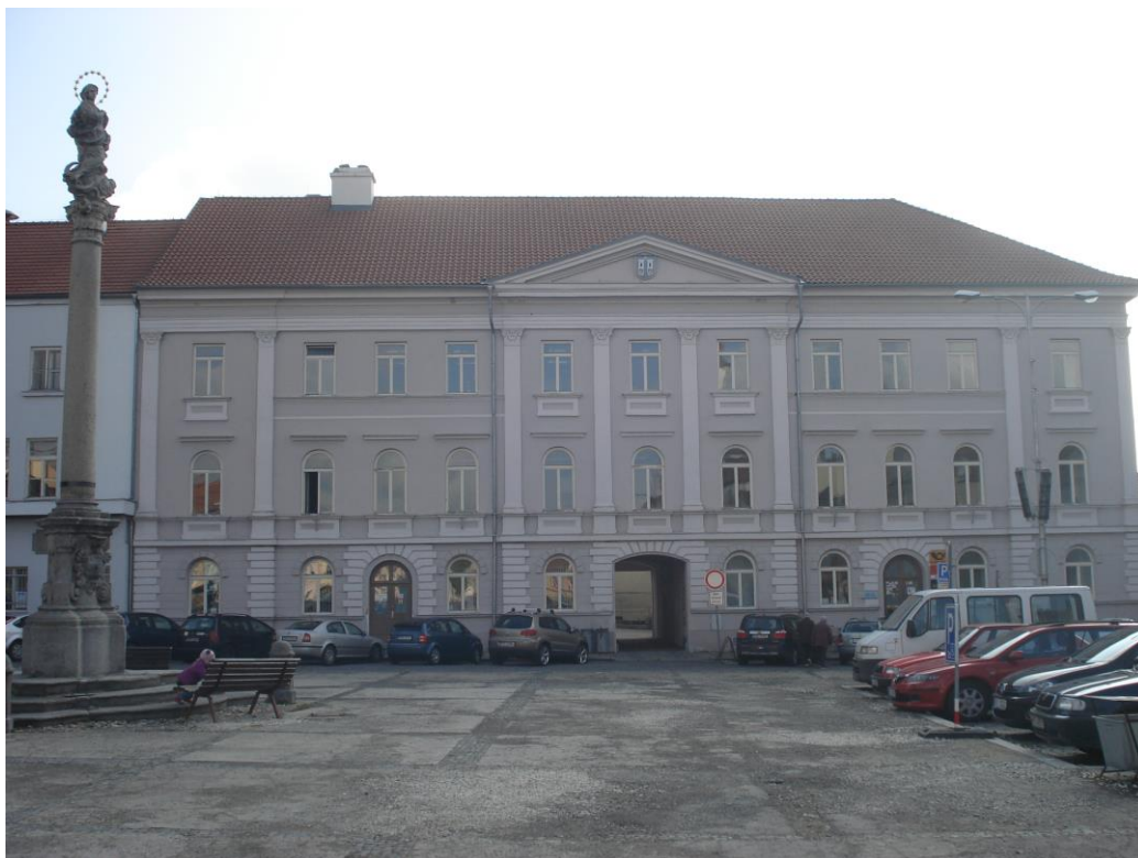
Příloha 15 – Radnice