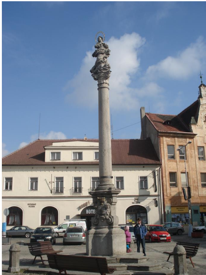
Příloha 13 – Morový sloup Neposkvrněného početí Panny Marie, v roce 1994 zrestaurovaný