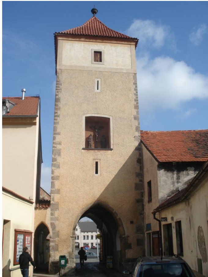
Příloha 7 – Hlavní brána (Červená, Pražská)