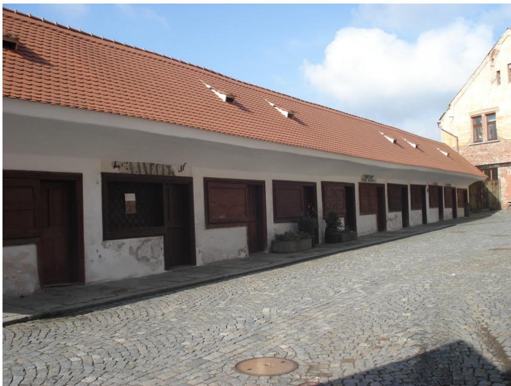
Příloha 6 – Masné krámy – ojediněle zachovalé řeznické krámký se společnou porážkou stály v těchto místech již koncem 16. století. Počet masných krámků nepřesáhl po celou její historii číslo dvacet, nynější podoba je z počátku 19. století