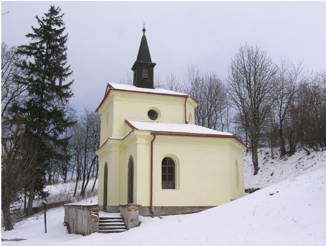
Příloha 17 – Kaple sv. Jáchyma a sv. Anny u Horažďovic