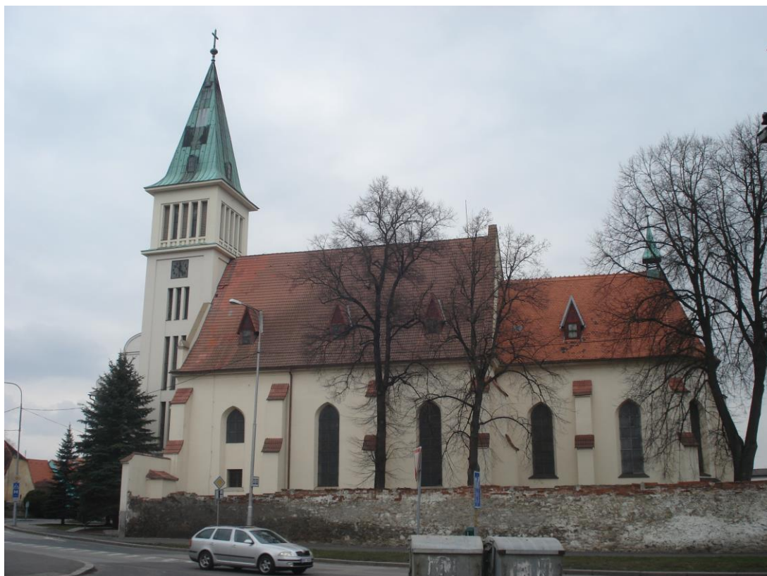
Příloha 11 – Klášterní kostel Nanebevzetí Panny Marie