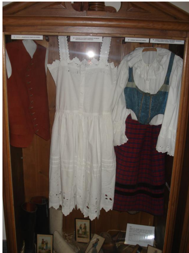
Příloha 22 – Pánská hřebíčková vesta ze sukna, dámské svatební kombiné zdobené prostřihávanou výšivkou, dámská krojová košile, dámská šněrovačka z modrého brokátu s vytkávaným vzorem tkaniny