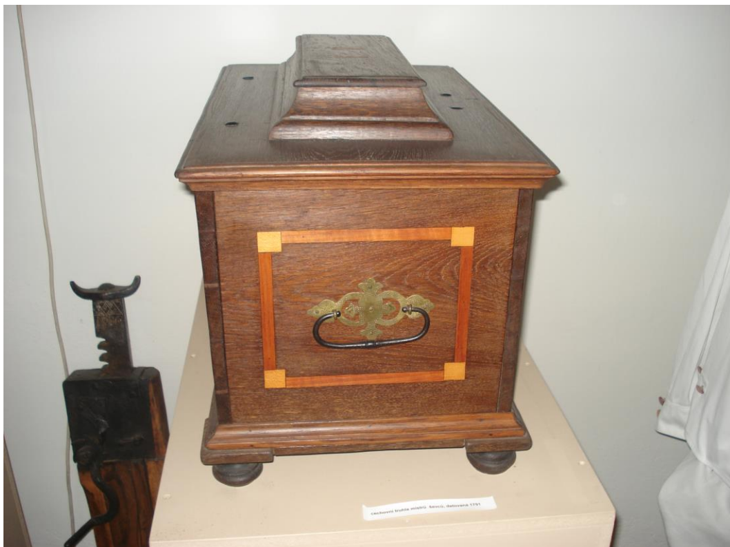
Příloha 18 – Cechovní truhla mistrů ševců z roku 1791