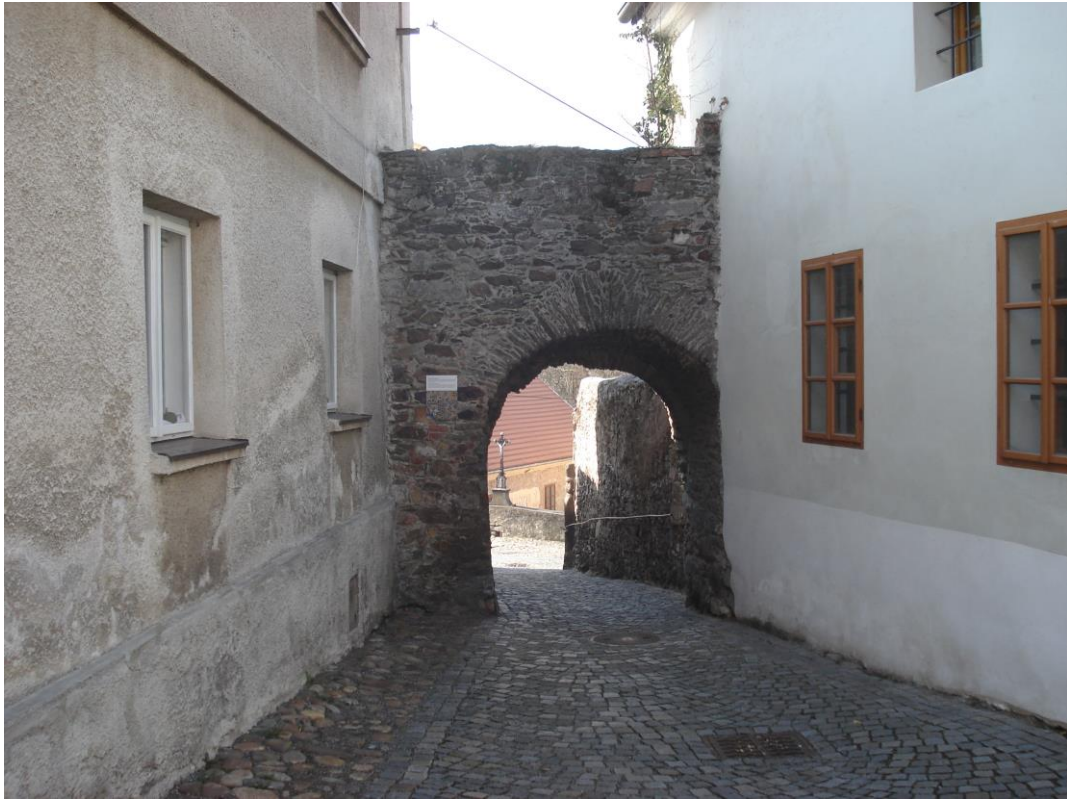
Příloha 9 – Branka zvaná Kocour