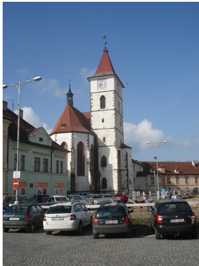
Příloha 10 – Kostel sv. Petra a Pavla