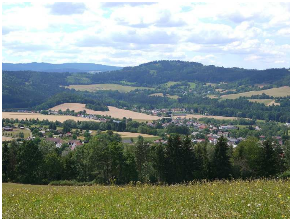
Obrázek 11 – Pohled na Dlouhou Ves a okolní krajinu