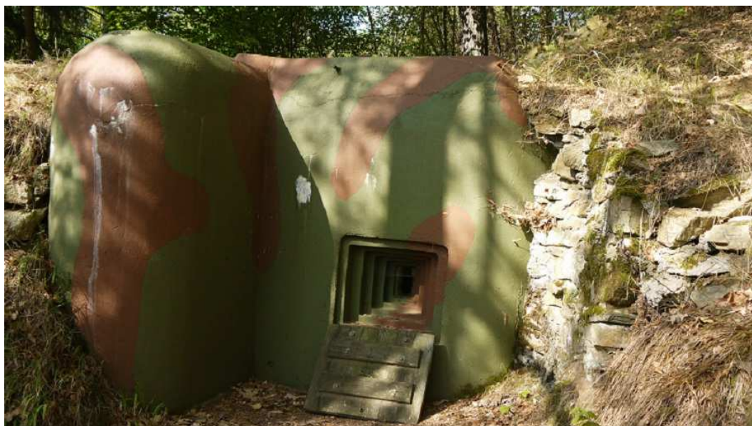
Obrázek 8 – Bunkr „řopík“ - zbytky československého lehkého opevnění