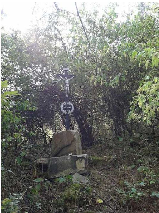
Obrázek 17 – Křížek opravený panem Přemkem