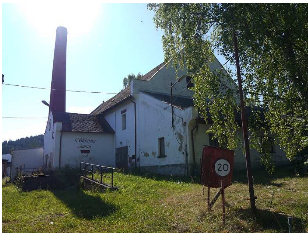
Obrázek 5 – Sklárna v Anníně