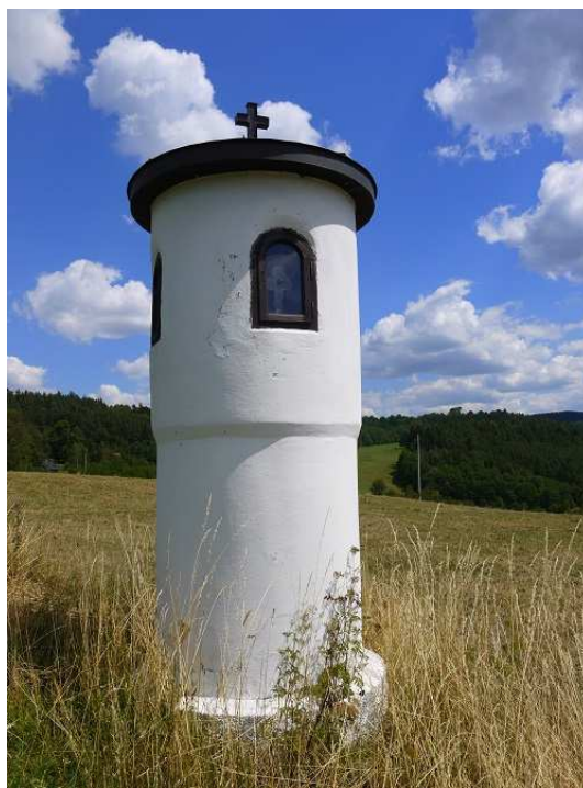
Obrázek 7 – Kulatá Boží muka