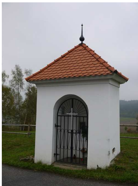
Obrázek 18 – Kaplička na kraji Bohdašic