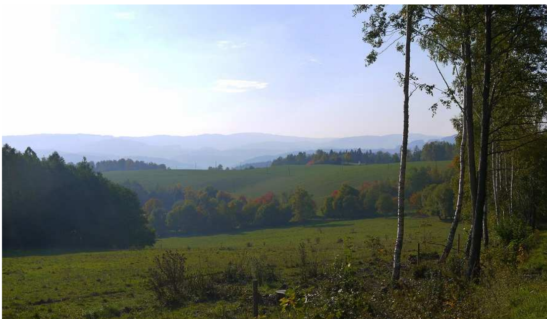
Obrázek 14 – Pohled do krajiny od Platoře