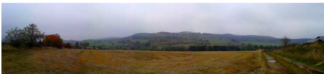
Obrázek 16 – Krajina v okolí Dlouhé Vsi