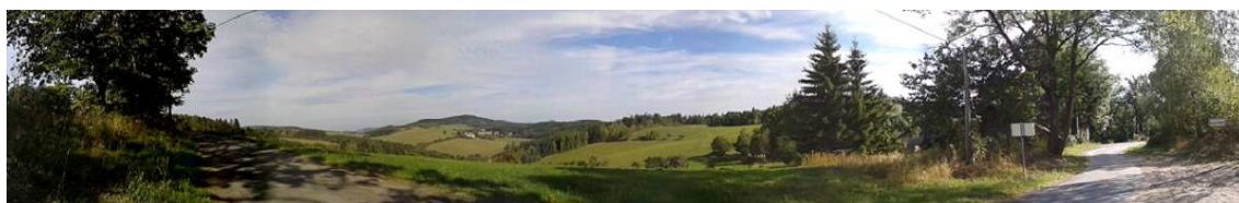
Obrázek 15 – Krajina v okolí Palvínova