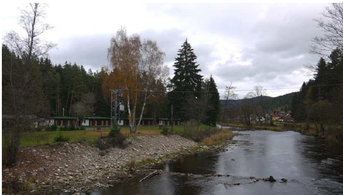
Obrázek 10 – Kemp v Anníně