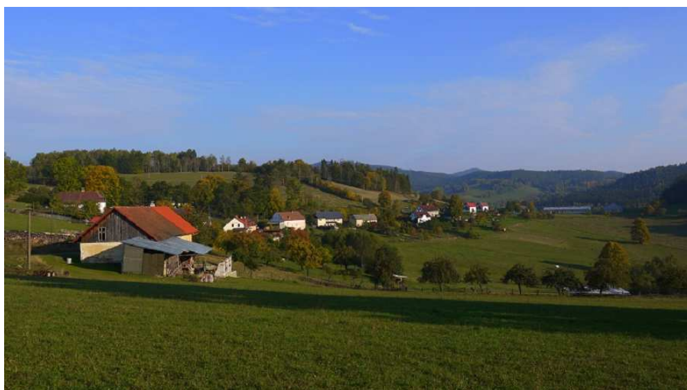
Obrázek 12 – Pohled na Bohdašice a okolní krajinu