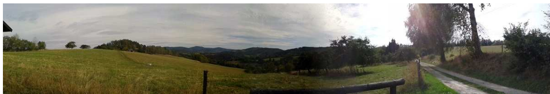
Obrázek 13 – Krajina v okolí Vatětice