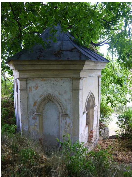
Obrázek 6 – Kaple v Bohdašicích