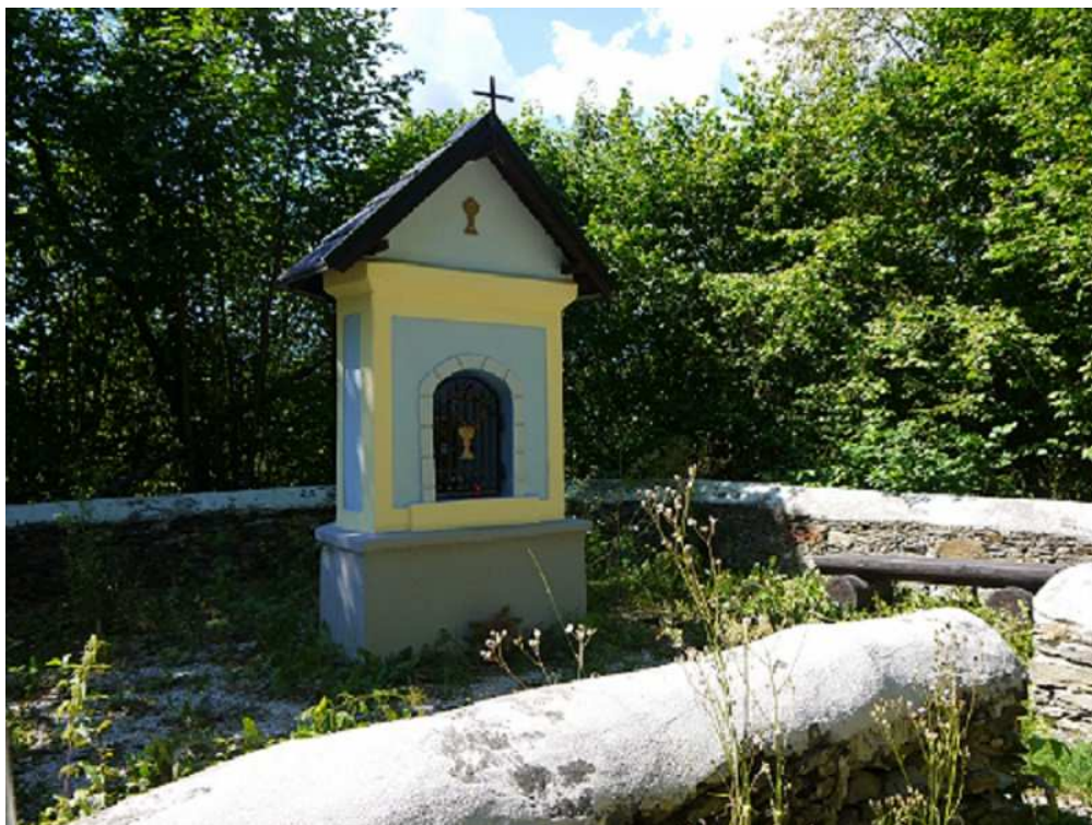
Obrázek 4 – Hrob švédských bojovníků z třicetileté války - „Švédské hroby“