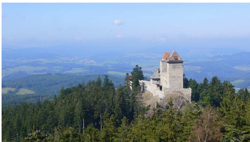
Obrázek 19 – Pohled na hrad Kašperk a okolní krajinu z Pustého hrádku