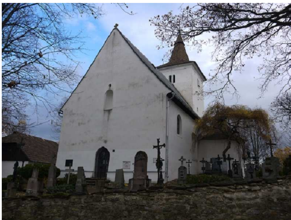
Obrázek 3 – Kostel sv. Mořice