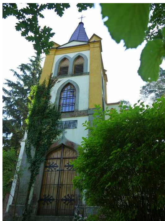
Obrázek 2 – Hrobka sklářů v Anníně