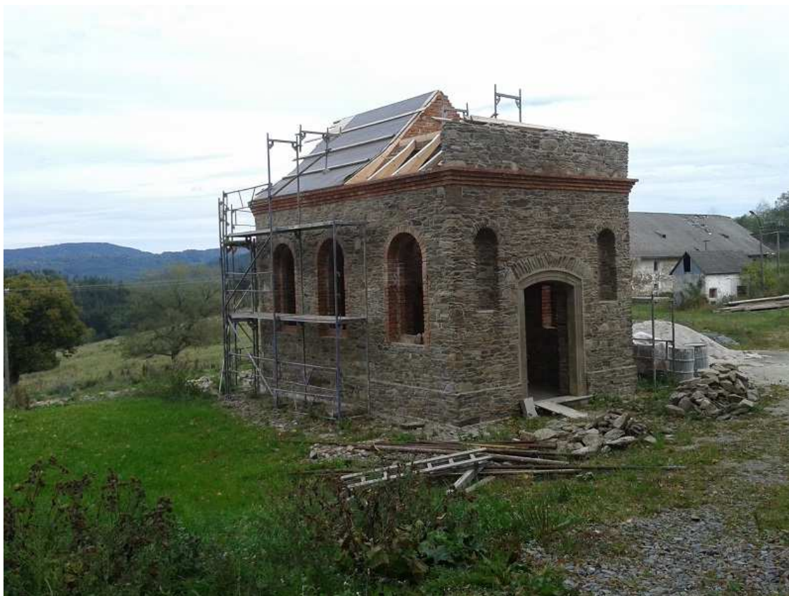
Obrázek 9 – Výstavba kaple ve Vatěticích