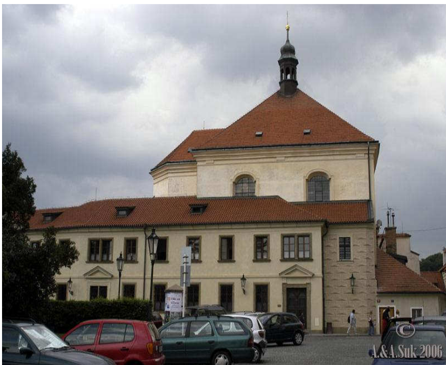
Obr. č. 9: Klášter bosých karmelitek v Praze na Hradčanech