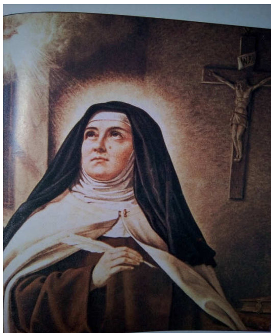
Obr. č. 7: Bosá karmelitka