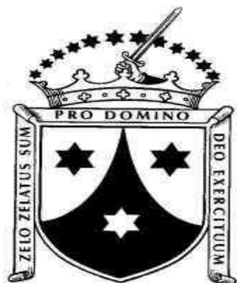
Obr. č. 3: Znak obutých karmelitánů