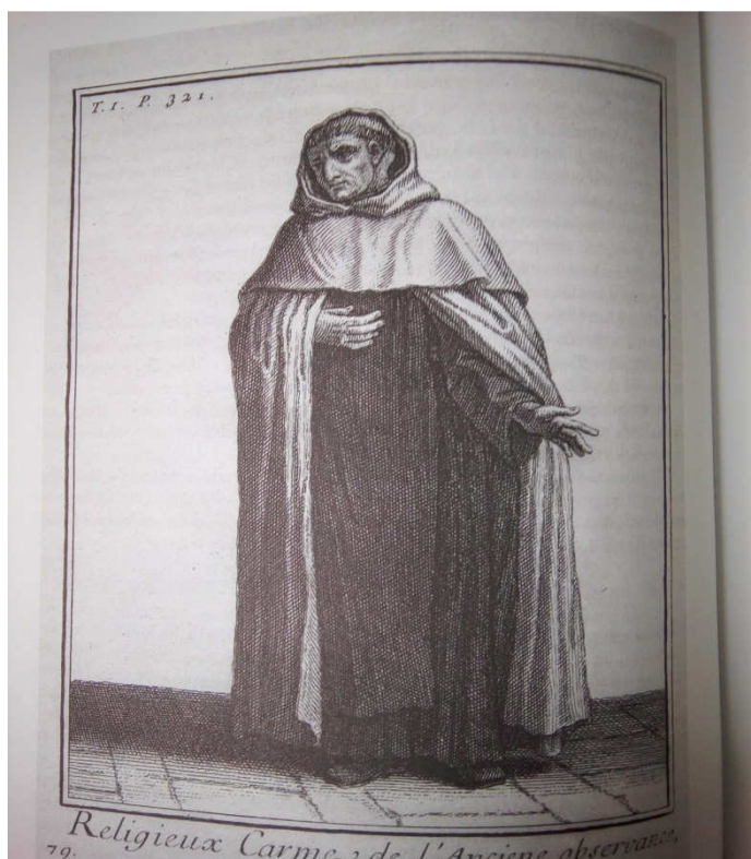
Obr. č. 5: Obutý karmelitán