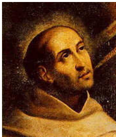
Obr. č. 2: sv. Jan od Kříže