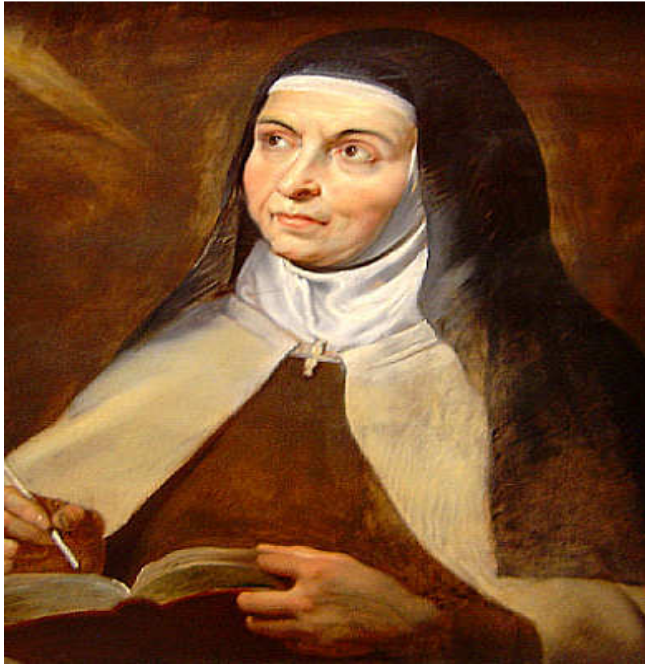
Obr. č. 1: sv. Terezie z Avily