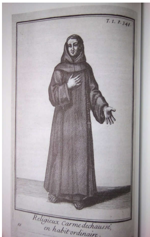
Obr. č. 6: Bosý karmelitán

(Zdroj: Buben, M. M., Encyklopedie řádů a kongregací v českých zemích, III. díl, 2. svazek, Žebravé řády , LIBRI, Praha, 2007, s. 198)