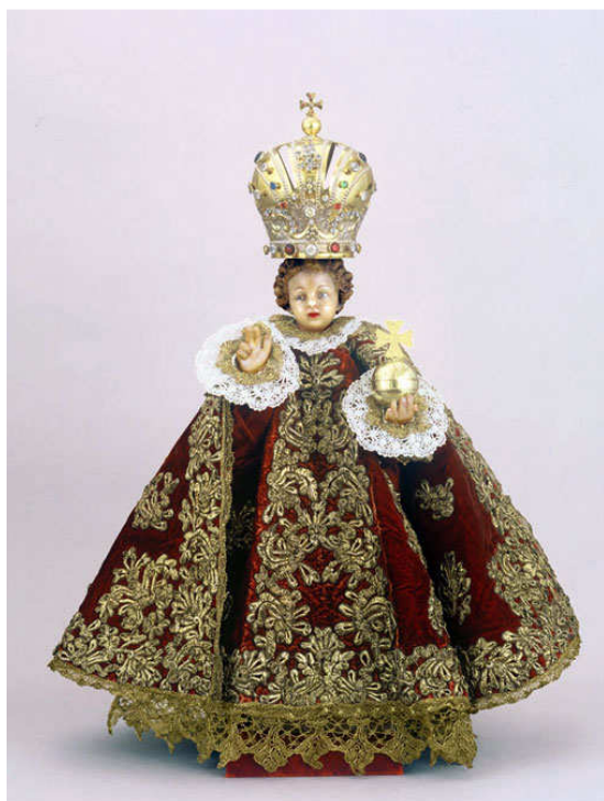
Obr. č. 10: Pražské Jezulátko