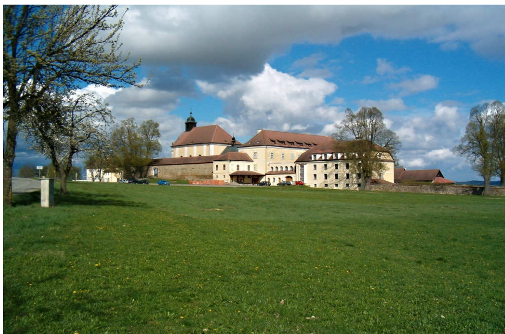
Obr. č. 11: Klášter karmelitánů v Kostelním Vydří