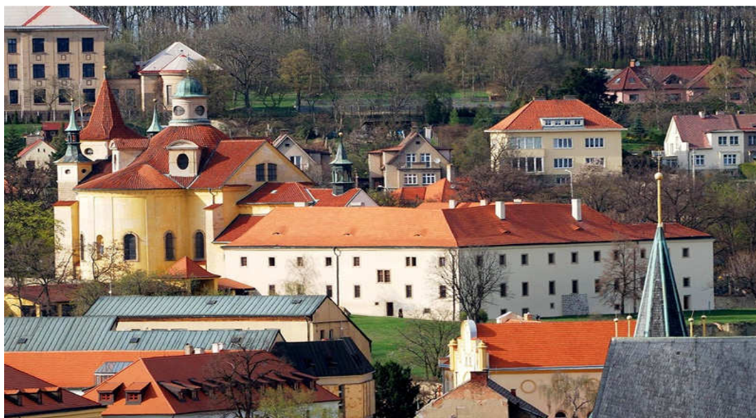
Obr. č. 12: Klášter bosých karmelitánů ve Slaném