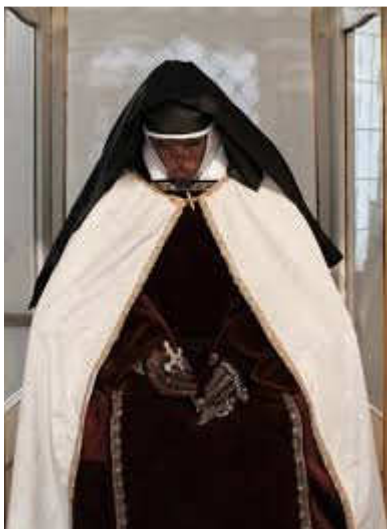
Obr. č. 8: Tělo Marie Elekty - v současnosti v kostele sv. Benedikta

(Zdroj: https://www.google.cz/search?q=marie+elekta&biw.jpg .)