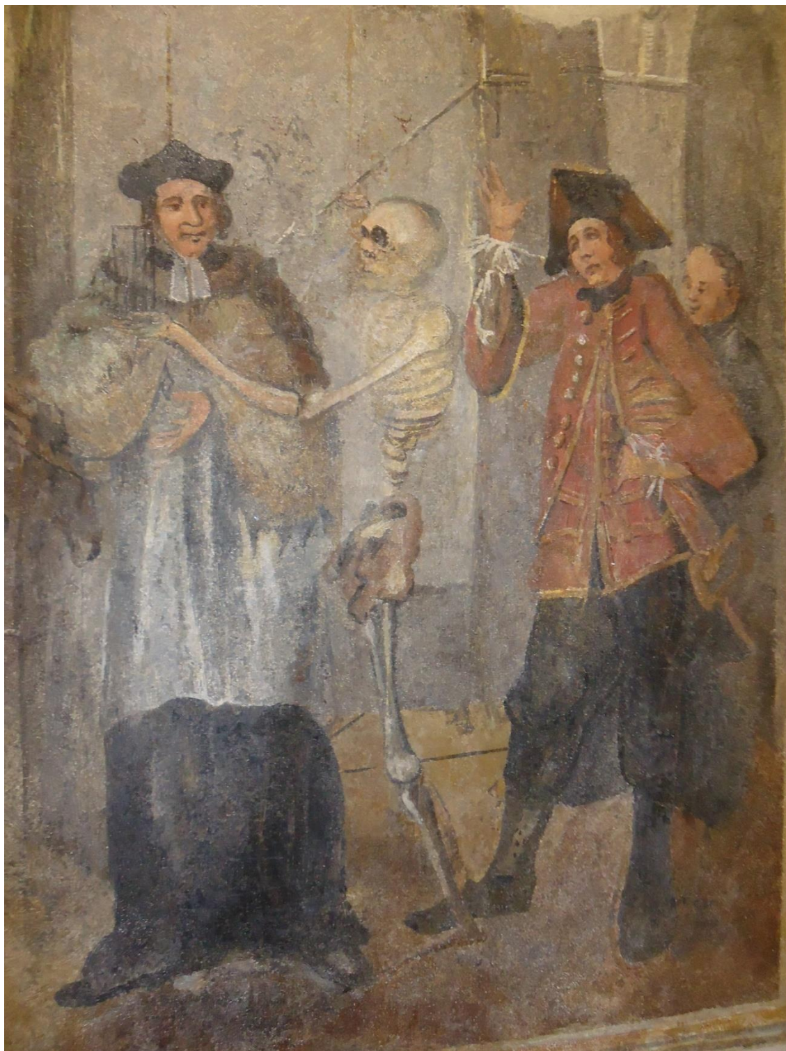
obr. č. 1. Tanec smrti