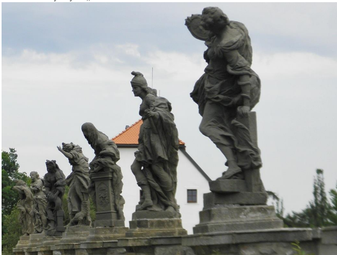
obr. č. 11. Sochy z cyklu „Ctností“