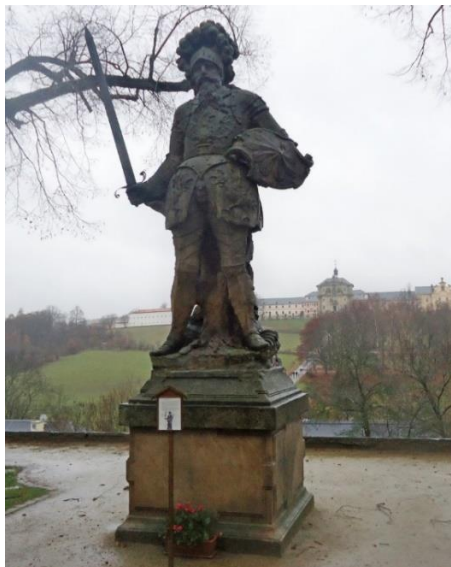
obr. č. 4. Socha Herkomanna