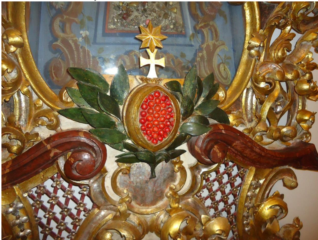
obr. č. 13. Znak řádu milosrdných bratří