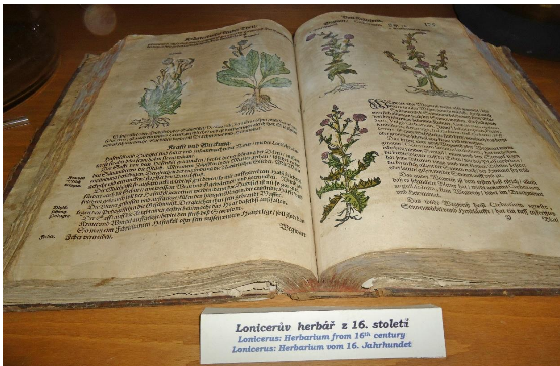
obr. č. 12. Herbář Adama Loniceru