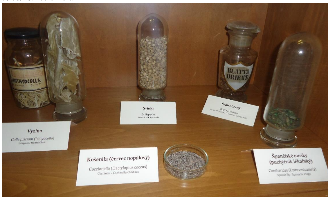
obr. č. 18. Zoofarmaka