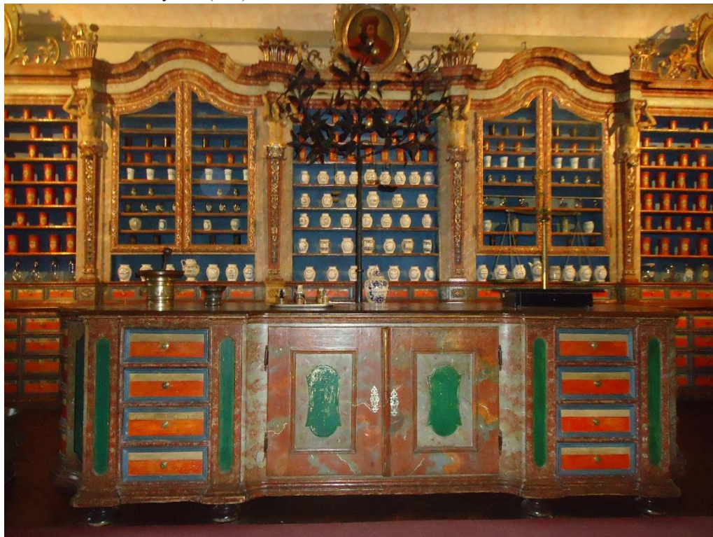
obr. č. 14. Lékárenský stůl (tára)