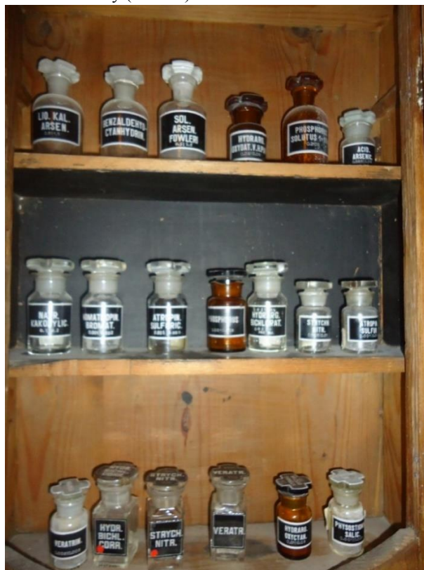
obr. č. 21. Jedy (venena)