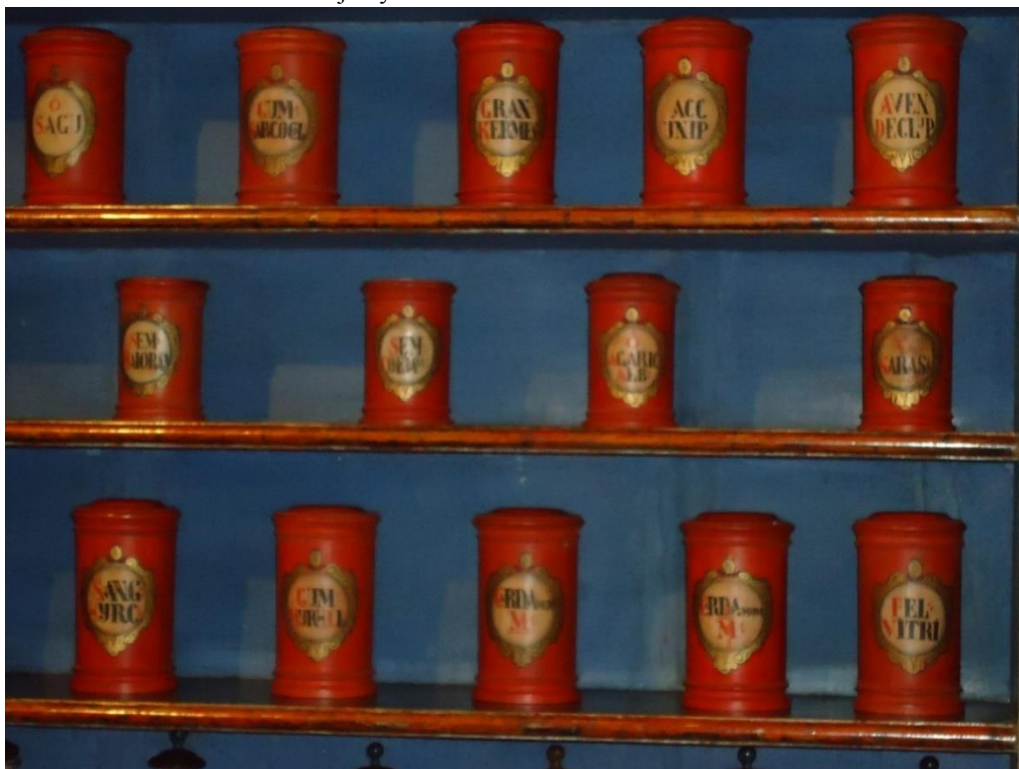
obr. č. 16. Červené dřevěné stojatky