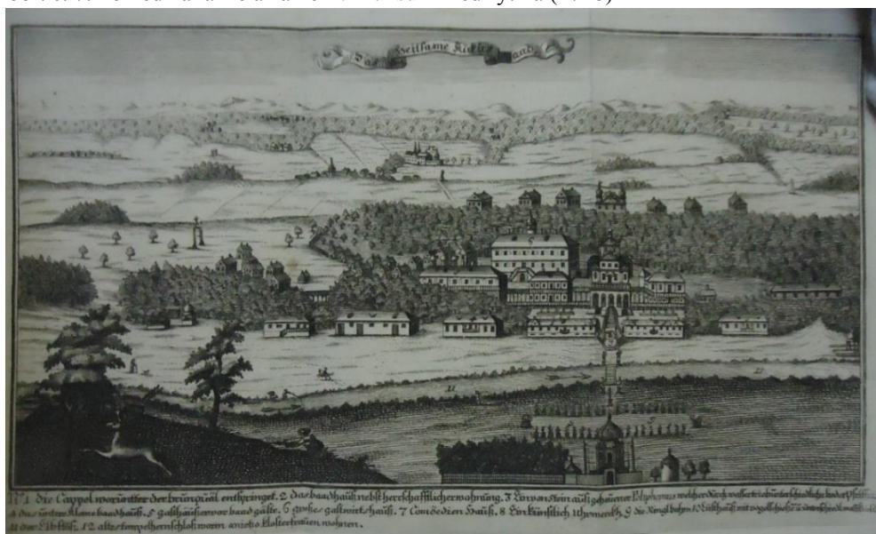
Zdroj: KIRCHMAYER, Karl Valentin. Uralter Kucus – Brunn: Anjetzo erneuerte Gradlitzer Brunn – Quelle, Dessen Ursprung, Belegenheit, Alterthum, heylsame Mineralien, Würckung, Nutzbarkeit, und rechter Gebrauch : in möglichster Kürtze beschrieben . Praha: Wolfgang Wirckhart, 1718.