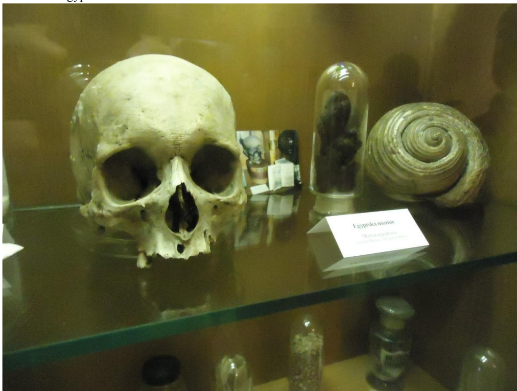
obr. č. 20. Egyptská mumie