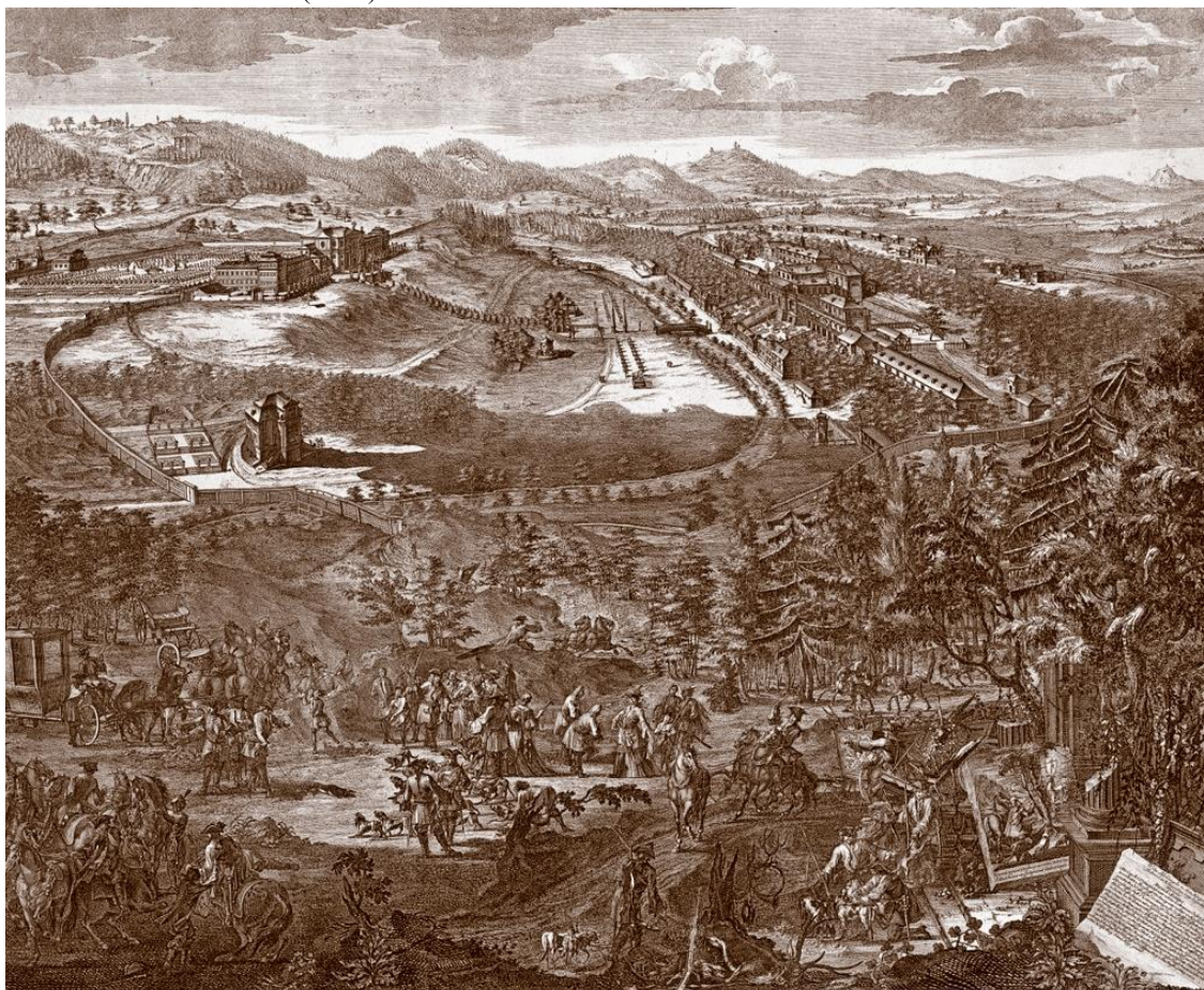
obr. č. 3. Pohled na Kuks (1724)