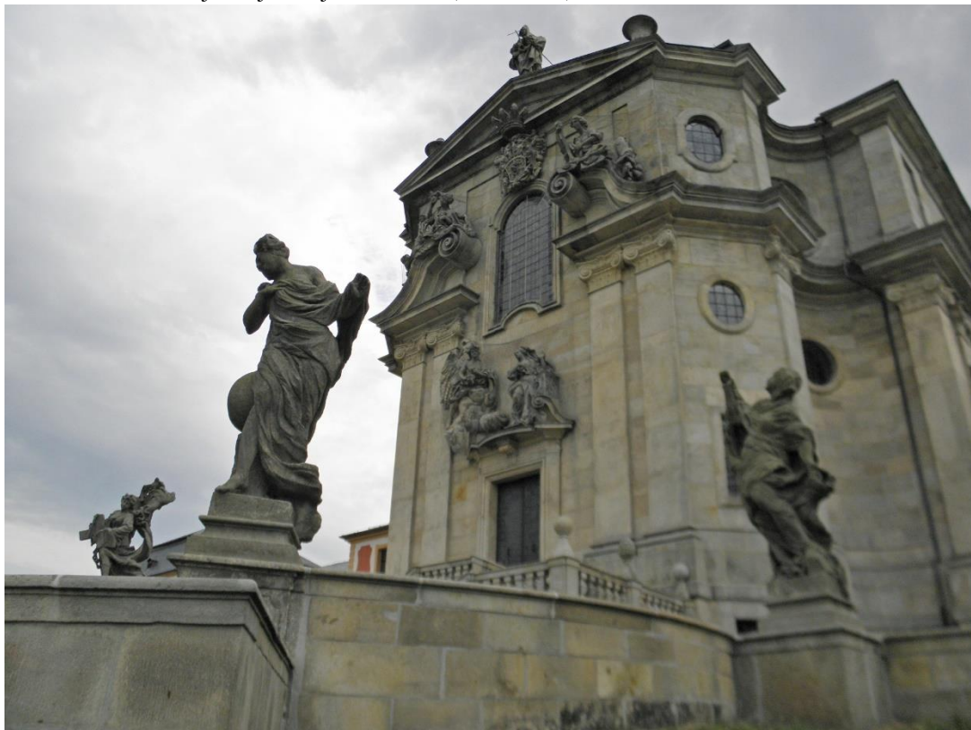
obr. č. 10. Kostel Nejsvětější Trojice v Kuksu (1707–1717)