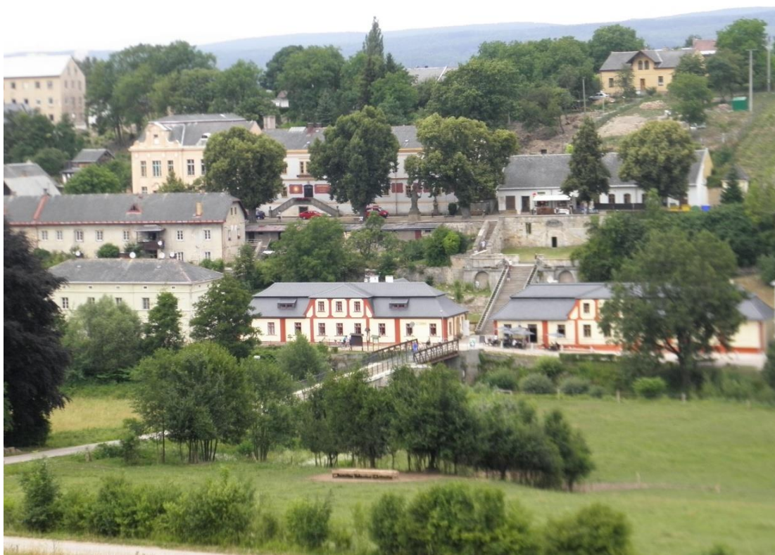
obr. č. 8. Současný pohled na bývalé lázně