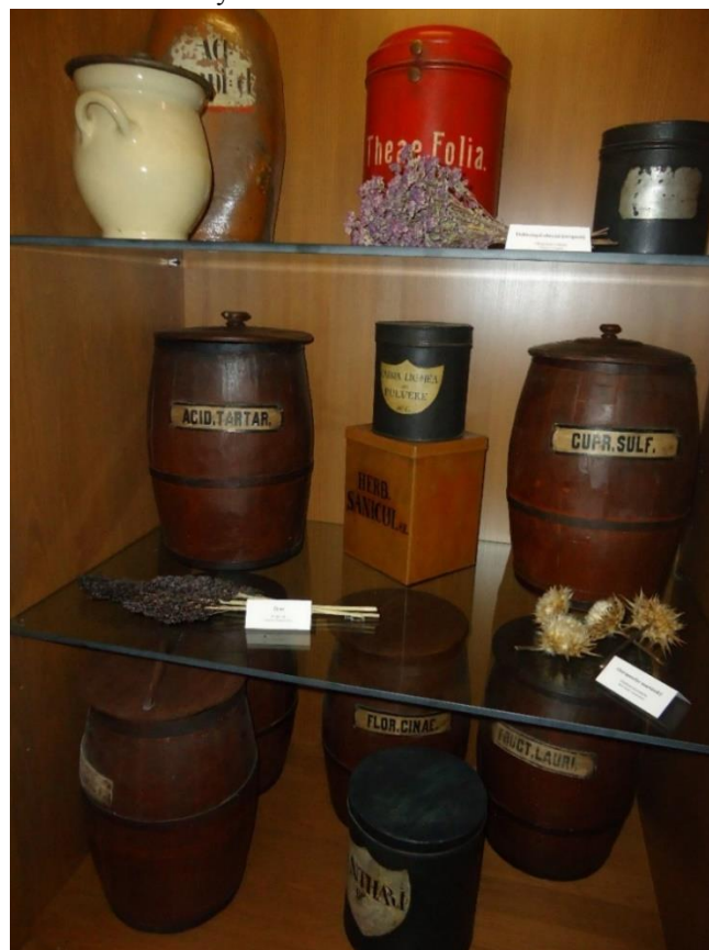
obr. č. 17. Nádoby na léčiva