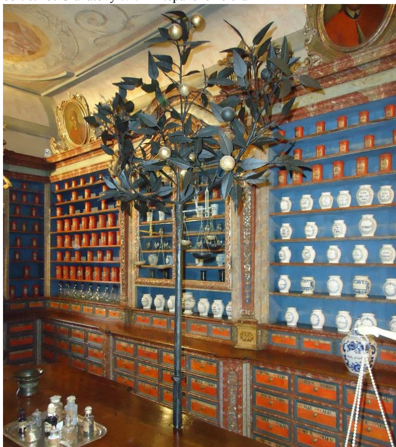
obr. č. 15. Granátový strom z tepaného železa