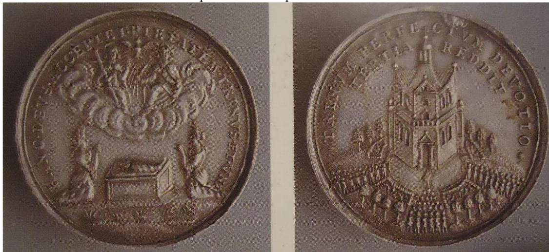
obr. č. 2. Pamětní medaile k narození potomka F. A. Šporka