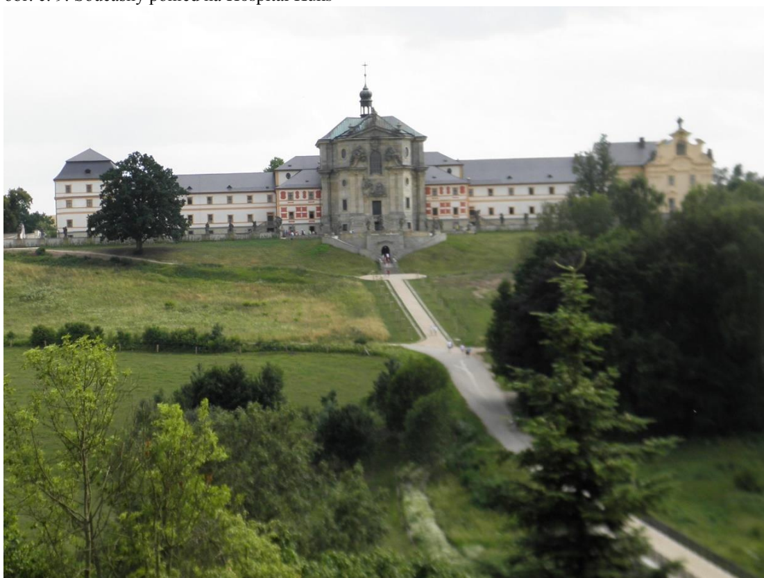
obr. č. 9. Současný pohled na Hospital Kuks