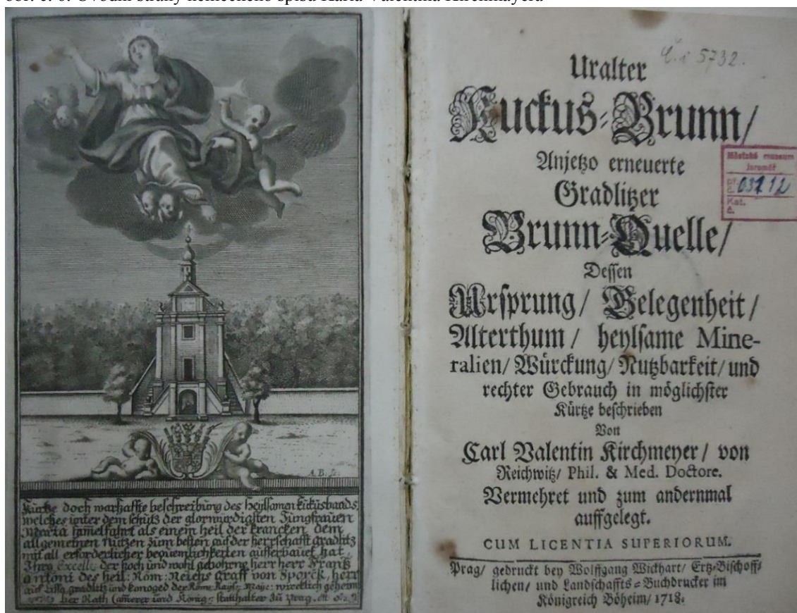
Zdroj: KIRCHMAYER, Karl Valentin. Uralter Kucus – Brunn: Anjetzo erneuerte Gradlitzer Brunn – Quelle, Dessen Ursprung, Belegenheit, Alterthum, heylsame Mineralien, Würckung, Nutzbarkeit, und rechter Gebrauch : in möglichster Kürtze beschrieben . Praha: Wolfgang Wirckhart, 1718.