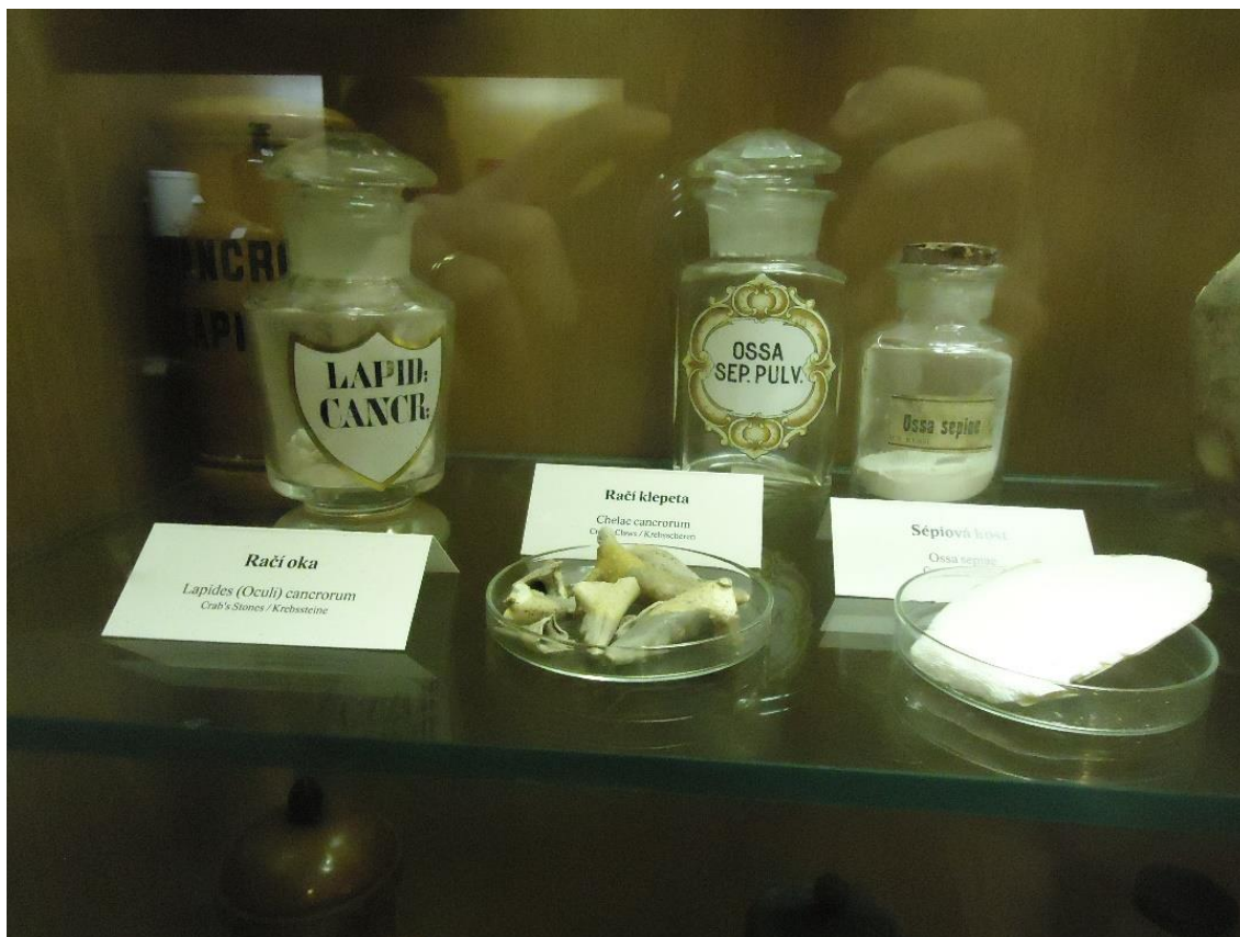
obr. č. 19. Zoofarmaka