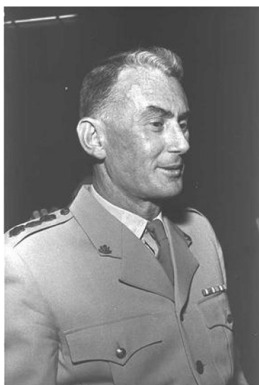
Plukovník Benjamin Gibli 158