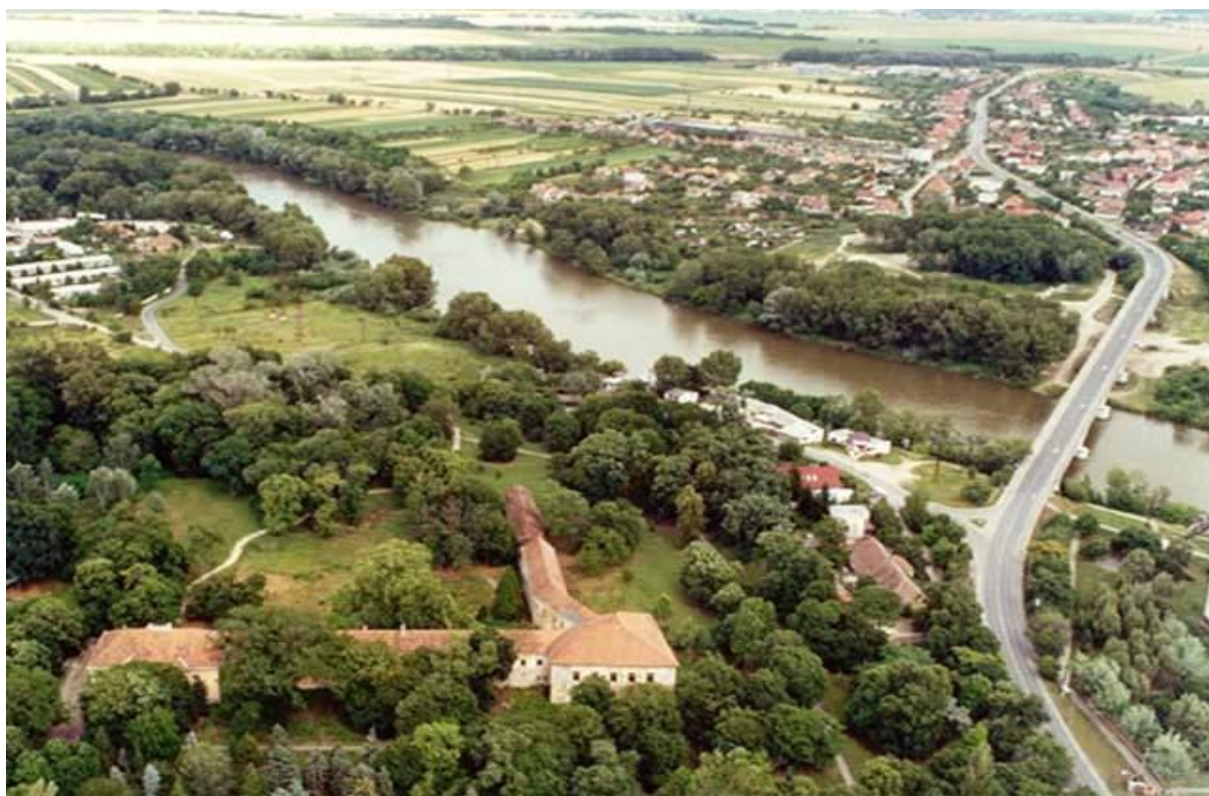
Letecký snímok Sereďského kaštieľa