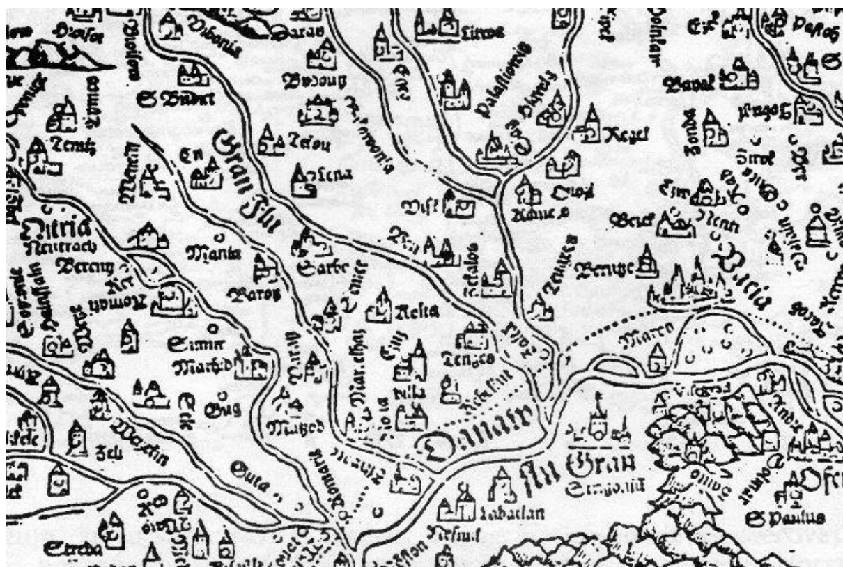
Časť Lazarovej mapy