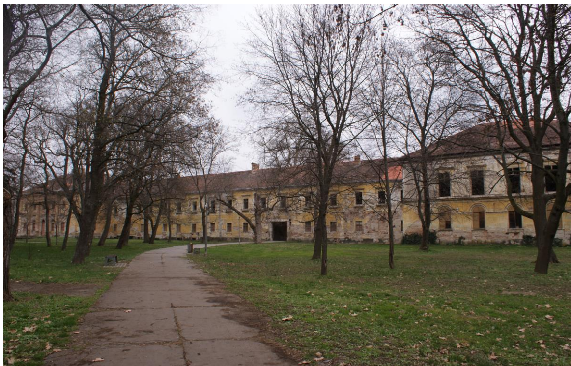
Príloha č. 7 Západné krídlo Sered'ského kaštieľa (bývalého Šintavského hradu)