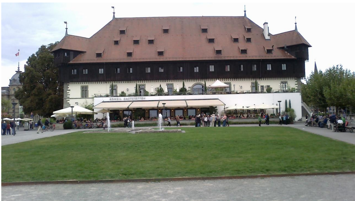
Příloha č. 9 – Budova koncilu, kde se konkrétně konalo v listopadu 1417 konkláve, jež zvolilo papeže Martina V.