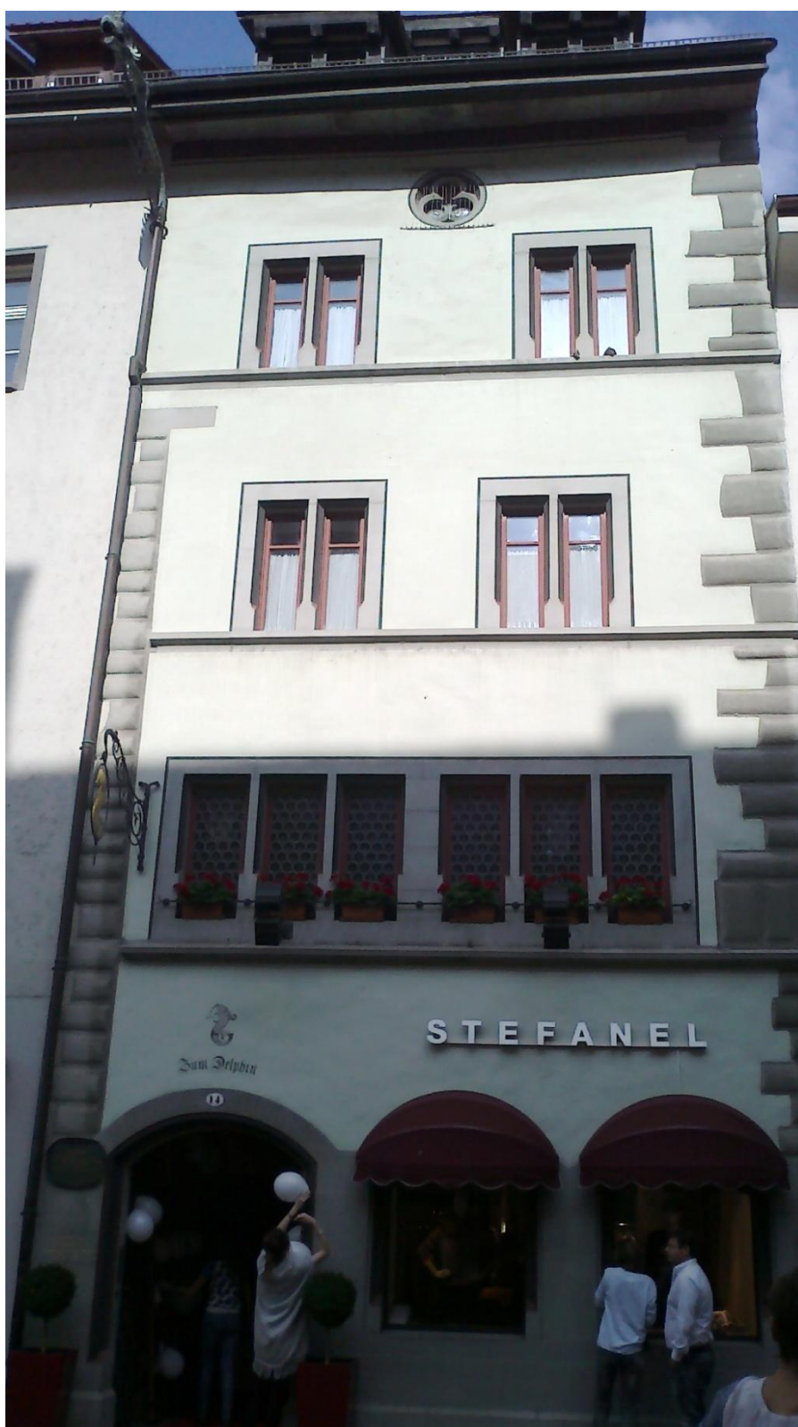
Příloha č. 4. – Dům U Delfína, v němž pobýval Jeroným Pražský před útekem z Kostnice.