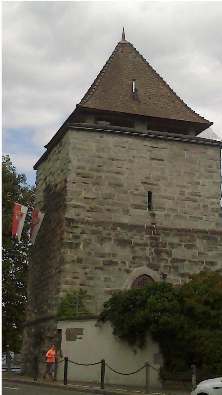
Příloha č. 1 – Prašná věž ze 14. století jako severozápadní opevnění města Kostnice, kdysi také jako vězení.