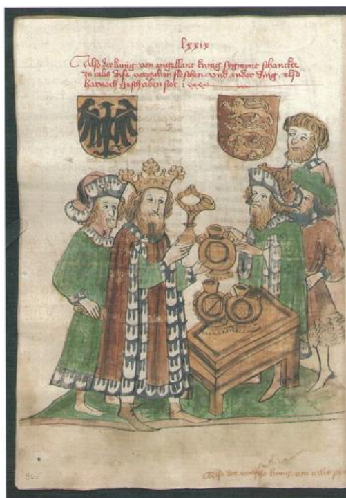
Příloha č. 8 – Zikmund Lucemburský a Jindřich V. při diplomatickém jednání v Narbonne. Obrázek pochází z kroniky Eberharda Windeckeho, vydáno v roce 1443. (Zdroj: Tamtéž, s. 25.)