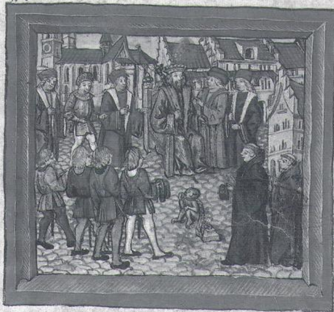
Příloha č. 6 – Římský král Ruprecht Falcký v Kostnici v roce 1408. Obrázek pochází z díla Diebolda Schillinga Bildechronik , vydáno v roce 1513. (Zdroj: MAURER, Helmut, Konstanz im Mittelalter / Von den Anfängen bis von Konzil. Bd. 1 , Konstanz 1989, s. 236.)

N ber von ein frucht fruchtend der heisthaft und den appemellen und wie der geruch vnde onsch von ein faden winter nd affi man zalt von der gabint tustle q mit vny jar da vnd vnt on faller winter kom leuter lich die von appemell mit em dene voll fr braten vnd lagont xv wochen darvor onsch wie macht uff dem silber tag da kamen die heere vo wader berg von monfort vom heiligen kug mit grof voll die stat vnd die schlof zerschmiten vnd nider stie die appemeller das st mit daron vnsend erschlugen men vnd zee man die ontem fruchtend nber d vnt vnt zintend hem demochit was die sach mit geruch vnt was vntlich noch seer worden von sich onter Es sachen onsch haltend antonomie aber die sach giet allen adel zehaten vnd die vntlich vntm so hie sie das onsch me darom missen hien wa es mit vnt abgestelt werden vnd affi vnt onsch die zu gaten Es fring vnt pacht dan vntem kom onsch entlich dene fristen vnd hien mit vnt vnt stucht der fring vnt doren von appemell onsch nach hem apt vnt den v pating des kriegs hien affi es onsch all pating hien dant die appemeller in grofen eren bestunden vnt vnt die sach vntlicher schaden zoren schaden vnt plit hnt vntlicher zintlich gntlich halten merman de hntem mit zentwntzen hien da vnt onsch der ering vnt gemacht fruchtend den von frucht vnt glant vnt lueff vnt daget darom uff geruch die mit not ze melken