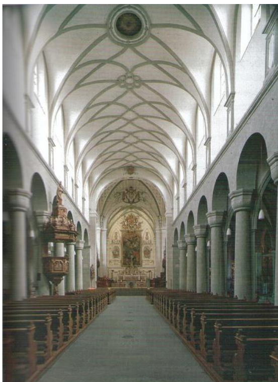
Příloha č. 7 – Střední loď kostnického Münsteru