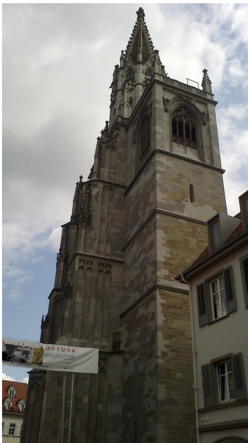
Příloha č. 3 – Münster Naší milé Paní, katedrála, v níž se během koncilu konala církevní zasedání.