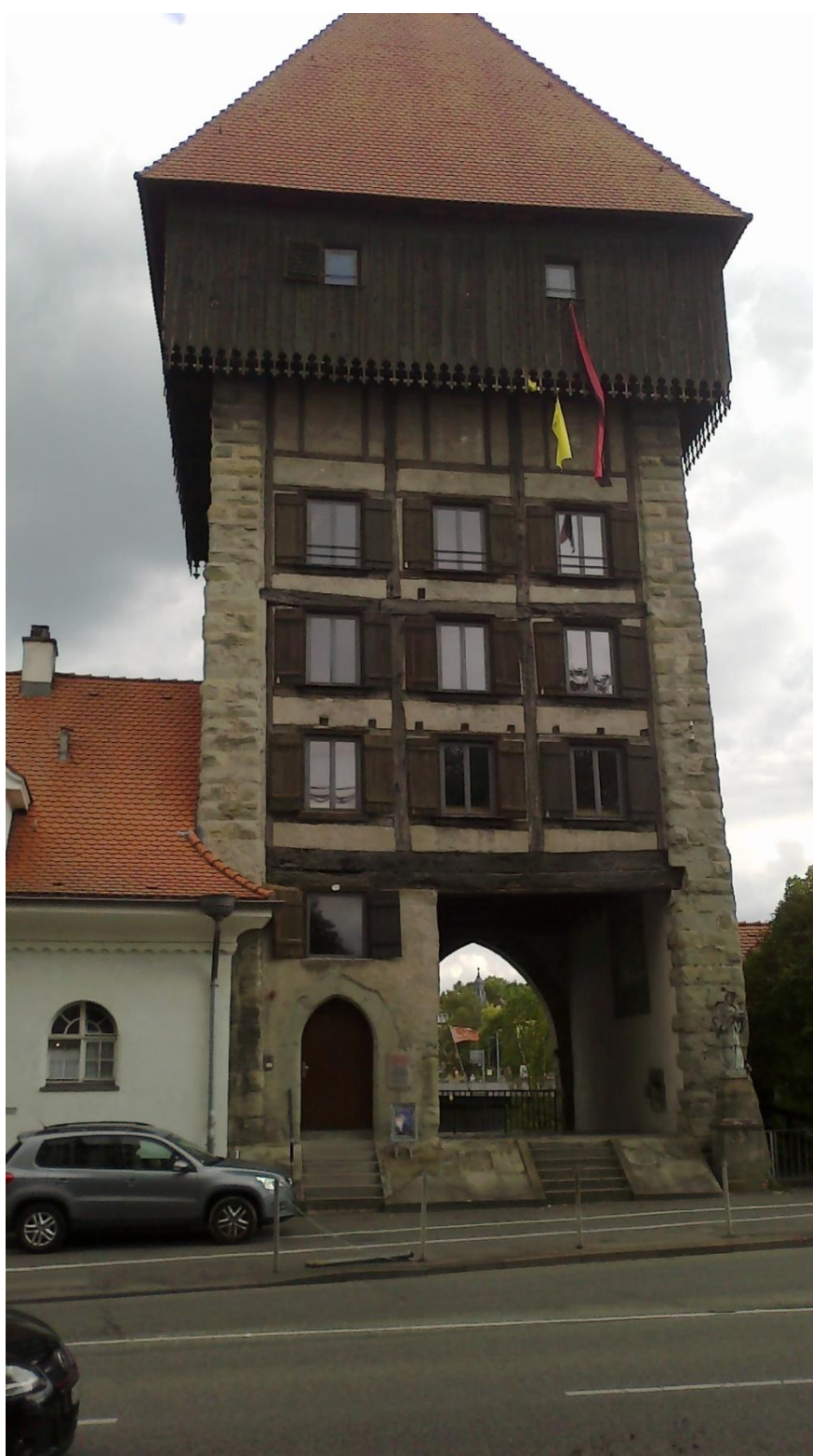
Příloha č. 2 – Rýnská brána na severu města z roku 1200 na obranu rýnského mostu.