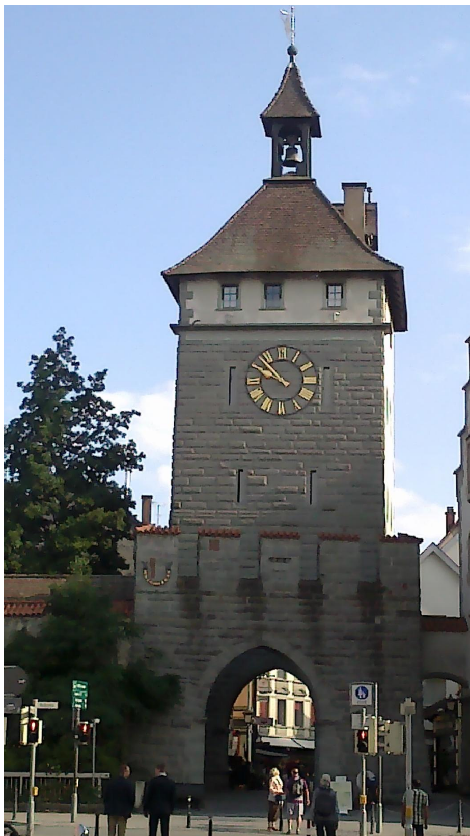
Příloha č. 5 – Schnetztor , jižní městská brána, další kostnická ochranná stavba. Za ní se nachází Husův dům.