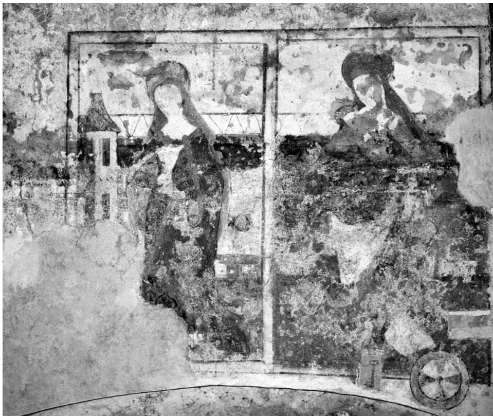
Švihov, bývalý špitální kostel sv. Jana Evangelisty, kol.1504, již. strana lodi, sv.