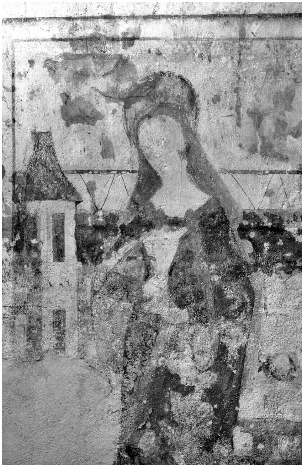
Švihov, býv.špitální kostel sv. Jana Evangelisty, kol.1504, již.strana lodi,Sv.