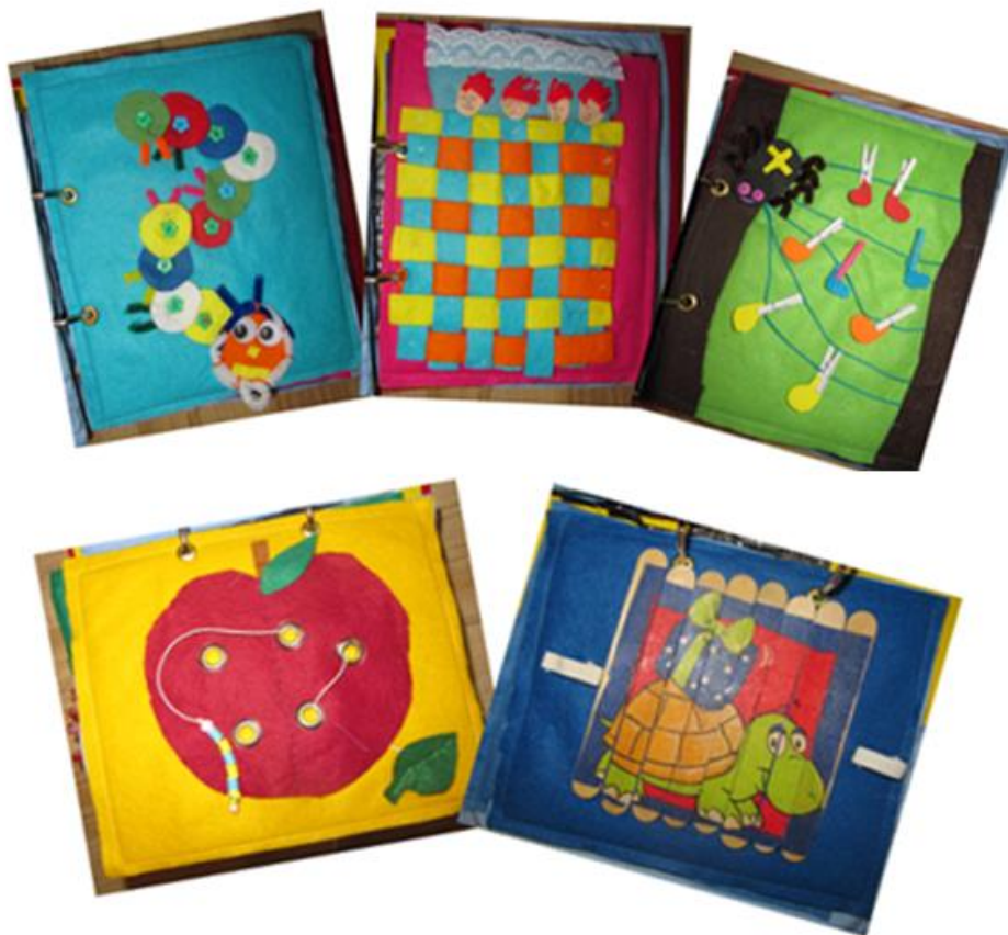
Obrázek 2: Jednotlivé stránky knihy „Pomocníček“ (2)