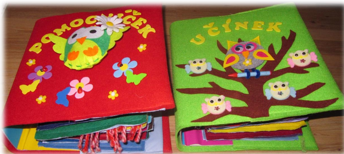
Obrázek 6: Výsledné výrobky – Knihy „Pomocníček“ a „Učínek“

Výsledkem našeho projektu byly dvě pestré knihy – Pomocníček a Učínek, které na sebe navzájem navazují, každá obsahuje 11 stran. Ty jsou vyrobeny z plsti a uvnitř zpevněny kartony. Veškeré stránky žáci vyráběli ručně, tudíž si zároveň i oni bezděčně a s velkým zaujetím nově osvojovali a rozvíjeli své dovednosti. V knize „Pomocníček“ se žáci zaměřili především na rozvoj manuálních dovedností, druhý díl knihy – „Učínek“ pak obsahuje i stránky spojené s vědomostmi z oblasti matematiky a českého jazyka. Žáci během projektu bez problémů a s nadšením spolupracovali, překonávali své dovednosti nebo dokázali slušně a s pokorou požádat spolužáky o pomoc. V tom vidím ale na druhé straně úskalí, že se někteří žáci sami ani nesnažili překonat své schopnosti a ulehčovali si práci díky ostatním.