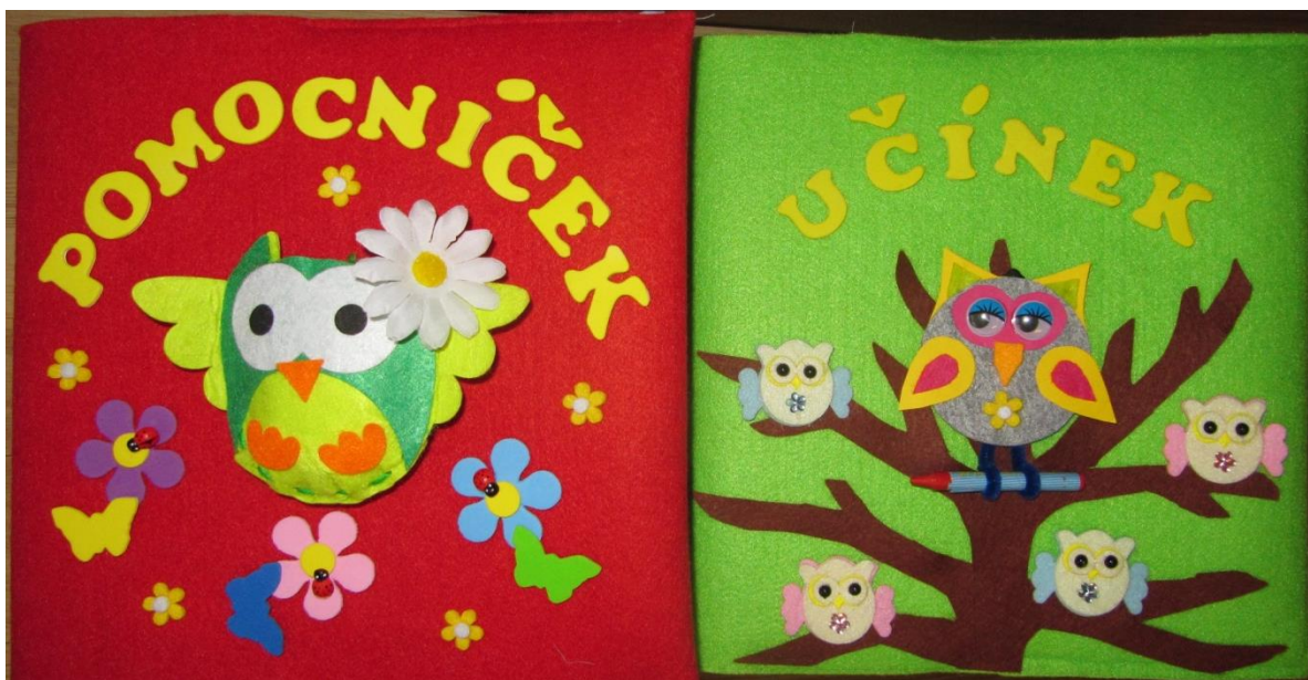
Obrázek 5: Obaly knih „Pomocníček“ a „Učínek“