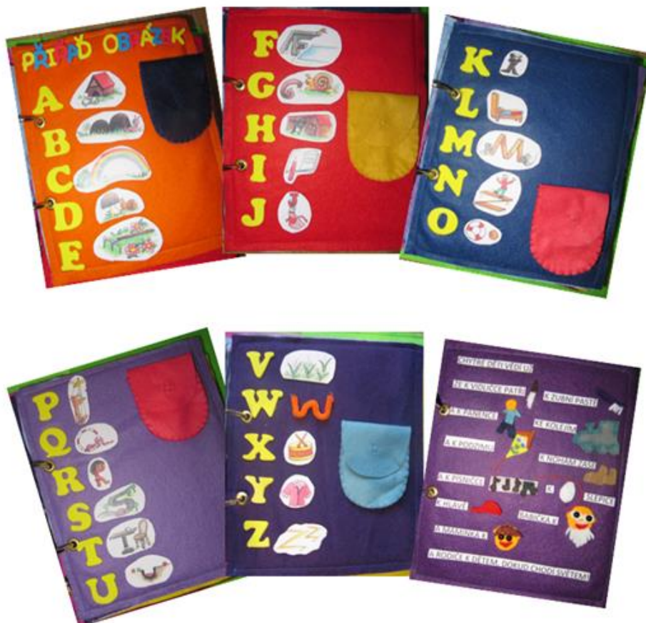
Obrázek 3: Jednotlivé stránky knihy „Učínek“ (1)