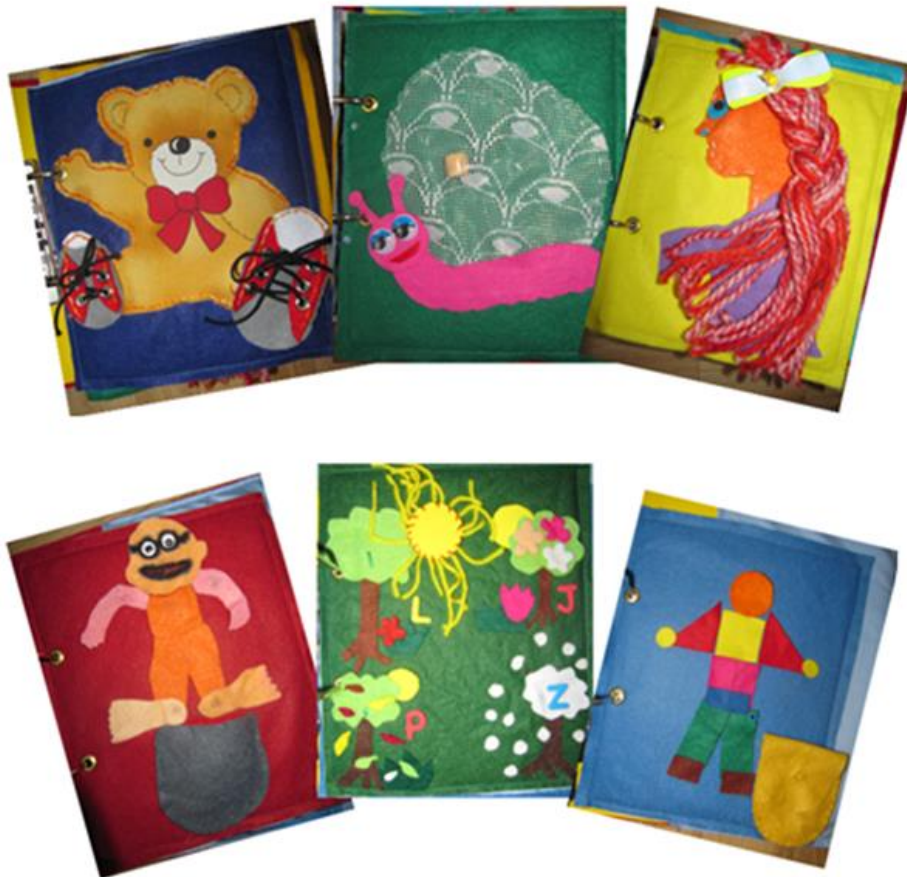
Obrázek 1: Jednotlivé stránky z knihy „Pomocníček“ (1)