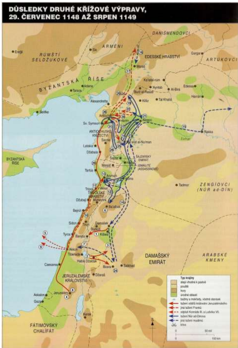
Obr. 6. Důsledky druhé křížové výpravy – 29. 7. 1148 – srpen 1149