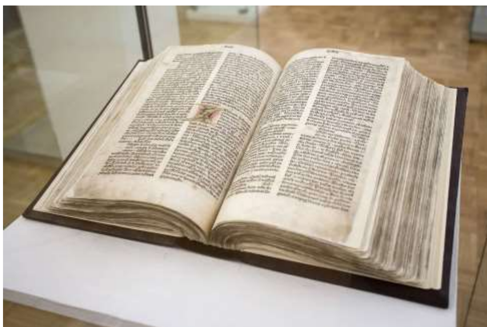
Obr. 4. Originál první slovanské tištěné Bible