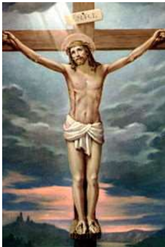
Obr. 3. Vyobrazení Ježíše Krista na kříži, zdroj: www.google.cz