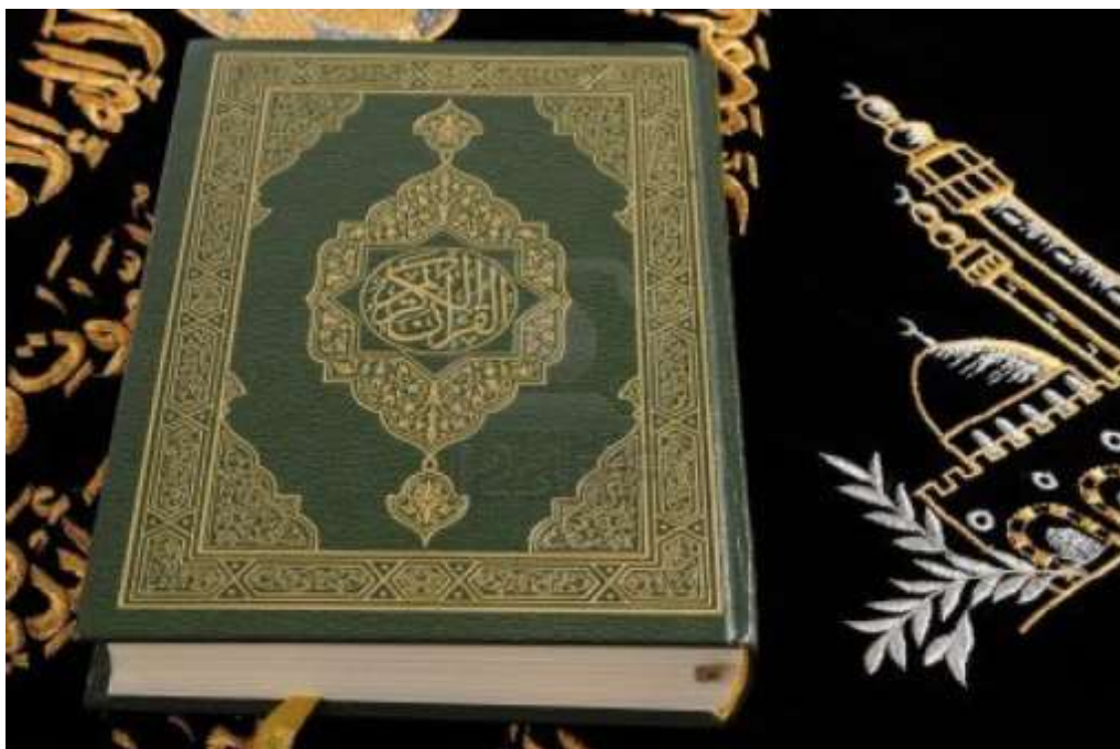
Obr. 1. Svatý Korán