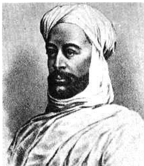
Obr. 2. Prorok Mohamed, zdroj: www.google.cz