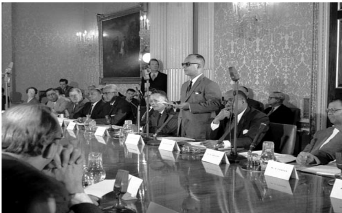
Příloha č. 7 - Trinidad a Tobago: Premiér Eric Williams na konferenci nezávislosti.