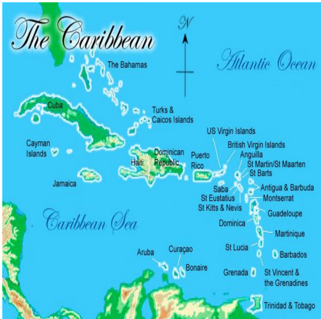
Příloha č. 1 - Přehled ostrovů Karibiku