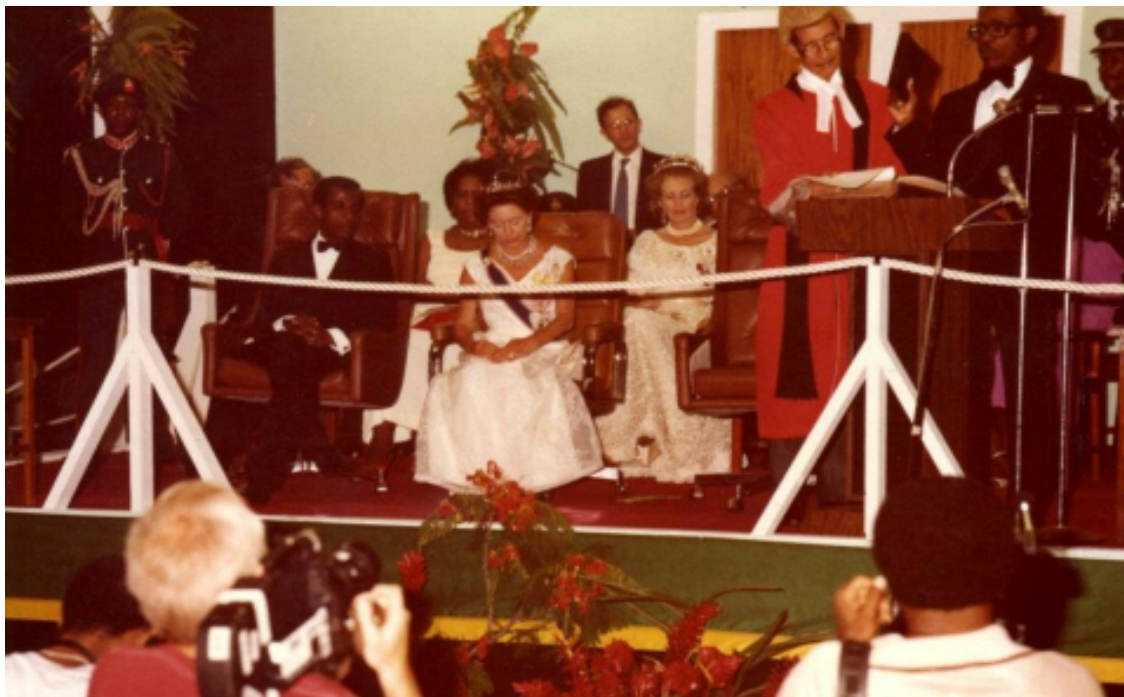
Příloha č. 6 - Svatý Kryštof a Nevis: Princezna Margaret a premiér Kennedy Simmonds na oslavách nezávislosti roku 1983.

Zdroj: http://www.caribbeanelections.com/education/independence/kn_independence.asp , [cit. 2017-02-11].