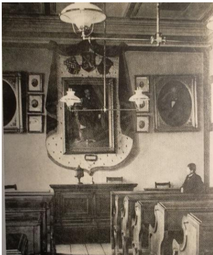
PŘÍLOHA 5: PŘÍBRAMSKÝ HOTEL BUCAR 533