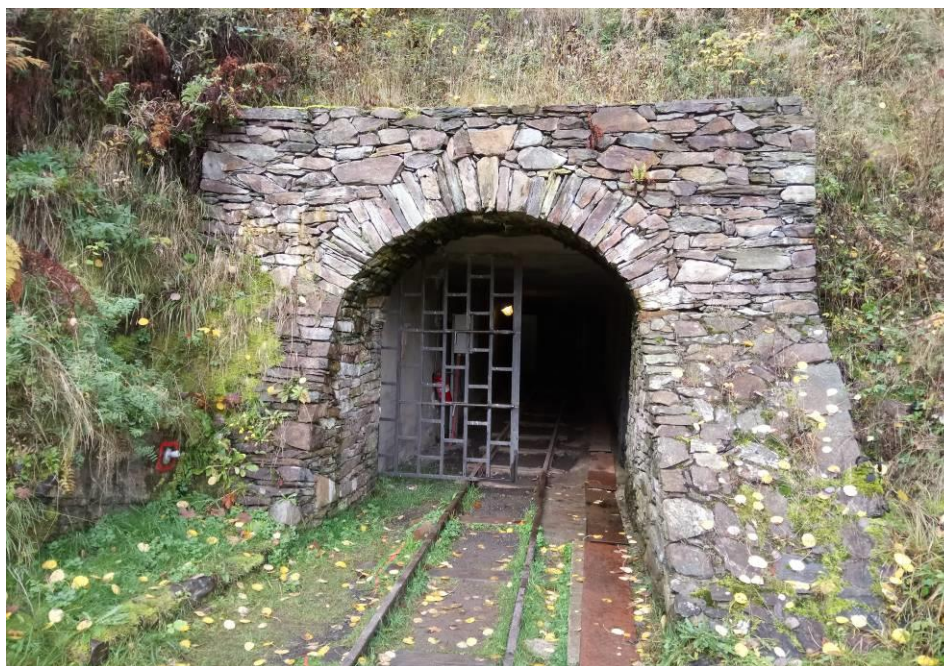
Obrázek 14 – Štola č. 1 Jáchymov - vchod do štoly