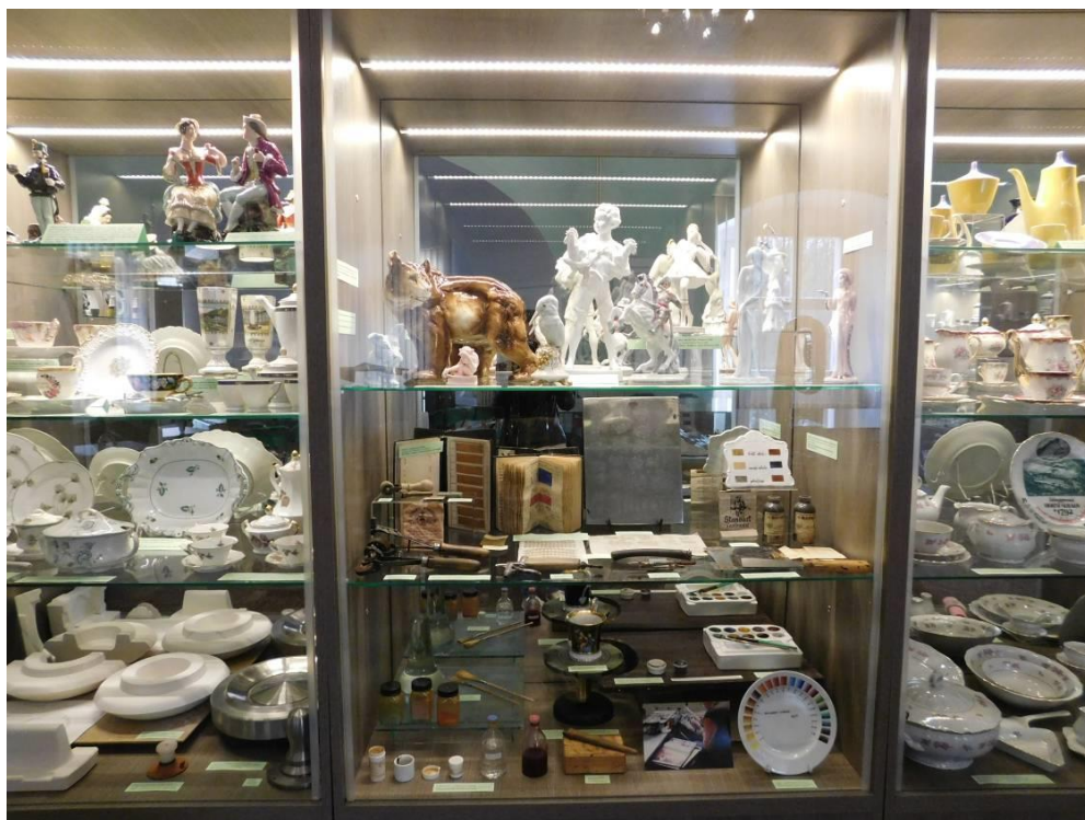
Obrázek 9 – Ukázky výroby porcelánu