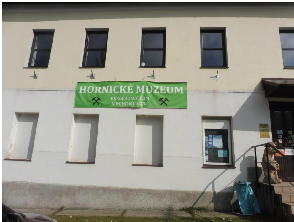
Obrázek 5 (archiv autorky) - Hornické muzeum Krásno