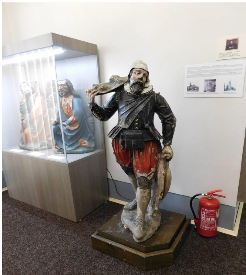
Obrázek 7 (archiv autorky) – Socha horníka v typickém kroji