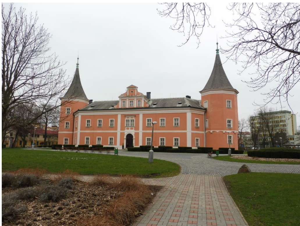
Obrázek 26 Sokolovský zámek