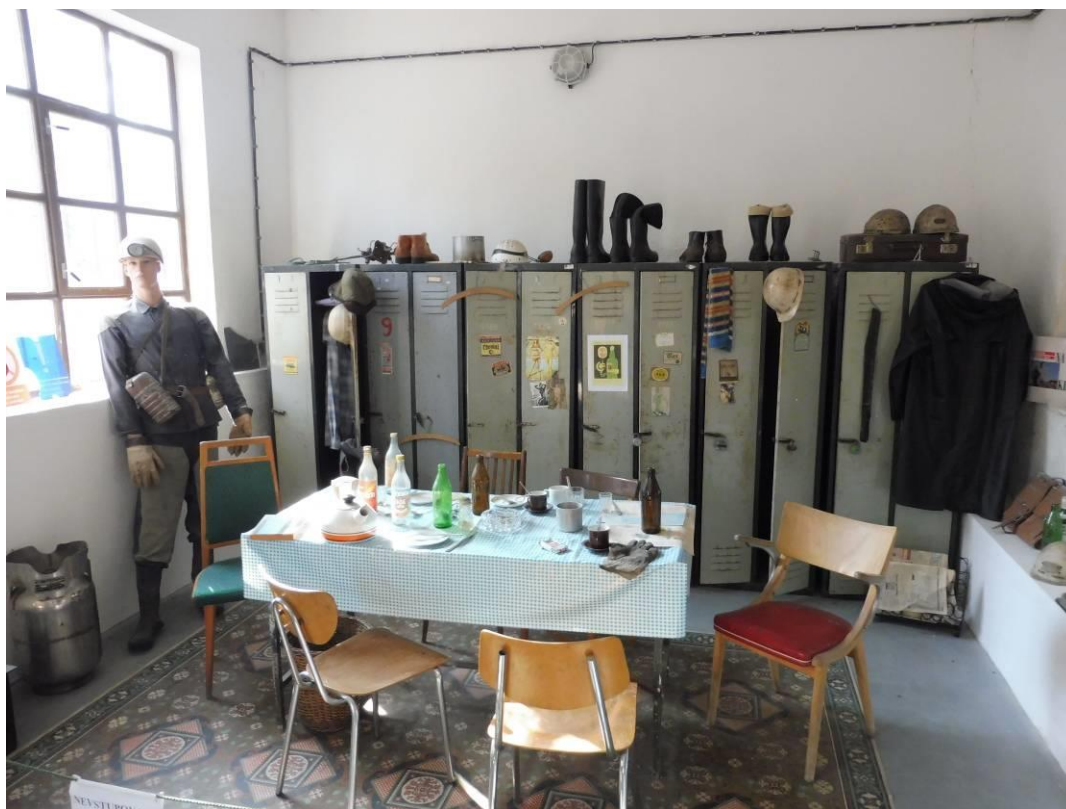
Obrázek 22 - (archiv autorky) Šatna horníků