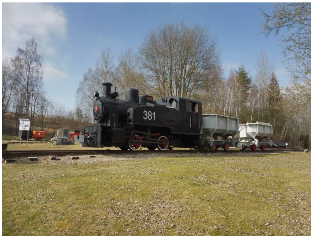
Obrázek 21 - (archiv autorky) Lokomotiva - Hornické muzeum Krásno