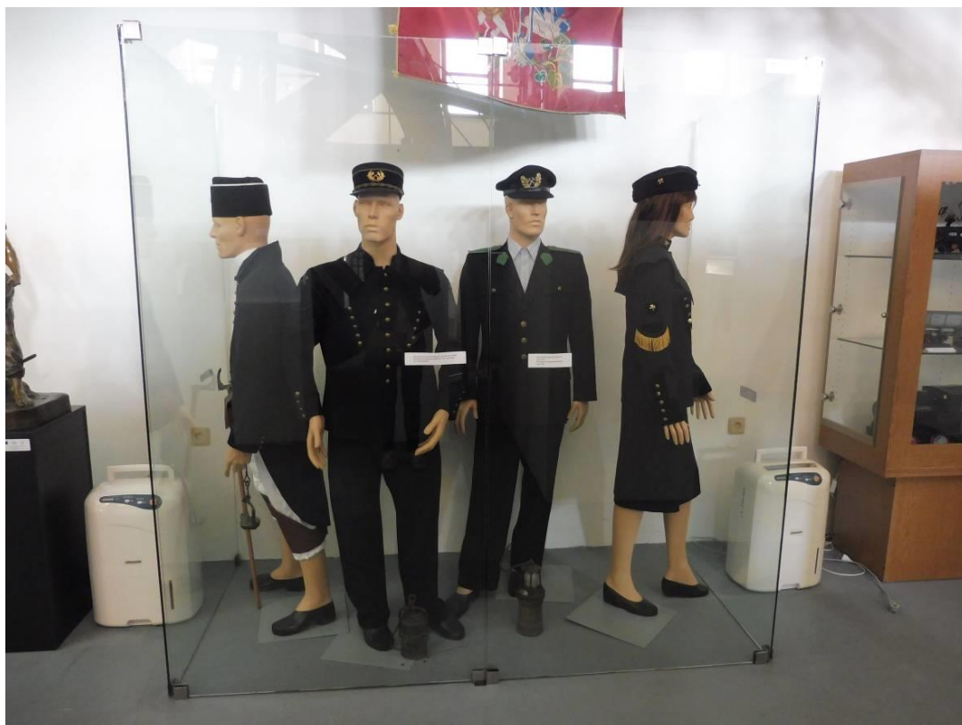
Obrázek 23 - (archiv autorky) Slavnostní hornické uniformy