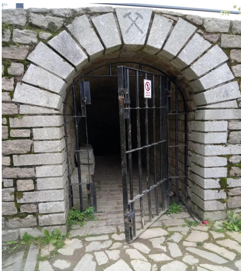
Obrázek 13 (archiv autorky) – Důl Jeroným - vchod do dolu