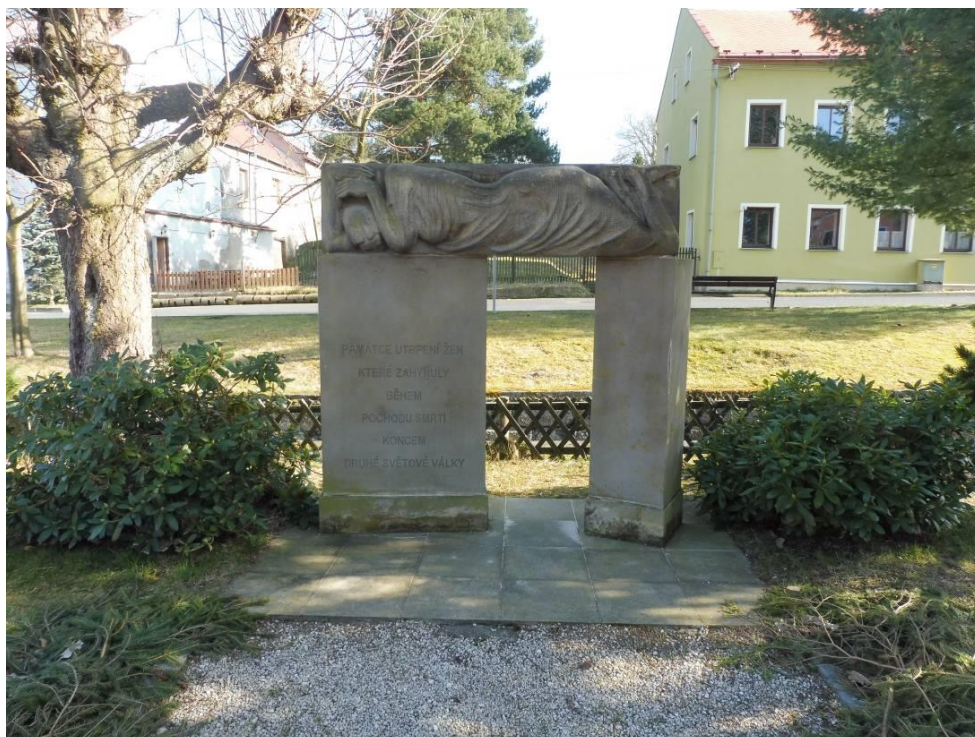
Obrázek 25 - (archiv autorky) Pomník ženám, které zahynuly během pochodu smrti