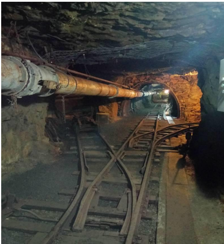
Obrázek 15 – Štola č. 1 Jáchymov