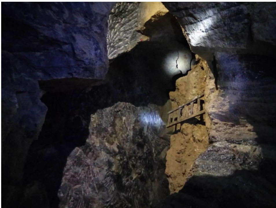
Obrázek 1 - Chodba důl Jeroným