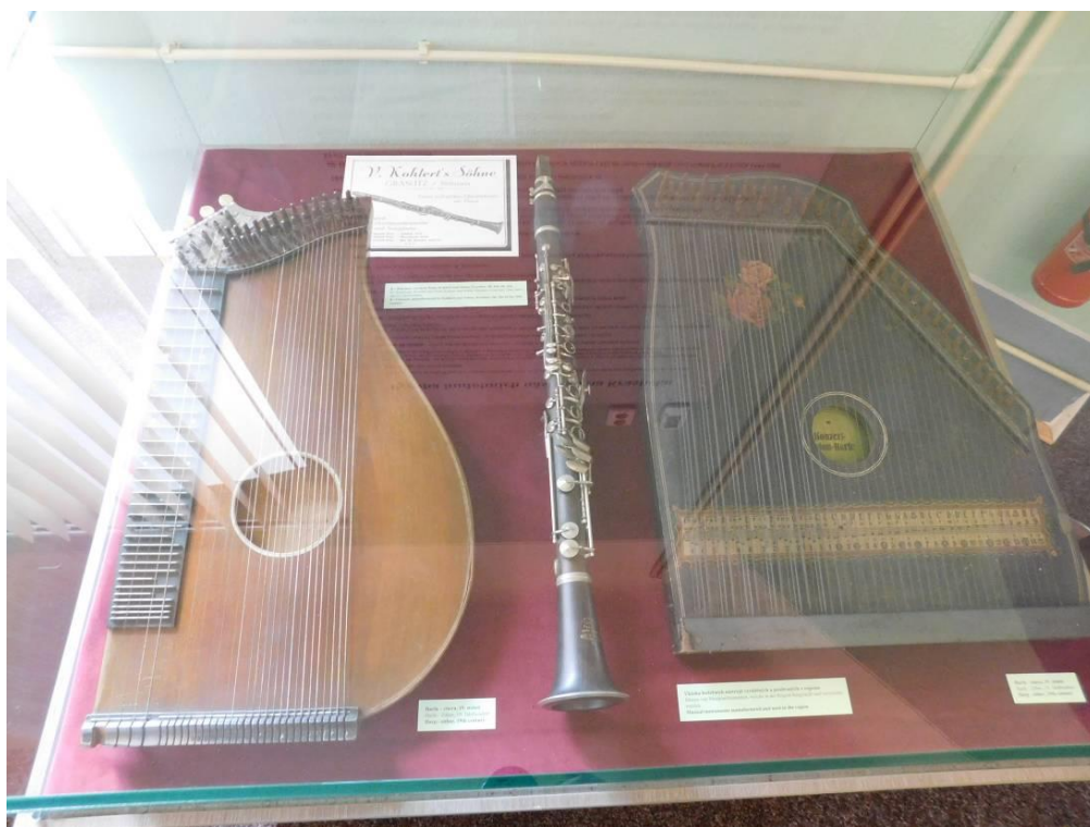
Obrázek 10 – Hudební nástroje z Kraslicka