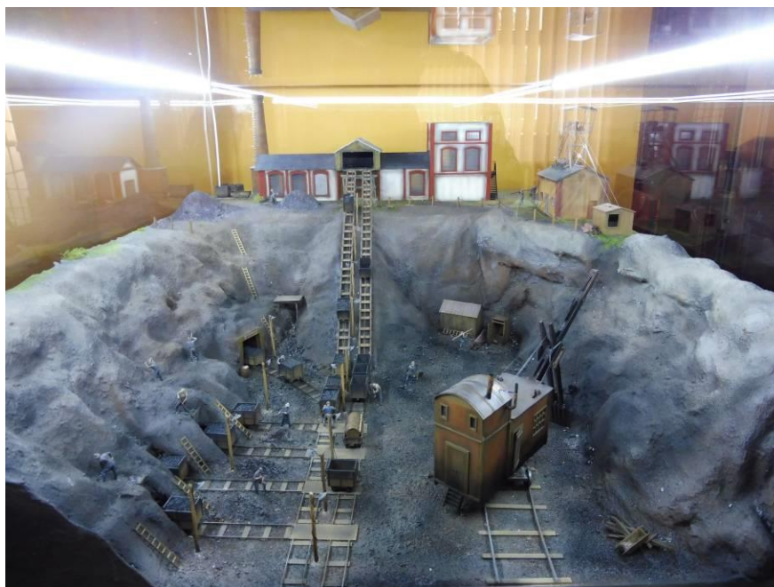
Obrázek 17 - Model dolu Bohemia