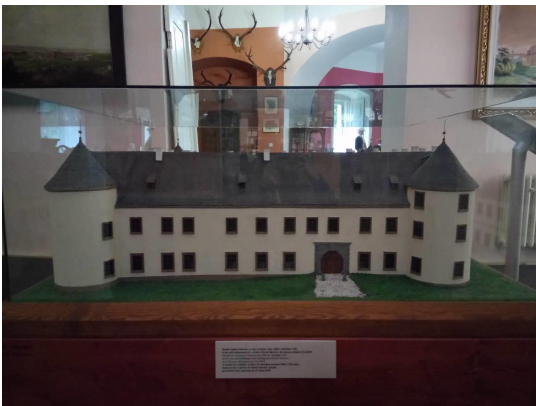
Obrázek 2 - Model sokolovského zámku z roku 1860