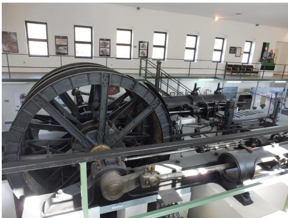
Obrázek 24 - Těžní parní stroj z dolu Marie