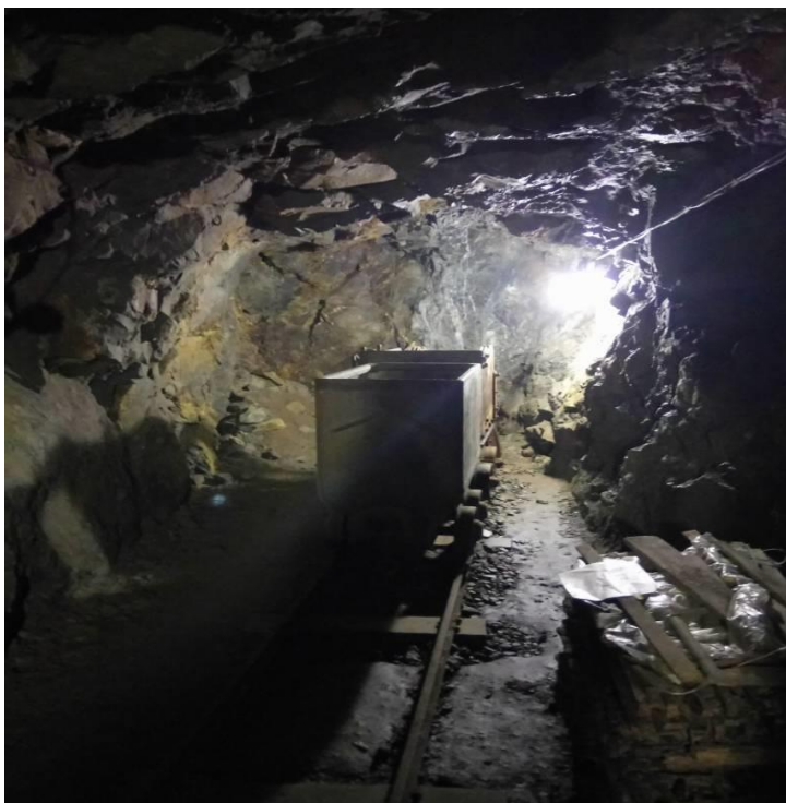
Obrázek 16 (archiv autorky) - Štola č. 1 Jáchymov - důlní vozík