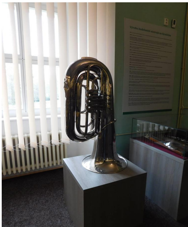
Obrázek 11 Hudební nástroj z Kraslicka