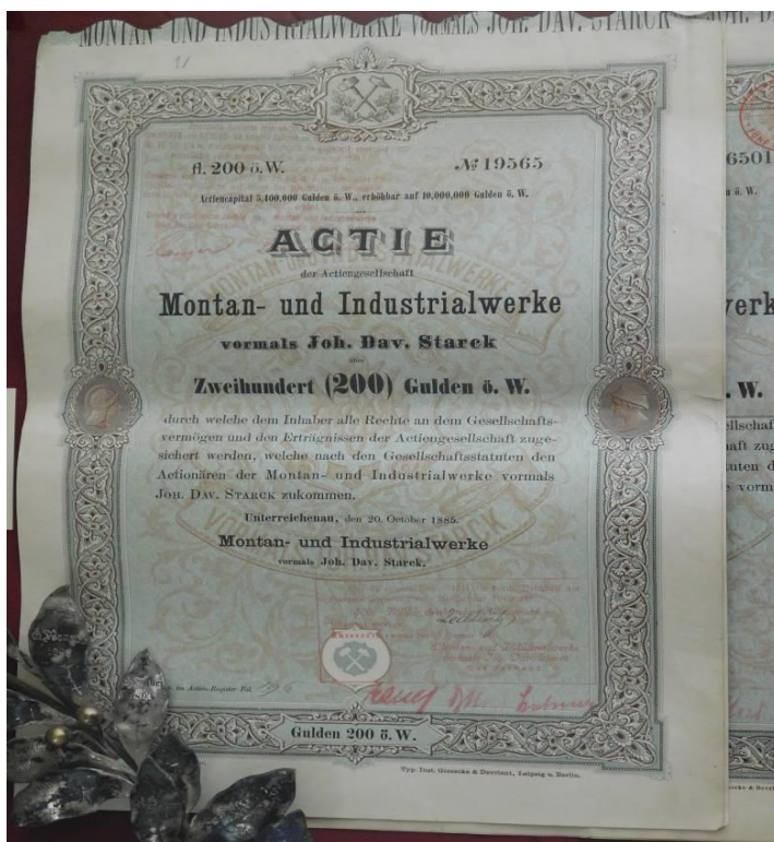
Obrázek 12 – Akcie firmy "Dolové a průmyslové závody"