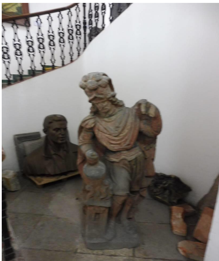
Obrázek 18 (archiv autorky) - Socha sv. Floriana u vchodu do muzea Sokolov