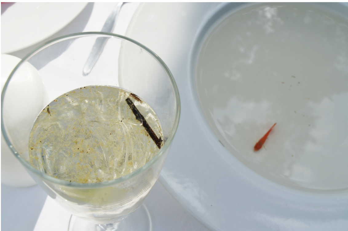
Obrázek č. 5.5 – detail 3