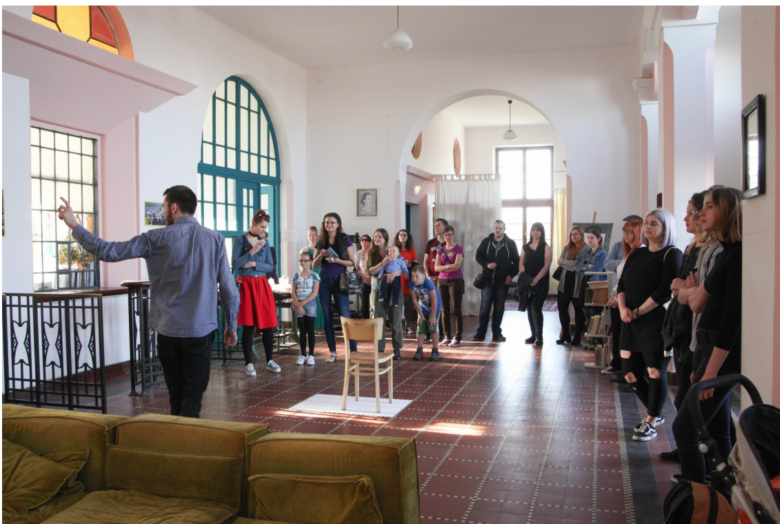
Obrázek č. 4.2 – vernisáž Nová poetika