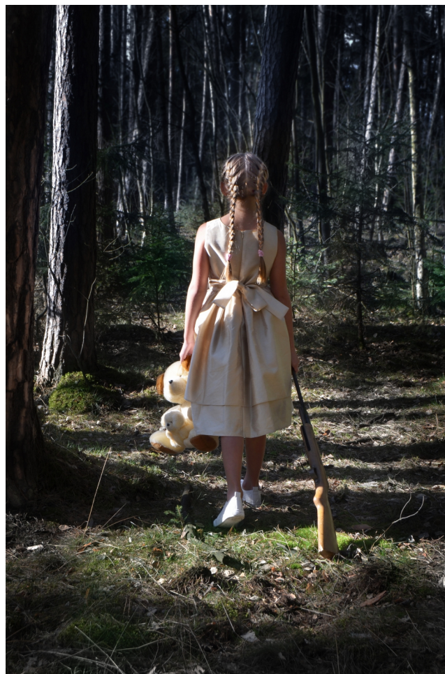
Obrázek č. 4.5 – Na dětském hřišti