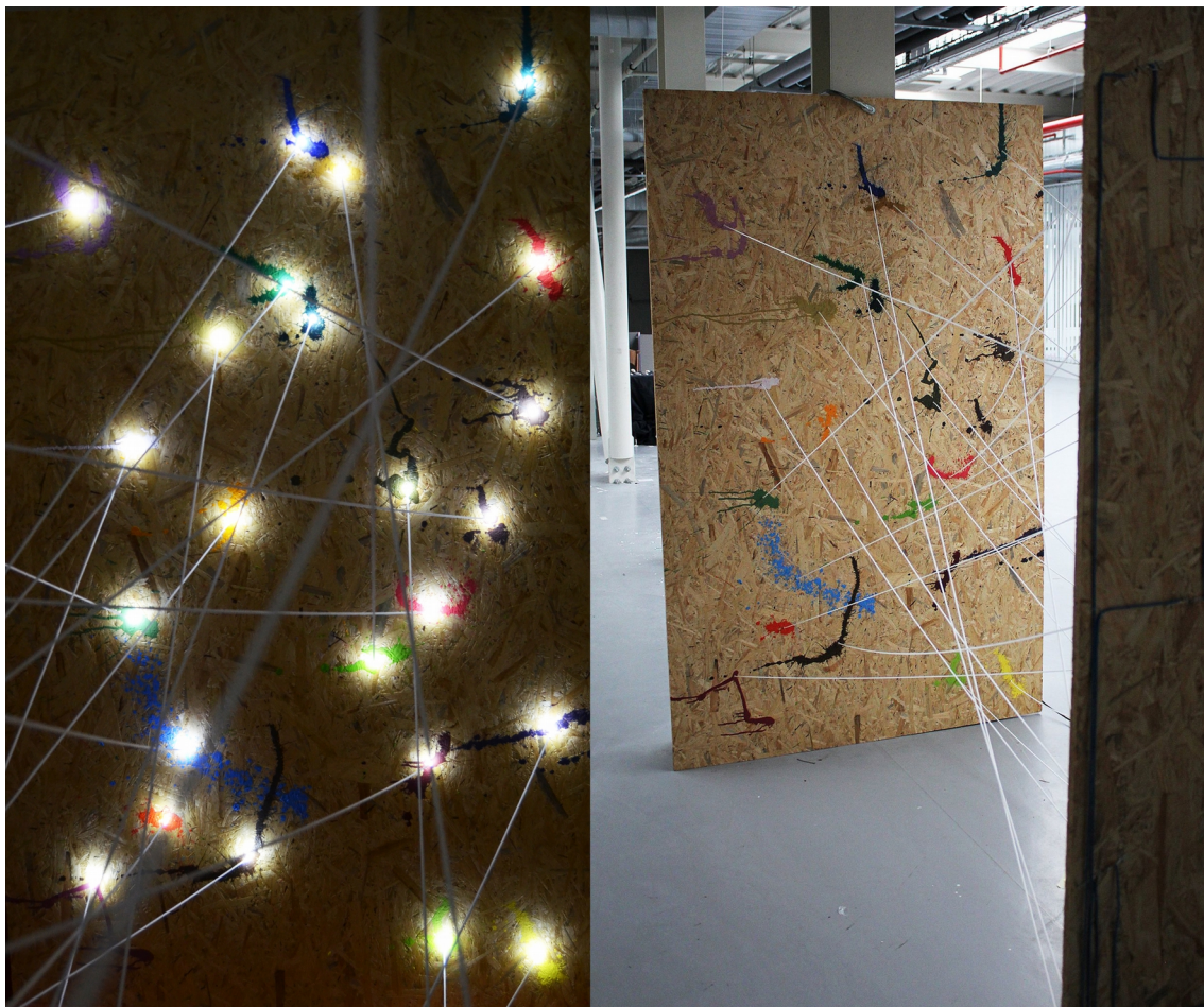
Obrázek č. 2 – objekt na téma sociální síť