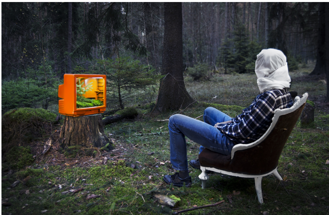
Obrázek č. 6.1 – finální fotografie