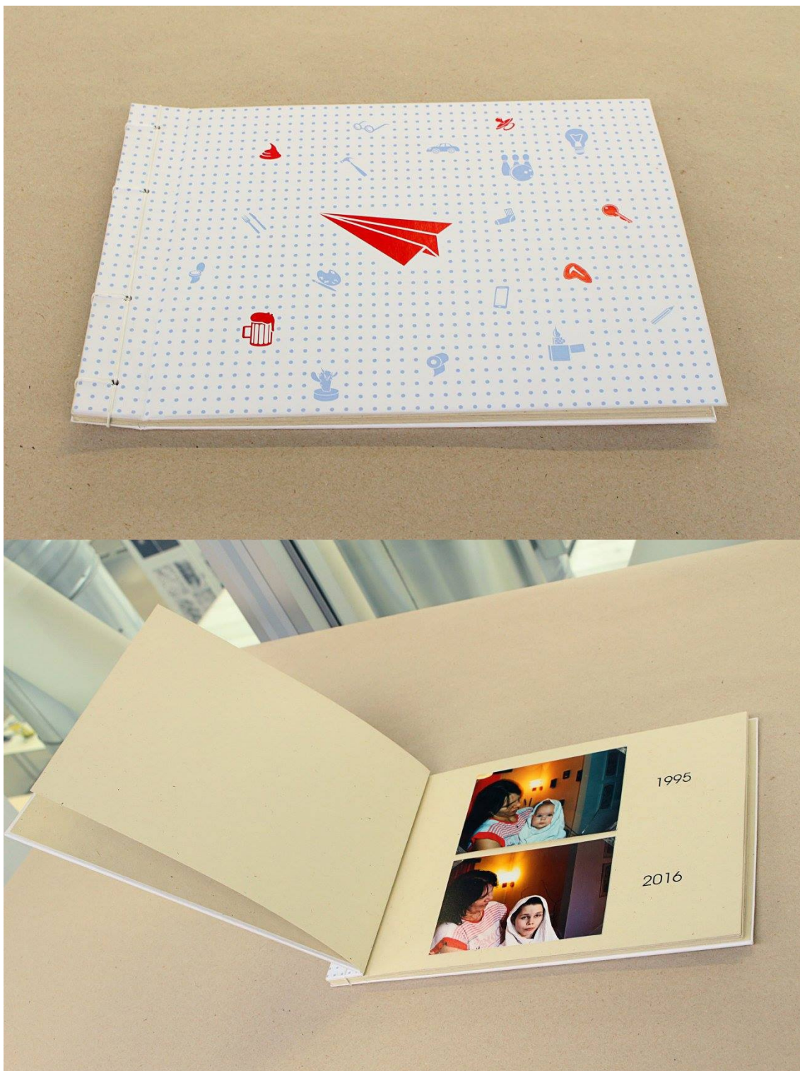
Obrázek č. 3 – fotografie předtím a potom