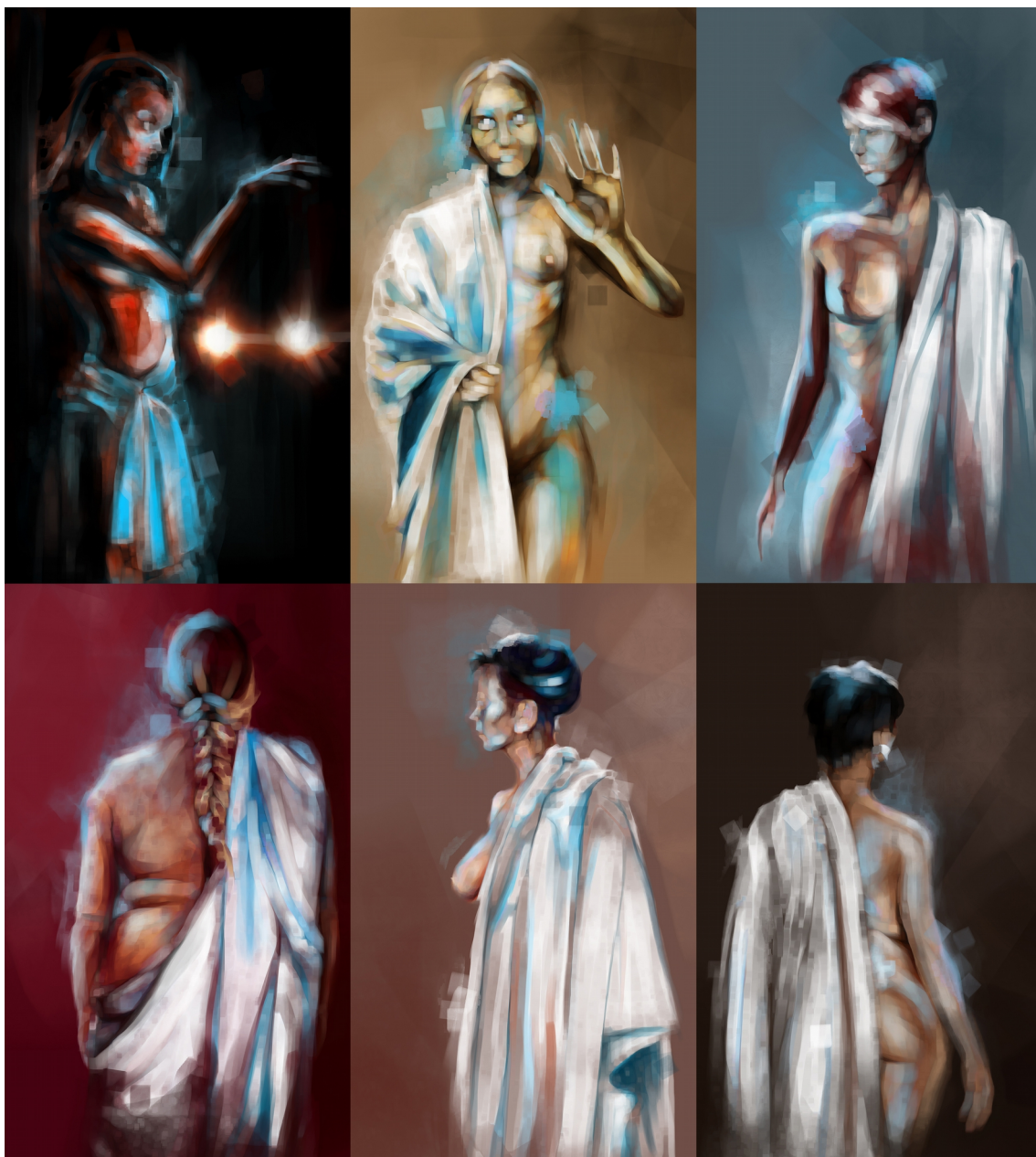
Obrázek č. 1 – soubor maleb veřejných pracovníc