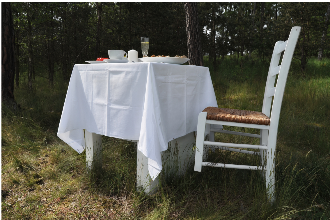
Obrázek č. 5.1 – fotografie z lesa