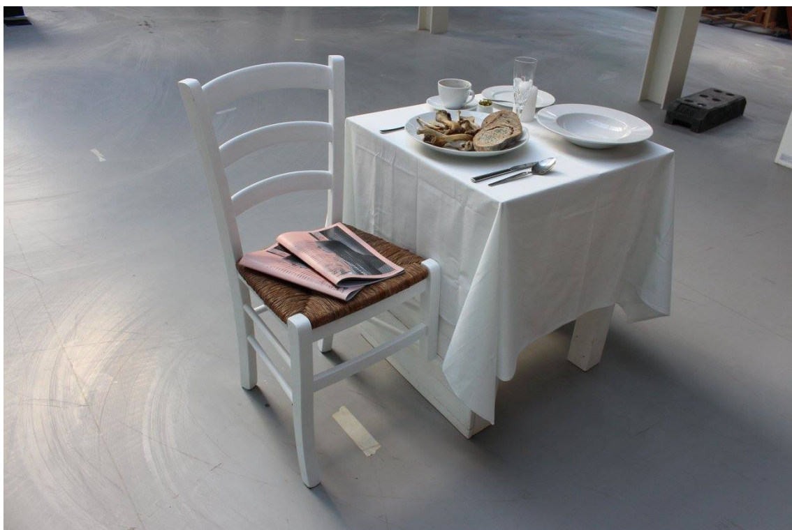
Obrázek č. 5.2 – klauzurní obhajoba