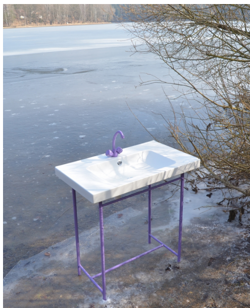
Obrázek č. 8.2 – proces tvorby