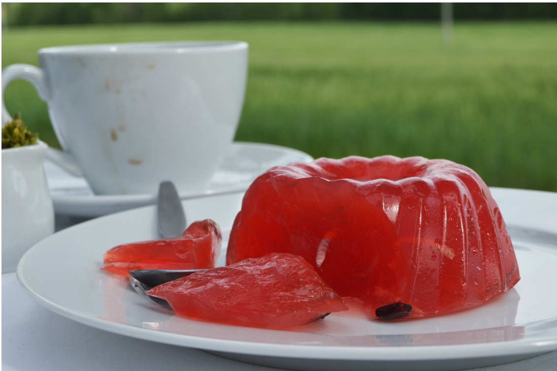
Obrázek č. 5.4 – detail 2