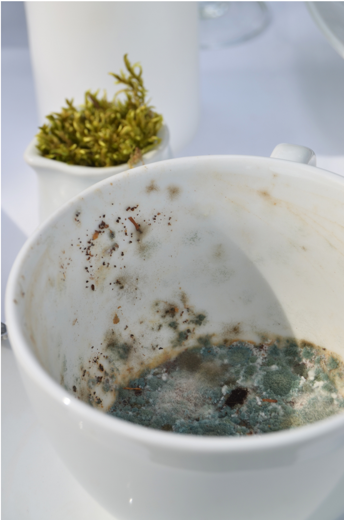
Obrázek č. 5.3 – detail 1