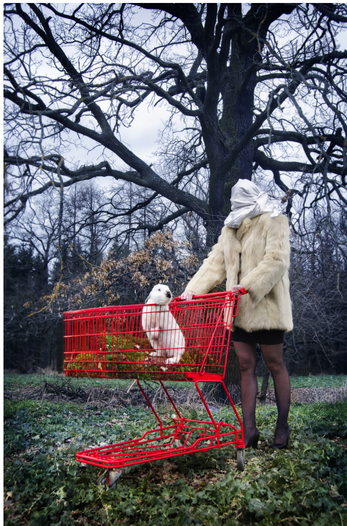
Obrázek č. 7.1 – finální fotografie