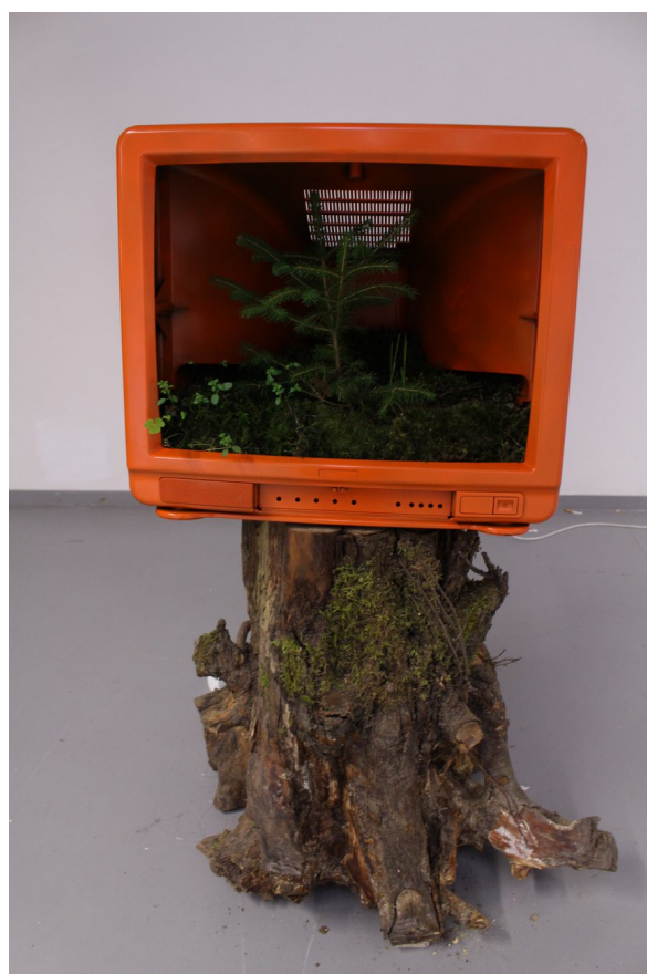
Obrázek č. 6.2 – klauzurní obhajoba