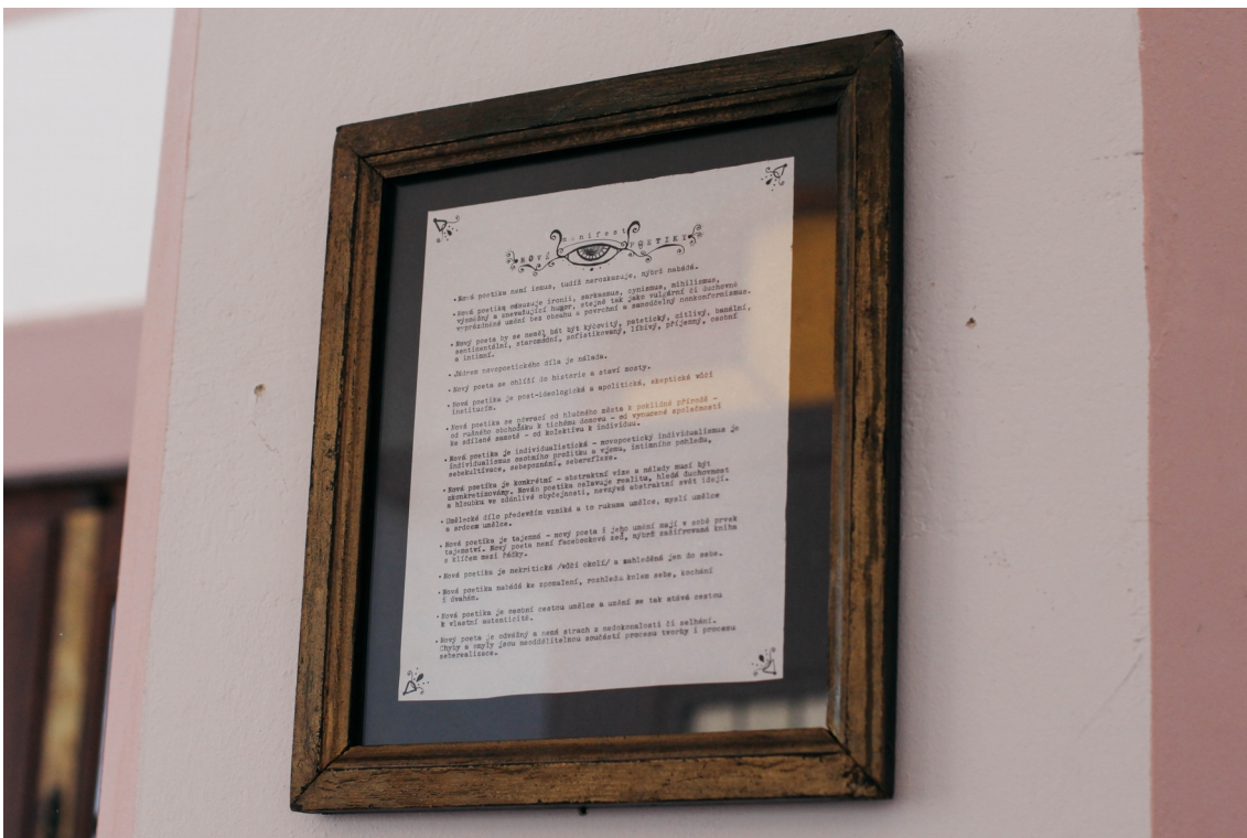
Obrázek č. 4.1 – manifest Nová poetika