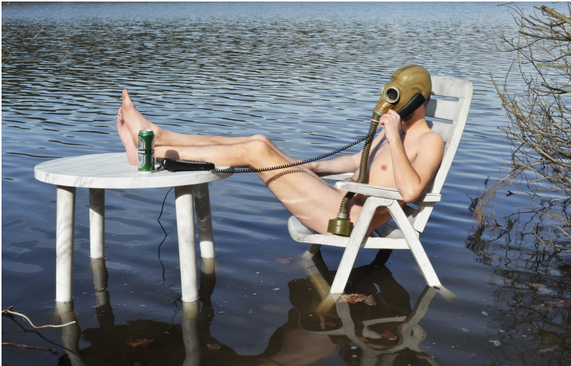
Obrázek č. 4.4 – V kanceláři