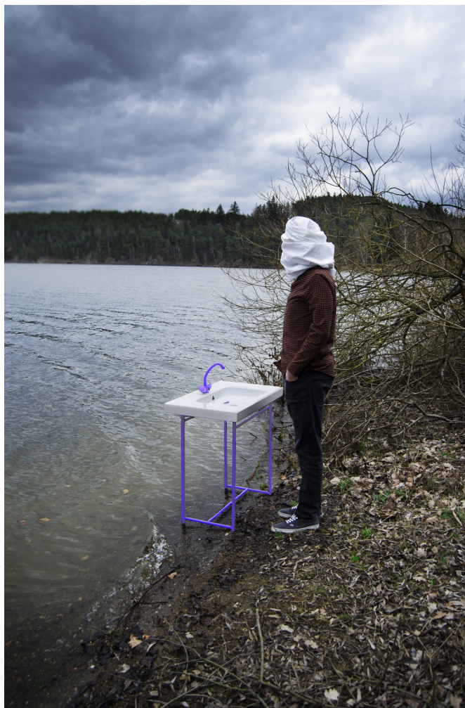
Obrázek č. 8.1 – finální fotografie