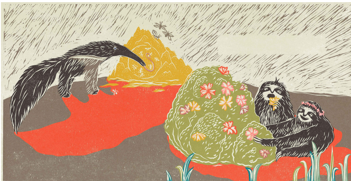
Ilustrace 15 – Mravenečník 24