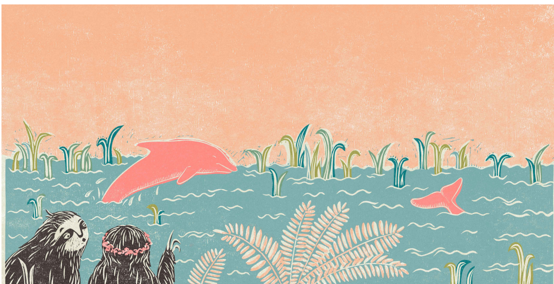
Ilustrace 16 – Růžový delfín 25