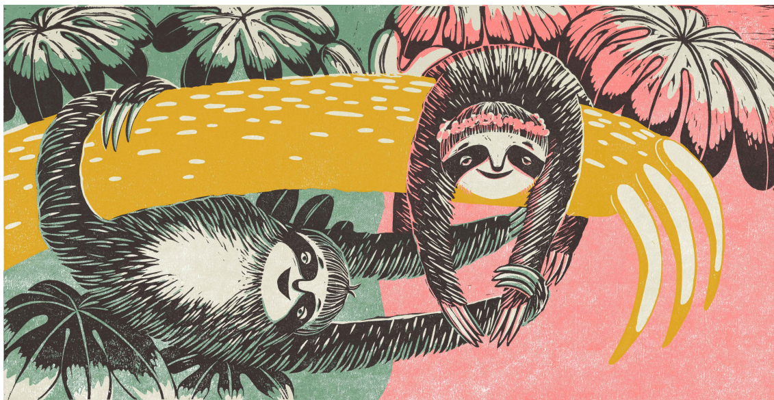
Ilustrace 03 – Lelek a Ospalka 12