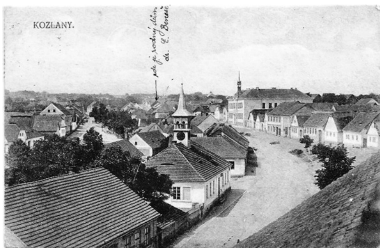
Obr. 2 – Kozlanské náměstí na historické pohlednici z přelomu 19. a 20. století.