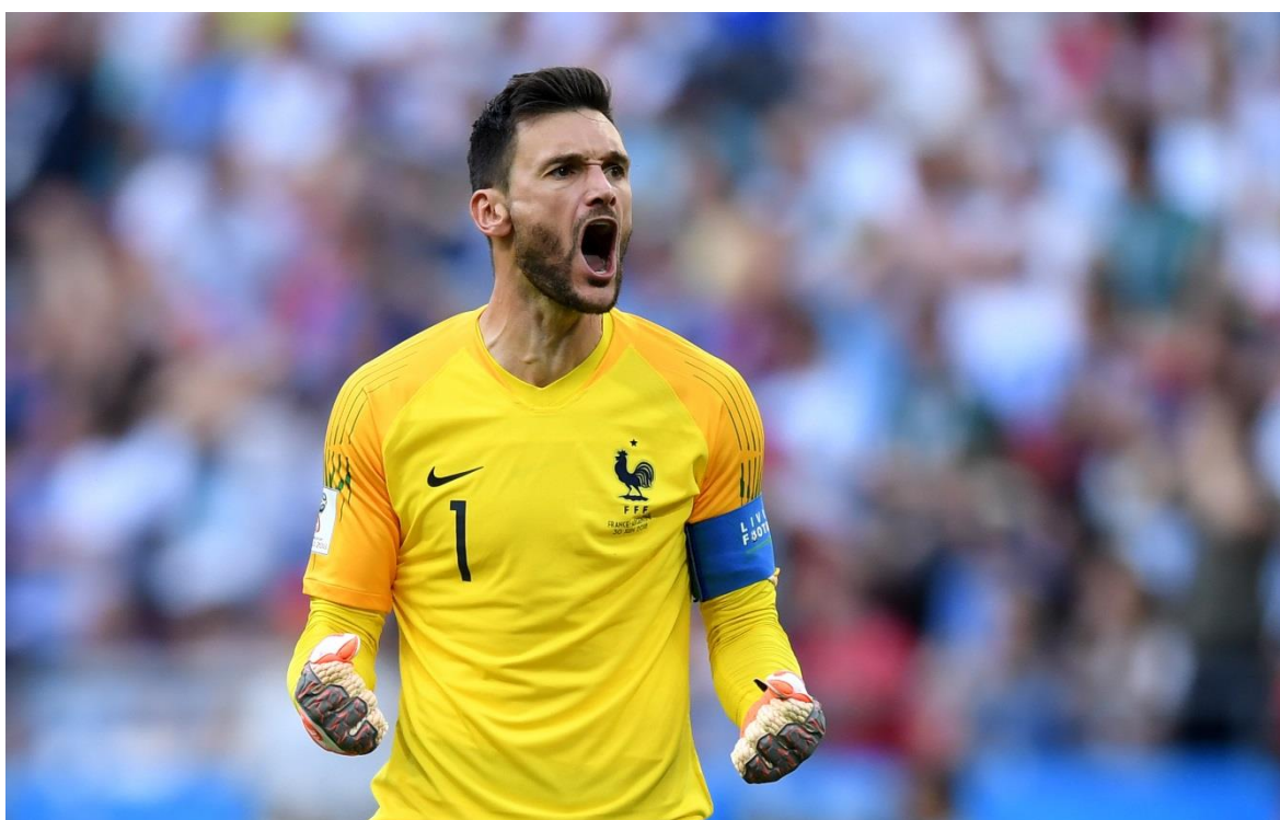
Obrázek č. 2 – Hugo Lloris