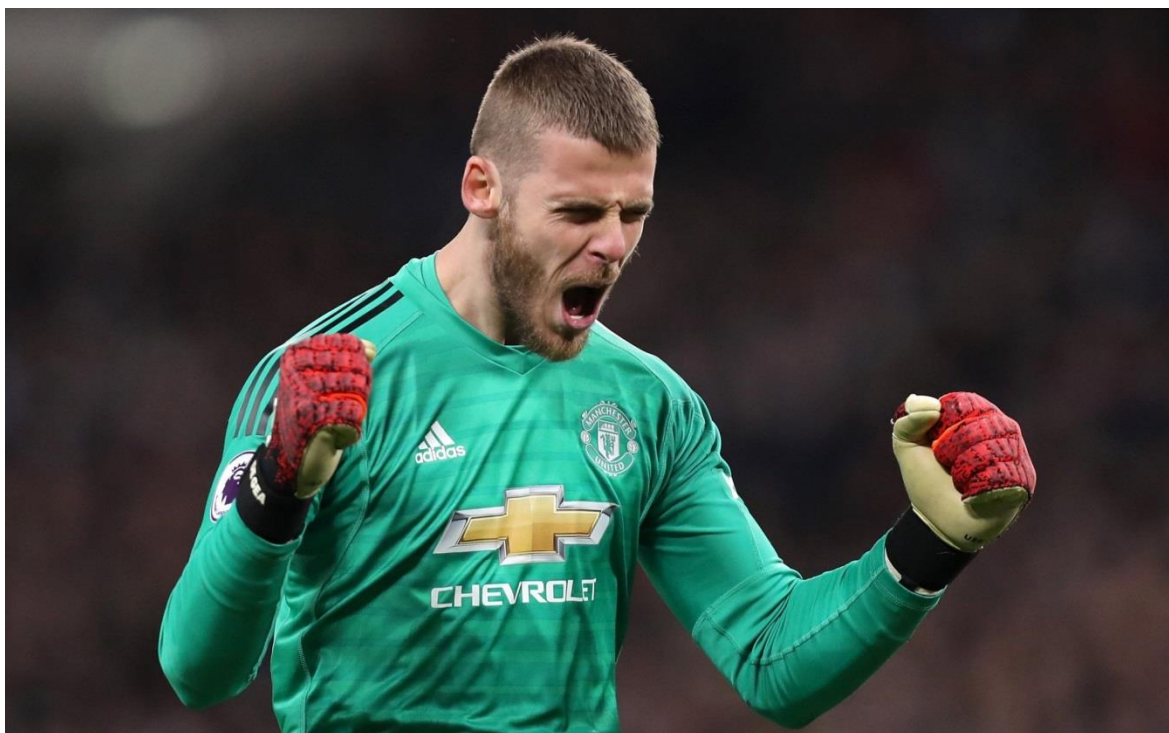
Obázek č. 7 - David de Gea