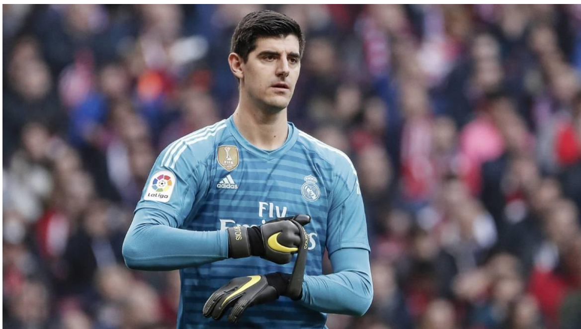
Obrázek č. 5 - Thibaut Courtois