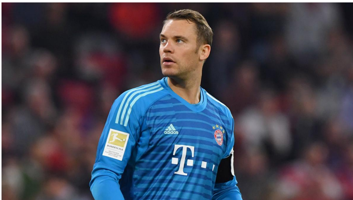
Obrázek č. 1 – Manuel Neuer