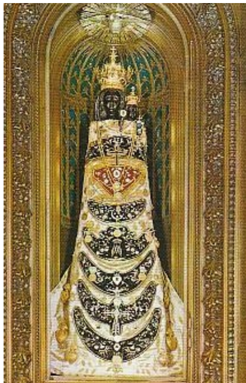
Obr. 4 - Loretánská Panna Marie – originál v Loretu