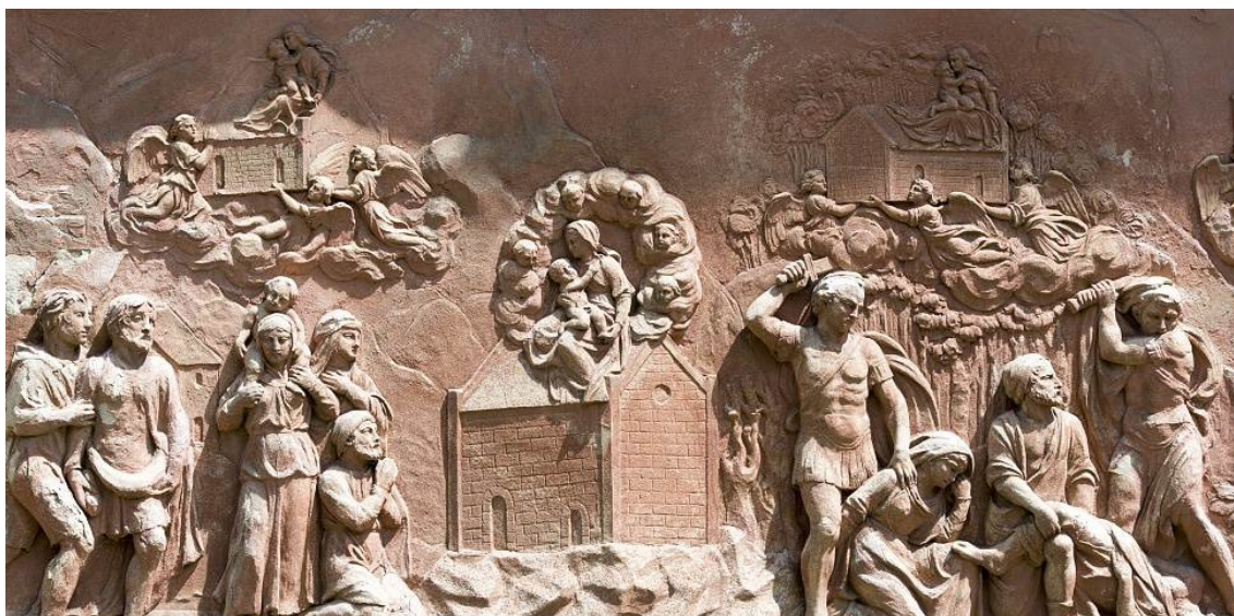
Obr. 17 - Štukový reliéf s námětem Přenesení nazaretského domku anděly do Itálie, Rumburk, jižní strana loretánské kaple.