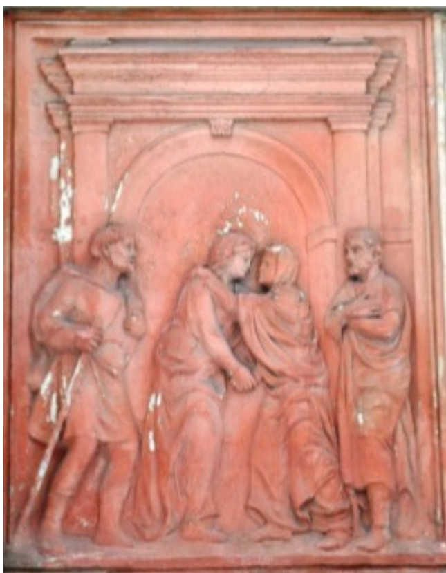
Obr. 12 - Štukový reliéf s námětem Navštívení Panny Marie, severní strana loretánské kaple, 1.