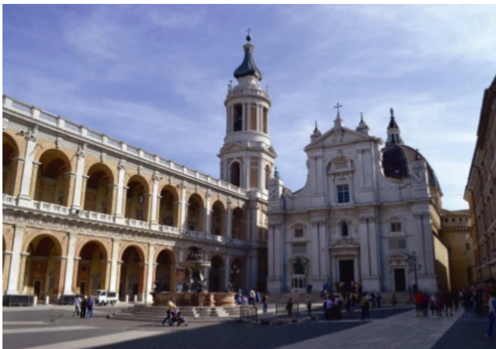
Obr. 2 – Bazilika postavená nad Loretánskou kaplí v Itálii.

Zdroj: BUKOVSKÝ, Jan. Loretánské kaple v Čechách a na Moravě . s. 10.