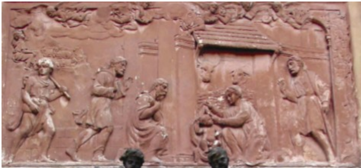
Obr. 15 - Štukový reliéf s námětem Klanění pastýřů, Rumburk, západní strana loretánské kaple.