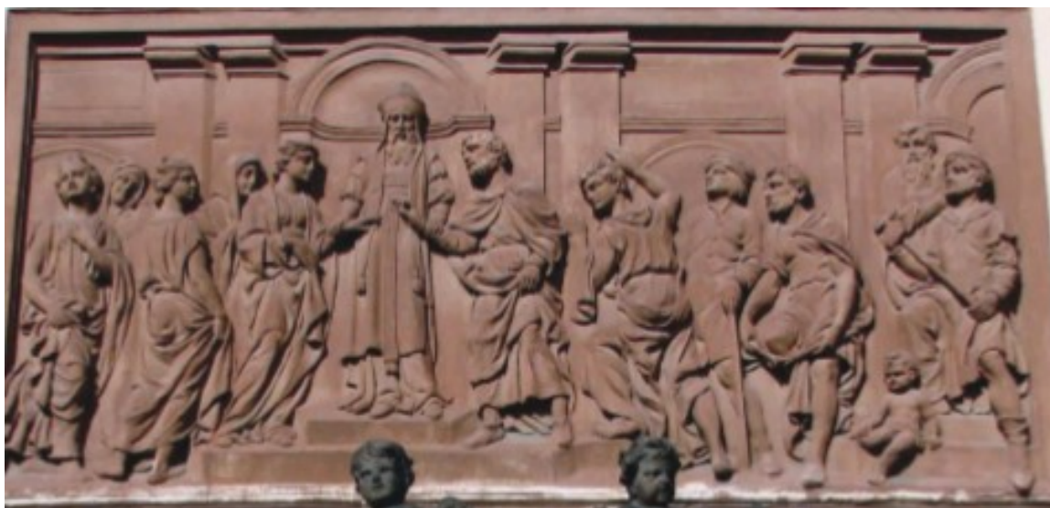
Obr. 11 - Štukový reliéf s námětem Zasnoubení sv. Josefu, po 1709, Rumburk, východní strana loretánské kaple.