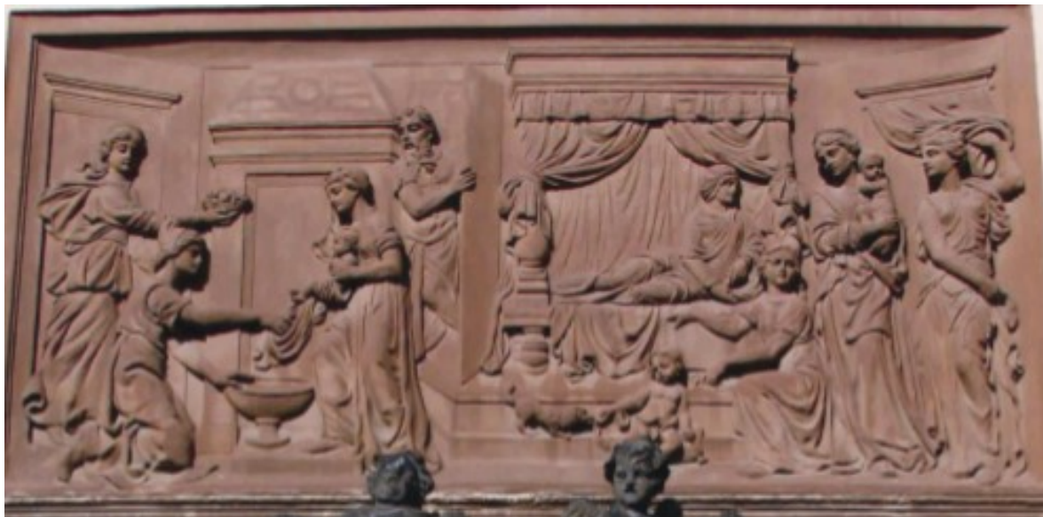
Obr. 9 - Štukový reliéf s námětem Narození Panny Marie, Rumburk, severní strana loretánské kaple.