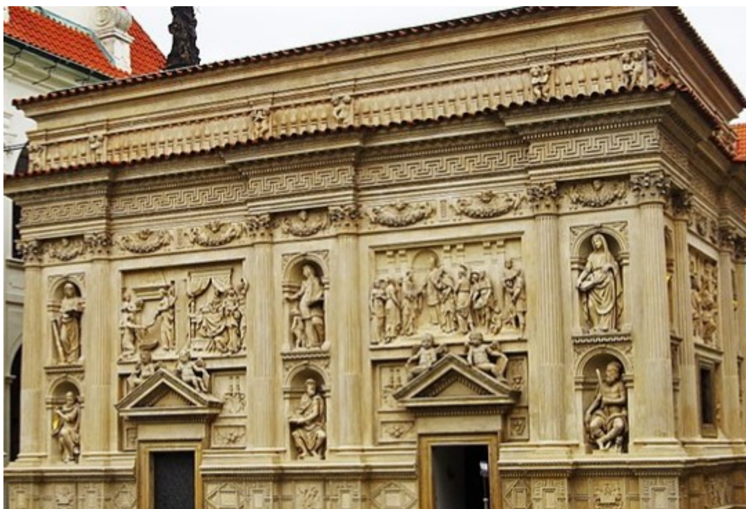
Obr. 18 – Loretánská kaple Panny Marie, součást Pražské Lorety na Hradčanech.