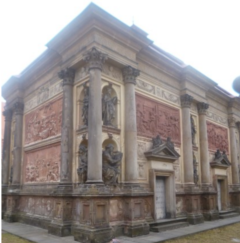
Obr. 19 – Rumburská Loretánská kaple Panny Marie, znázornění barevných tónů.