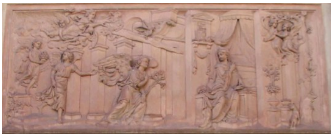
Obr. 10 - Štukový reliéf s námětem Zvěstování Panny Marie, Rumburk, severní strana loretánské kaple.