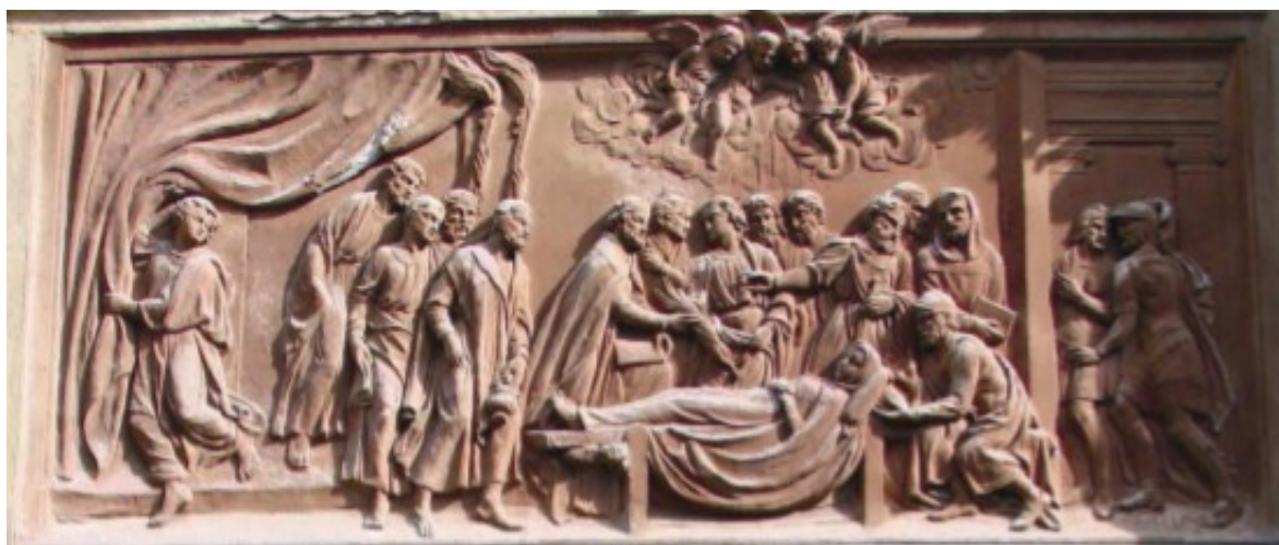
Obr. 16 - Štukový reliéf s námětem Smrt Panny Marie, jižní strana loretánské kaple.