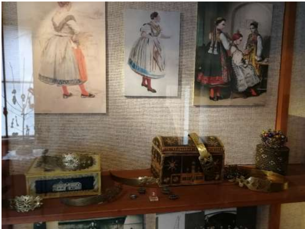
Obrázek 10 – Svatební truhličky. Foto Zuzana Marhanová, 2020. Expozice NMP.