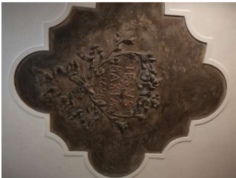
Obrázek 5 – štuková výzdoba s nápisem IESVS MARIA 1698 v Lékárně U Černého orla v Plzni. Foto Zuzana Marhanová, 2020. Expozice NMP.