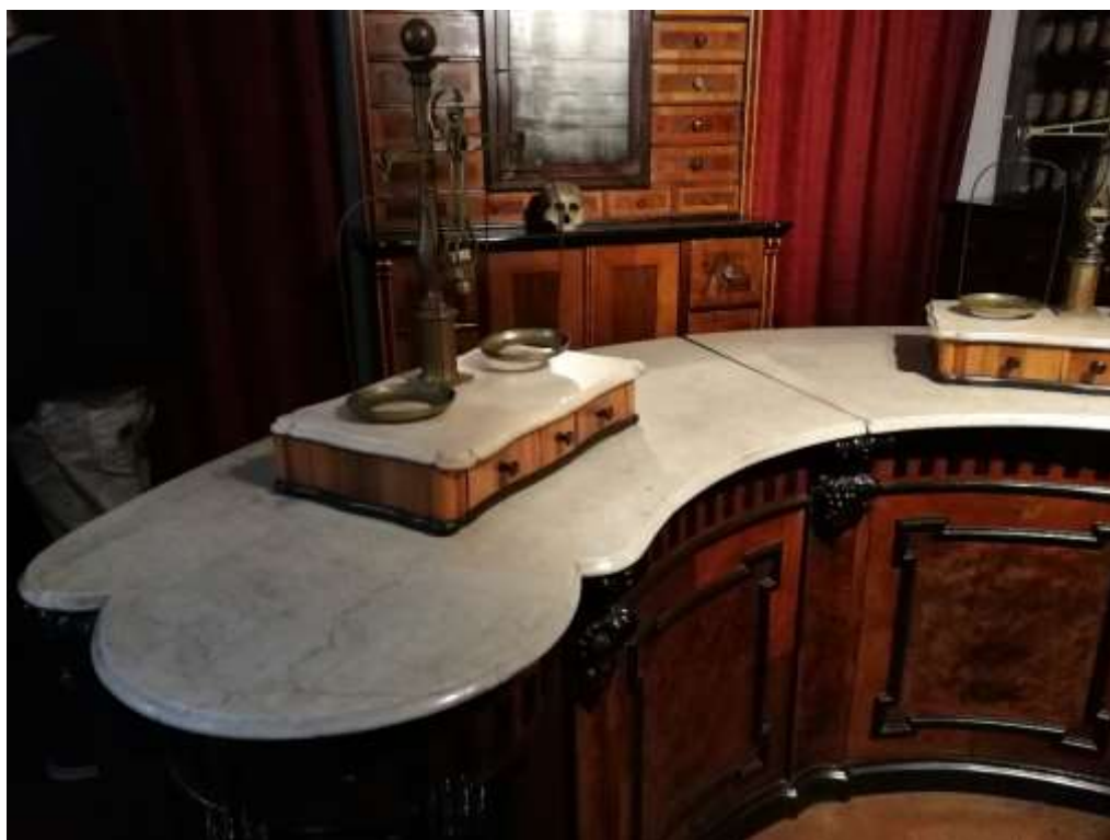
Obrázek 6 – Lékárna U Černého orla v Plzni. Foto Zuzana Marhanová, 2020. Expozice NMP.