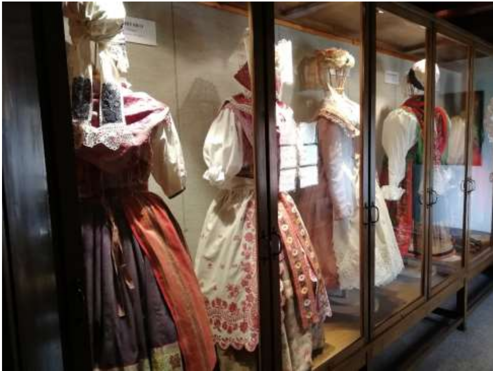
Obrázek 9 – Lidové kroje. Expozice NMP.