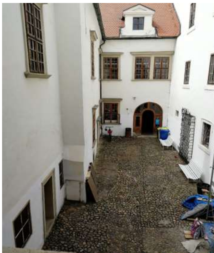
Obrázek 12 – Renesanční lodžie. Foto Zuzana Marhanová, 2020.