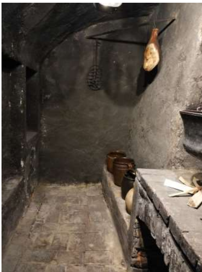
Obrázek 7 – Černá kuchyně. Foto Zuzana Marhanová, 2020. Expozice NMP.