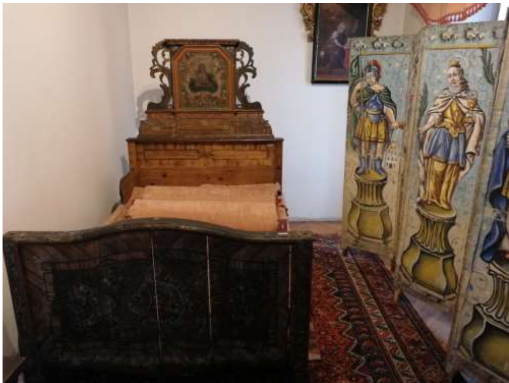
Obrázek 4 – Barokní ložnice. Expozice NMP.