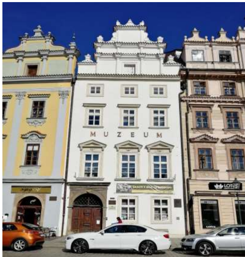
Obrázek 1 - Chotěšovský dům.