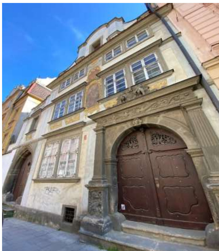
Obrázek 2 - Gerlachovský dům. Foto Zuzana Marhanová, 2020.