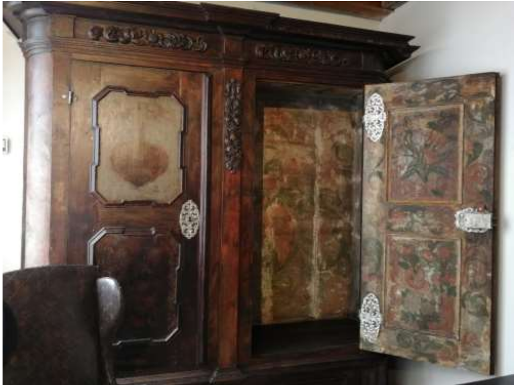
Obrázek 3 – pozdně gotická měšťanská skříň. Foto Zuzana Marhanová, 2020. Expozice NMP.