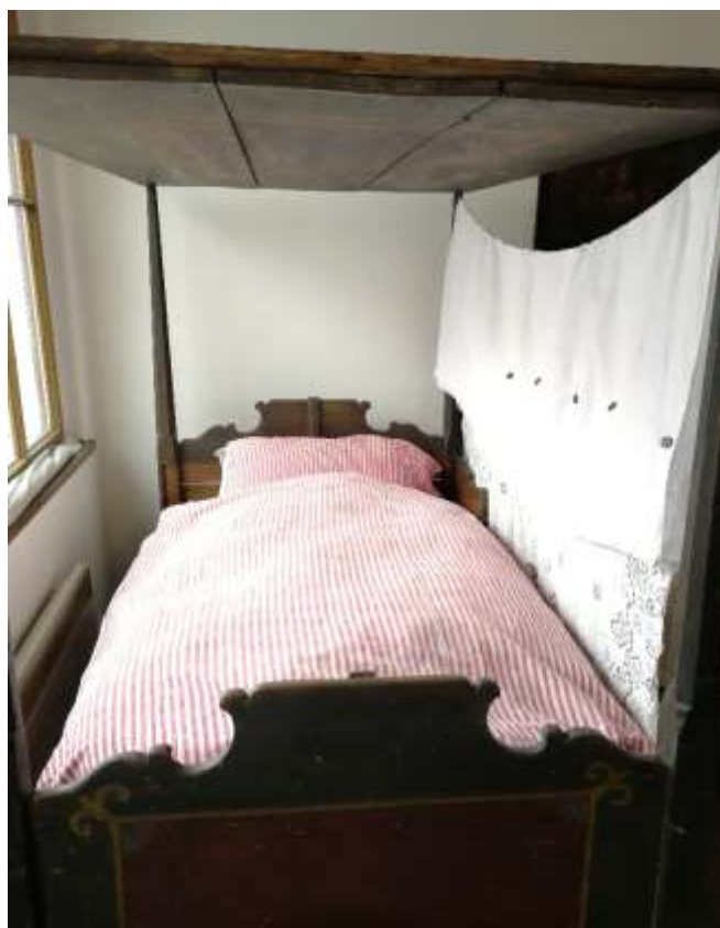
Obrázek 11 – postel s nebesy pro rodičky. Foto Zuzana Marhanová, 2020. Expozice NMP.