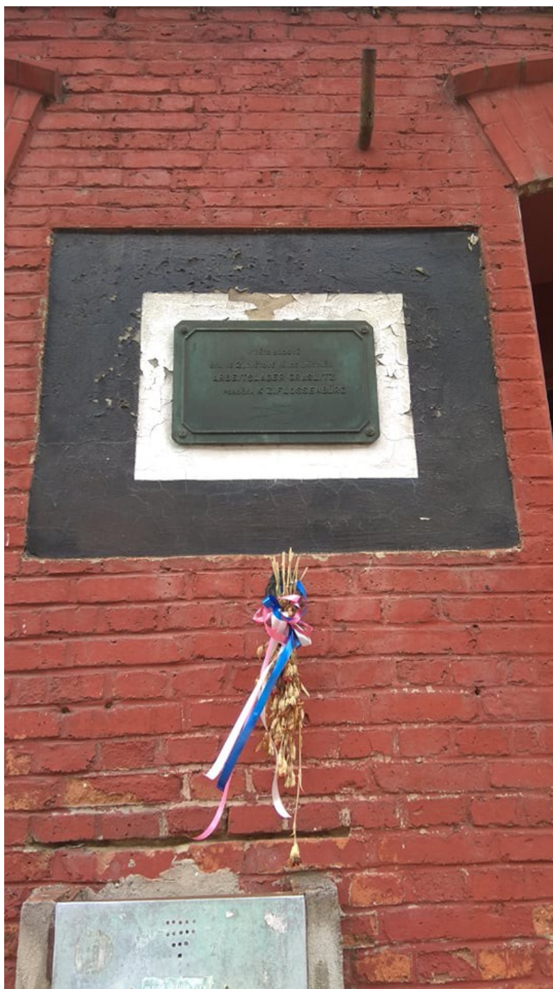
Příloha č. 15: Pamětní deska na připomenutí pracovního tábora z doby 2. světové války na budově dnešní firmy Sametex 166