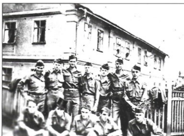
Příloha č. 3: Druhé družstvo 1. čety B 26. pluku v Kraslicích 154