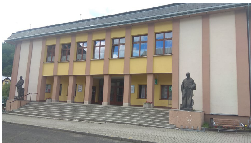
Příloha č. 14: Dnešní Kulturní dům města Kraslice 165