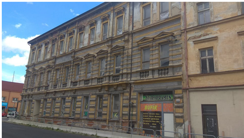
Příloha č. 13: Bývalá budova Městského národního výboru 164