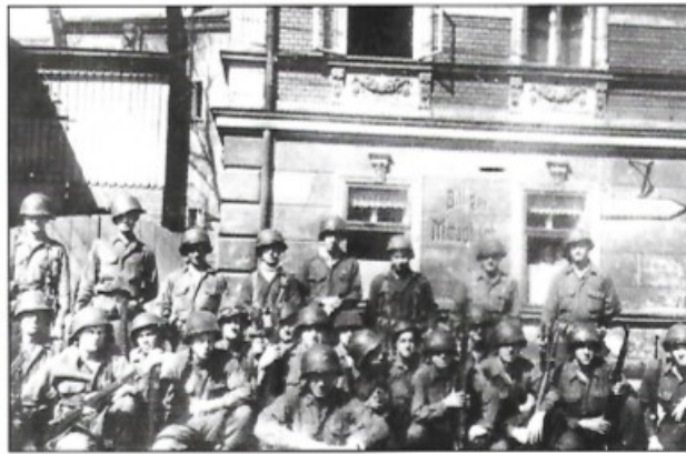
Příloha č. 4: První četa roty B 26. pěšího pluku v Kraslicích 155