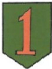
Příloha č. 8: Štítek na uniformách 26. praporu motorizované pěchoty 1. pěší divize 159