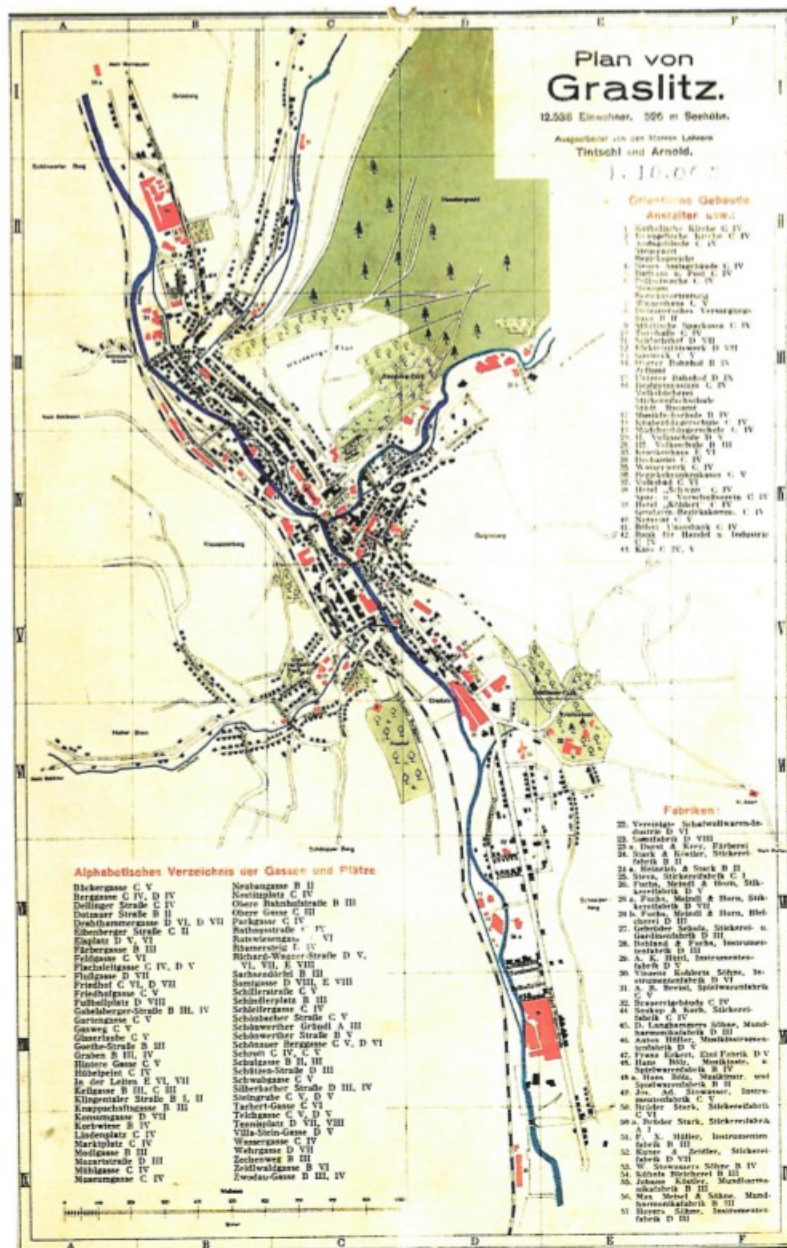
Příloha č. 1: Mapa Kraslic před rokem 1945 152