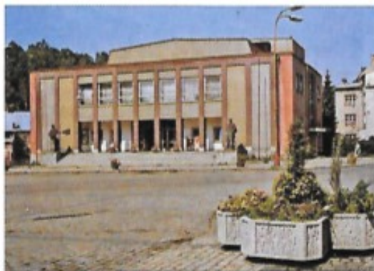
Příloha č. 10: Všeodborový dům kultury po dokončení v roce 1963 161